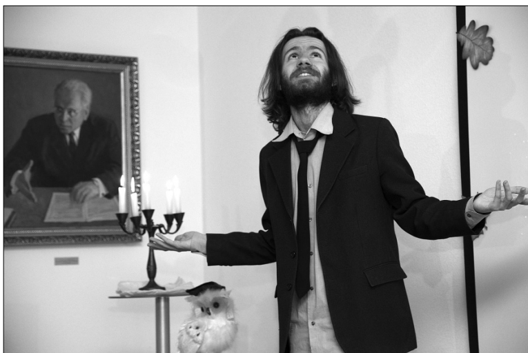
■ Писатель, не верящий в чудеса

Студенческий актив Гуманитарно-педагогического института провёл третий поэтический вечер «Ренессанс». На этот раз тема мероприятия была выбрана необычная — мистика.