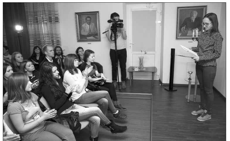
■ Уютная гостиная Дома учёных