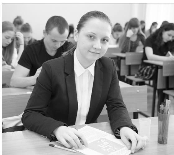
■ Непростые вопросы и непростые ответы...