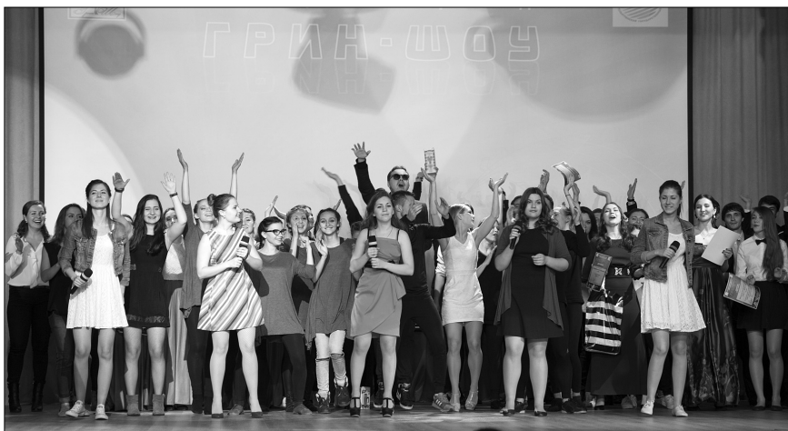
■ Фееричный финал

С амые активные, самые яркие, они успевают не только вовремя сдавать сессии, но ещё и выступать на сцене. И совсем не важно, что это отнимает немало времени, студенты ТГУ легко совмещают учёбу и творчество! А всё потому, что каждый год у нас в университете проходят различные конкурсы, которые раскрывают творческий потенциал ребят. Среди этих конкурсов — фестиваль творческих дебютов «Грин-шоу», гала-концерт которого прошёл 5 ноября в актовом зале ТГУ.