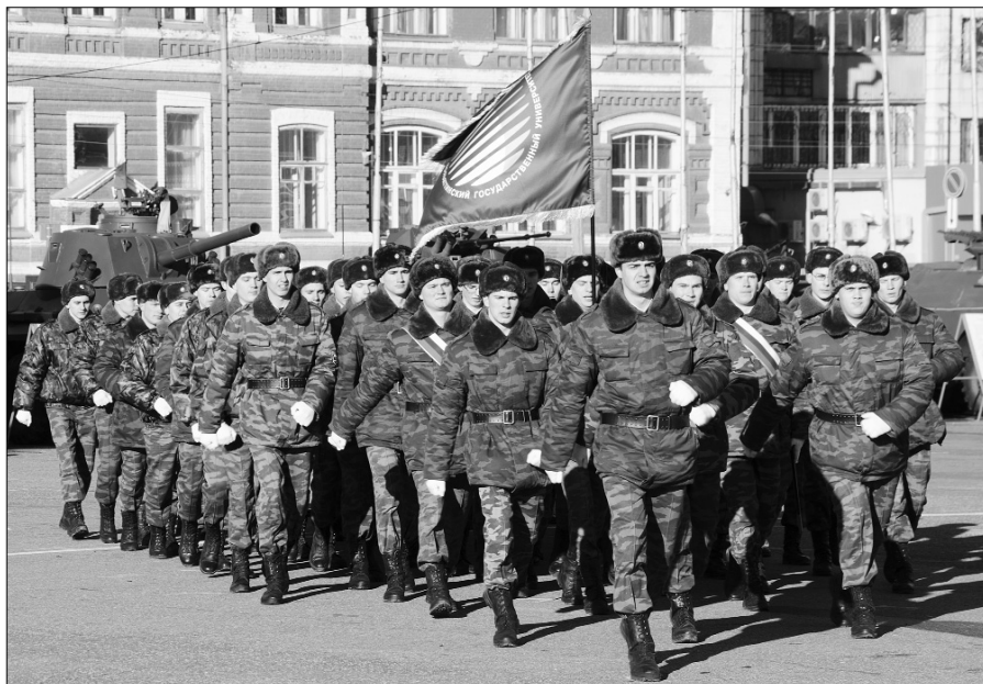
■ Чеканят шаг студенты ТГУ

Официальное начало торжественного мероприятия — в полдень, но жители и гости