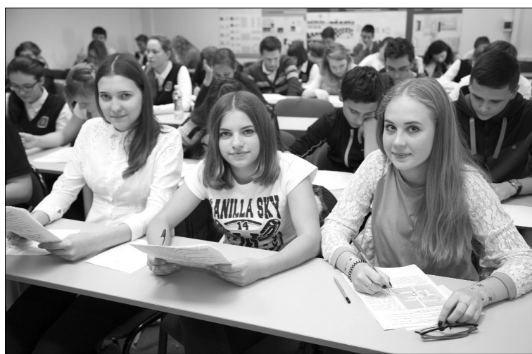
■ Аудитории УЛК были заполнены!

В стенах Гуманитарно-педагогического института прошла городская олимпиада по обществознанию для школьников 9 — 11-х классов общеобразовательных учреждений.