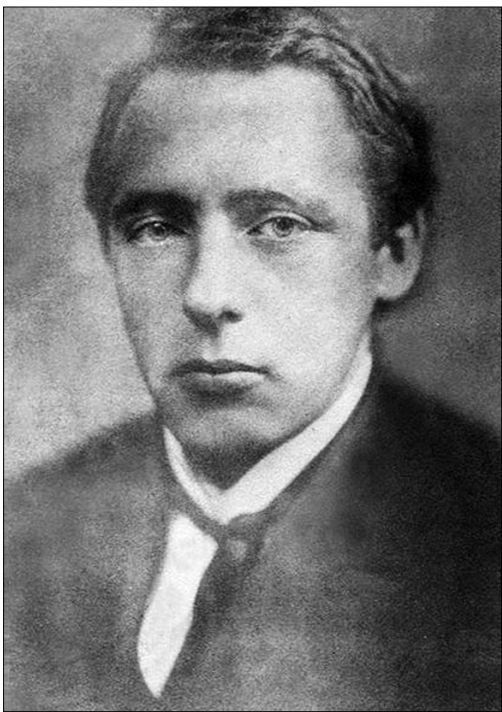
■ Велимир Хлебников