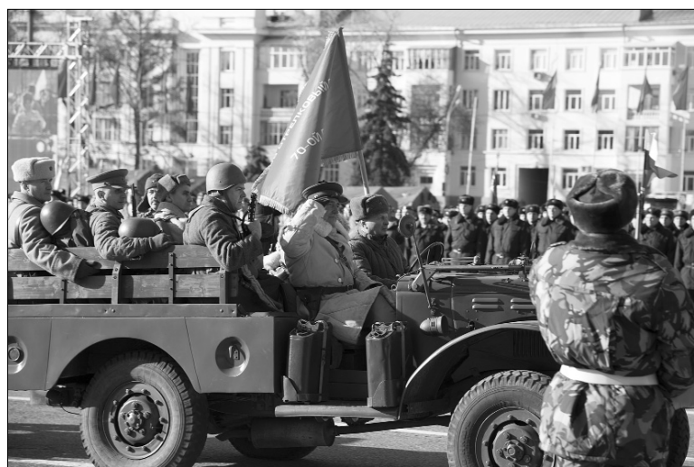
■ Историческая реконструкция парада 1941 года