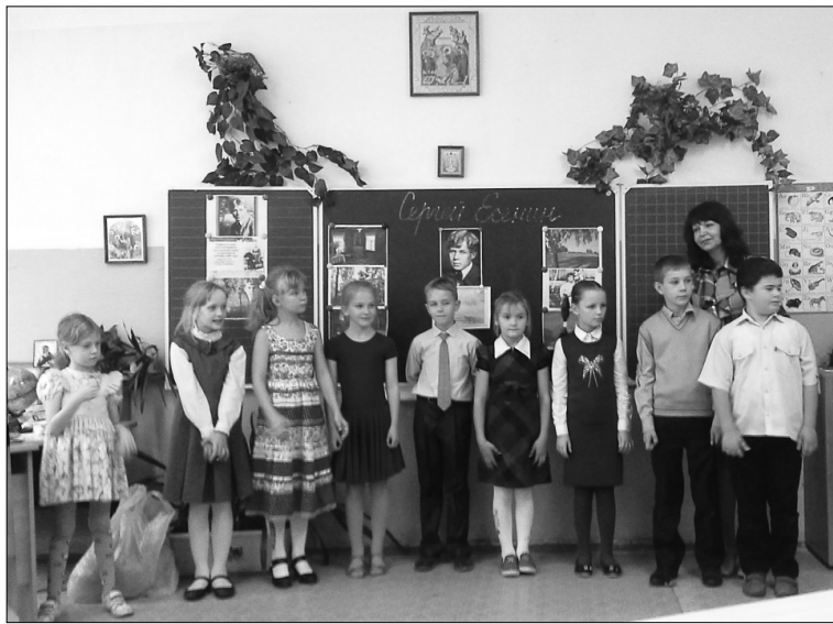
■ Юные участники литературных чтений

В о Всероссийский день лицеиста, 19 октября 2015 года, в подшефной Дому учёных ТГУ школе посёлка Фёдоровка в рамках Года литературы прошли малые Есенинские чтения.