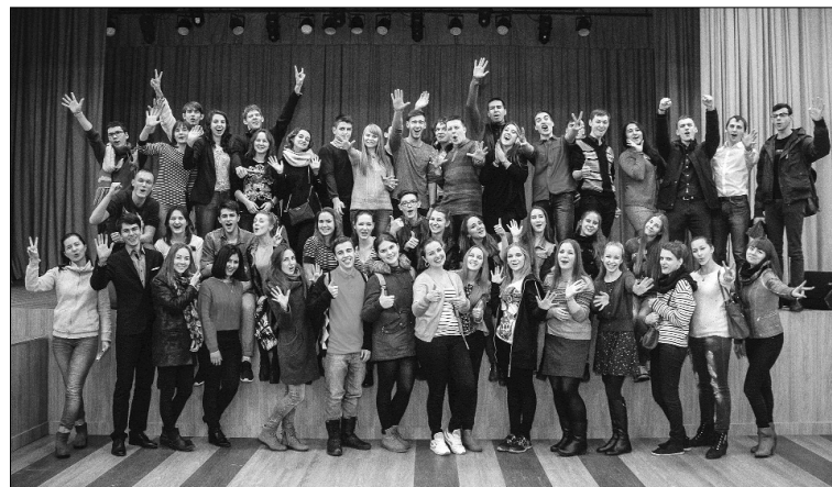
■ Family ТГУ

В отличие от прошлого года нынешняя «Академия первокурсника» будет проходить в два дня — 28 и 29 ноября, в корпусе ТГУ на Фрунзе, 2г. Участники и кураторы будут оцениваться на всех этапах: работа в команде, посещение лекций, результаты тестирования и защиты проектов. Лучшие из лучших будут награждены памятными подарками от Профкома студентов и аспирантов на церемонии закрытия академии. Какие именно будут подарки, орга-