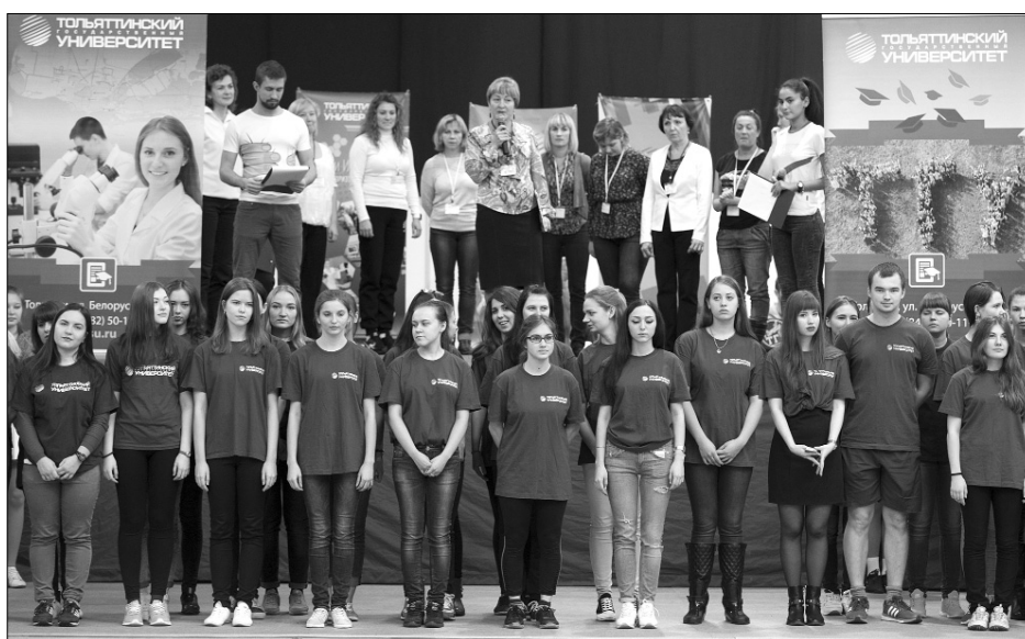
■ Марафон под эгидой ТГУ

И нститут физической культуры и спорта Тольяттинского государственного университета 29 октября в УСК «Олимп» организовал шестой грандиозный «Марафон-аэробика». Марафон зародился в Тольяттинском государственном университете в 2010 году, а в 2013-м вышел на всероссийский уровень. Мероприятие прошло в рамках спартакиады боевых искусств «Непобедимая держава».