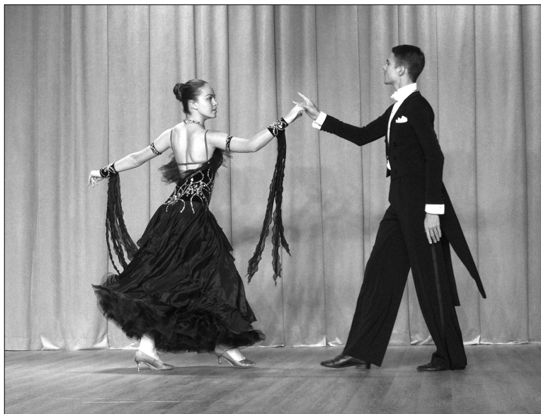
■ «Среди шумного бала...»

26 октября в актовом зале главного корпуса ТГУ прошёл первый отборочный тур фестиваля творческих дебютов «Грин-шоу».