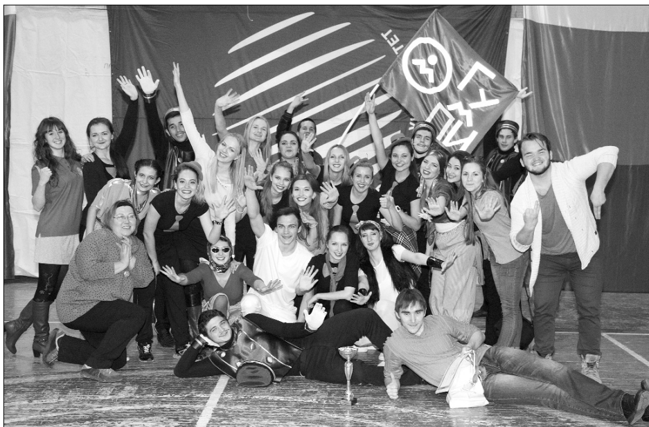
■ Самые спортивные первокурсники — в ГумПИ

Т ГУ — старейший университет Тольятти, со своей историей, культурой и традициями. Среди тольяттинских вузов ТГУ славится своей внеучебной деятельностью, в том числе и спортивной. Одна из интересных спортивных традиций альма-матер — «Универсиада первокурсника».