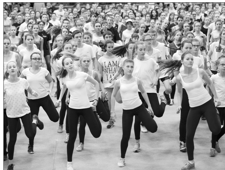
■ Аэробика — это энергия!