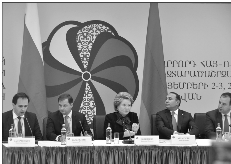
■ Президиум форума

ние между вузами двух стран партнёрских отношений в области разработки и развития совместных образовательных программ, организации электронной и дистанционной форм обучения и укрепления двусторонних связей между высшими учебными заведениями и предприятиями России и Армении. Кроме того, соглашение предусматривает совместное проведение мероприятий научно-образовательного и инноваци-