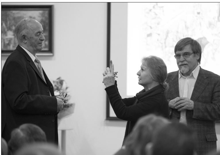
■ Диалог о живописи

«Снова осень закружила карусель мелодий»... В осенние дни так хочется вспомнить о лете, ласковом и радужном. В Доме учёных ТГУ 22 октября прошло ставшее уже традиционным заседание под названием «Как я провёл этим летом». За вечер его участники словно выложили мозаику летнего панно — со всеми его красками и переливами.