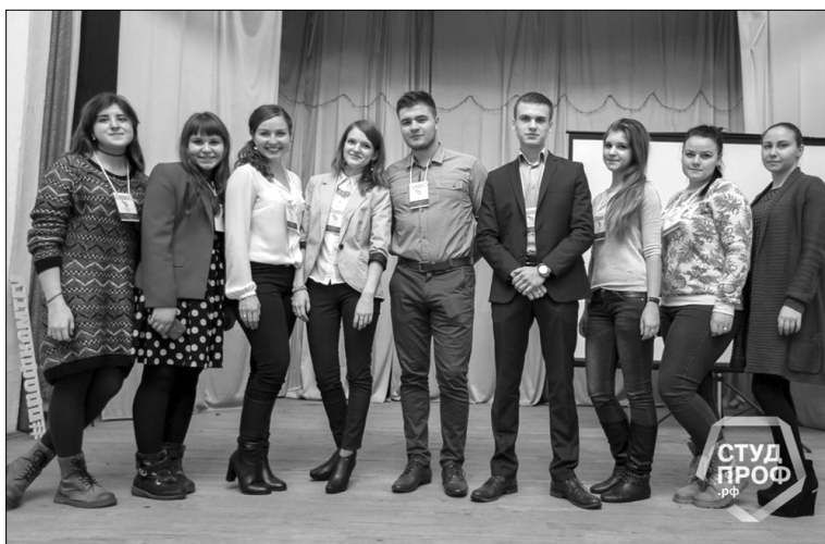
■ Делегация Самарской области

По количеству вопросов, задаваемых по итогам докладов, а их было по семь на