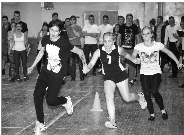
■ Эстафета — к победе только вместе!