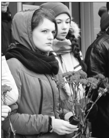
■ Студенты ТГУ почтили память погибших