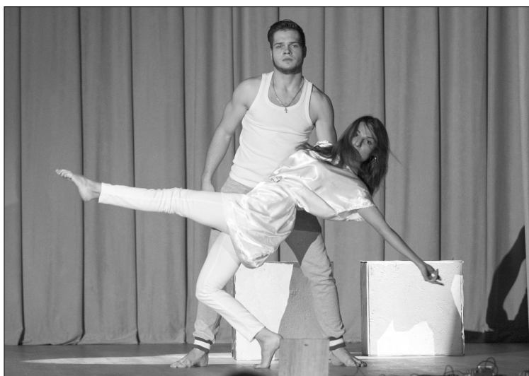
■ Отражение песни в танце

Конечно, зал получал удовольствие от такого зрелища, хотя за кулисами не всё было так просто и весело. Причиной тому — волне-