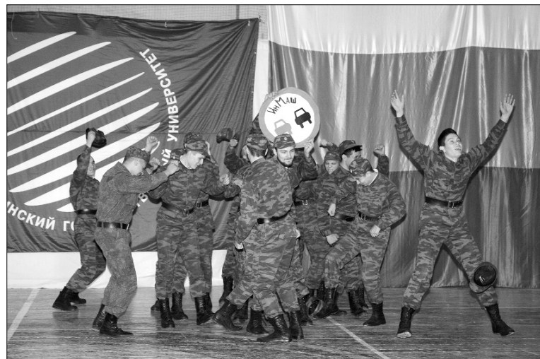
■ Болельщики ИнМаш — самые-самые