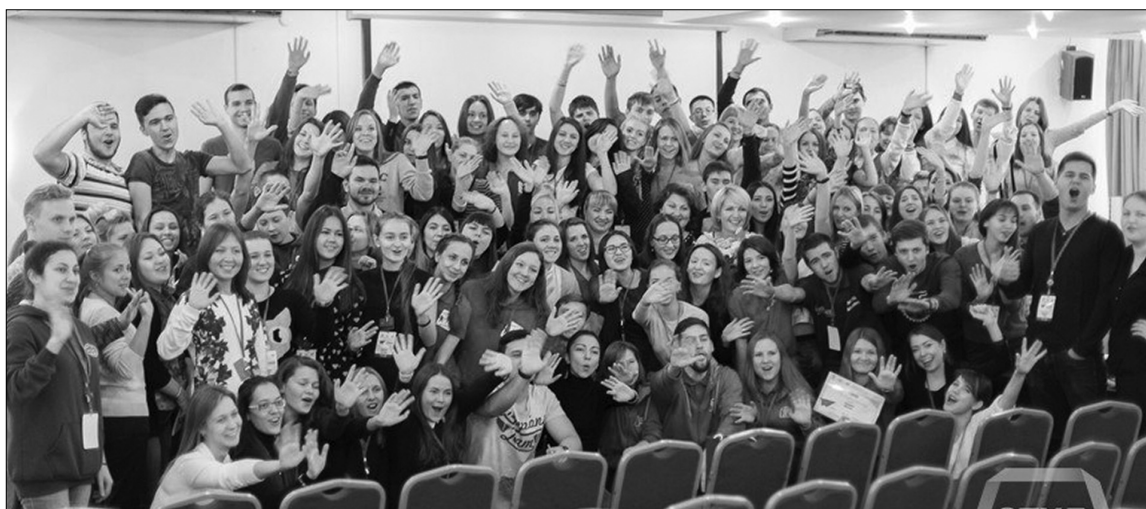
■ Студенческий актив ПФО

Н ичто не радует так студента, как сладкое слово «стипендия». Ну, если он, конечно, обучается на бюджетной основе. А знаете ли вы, сколько существует видов стипендий? Как они распределяются? Это легко можно изучить. За новыми знаниями и опытом три студентки Тольяттинского государственного университета отправились в Казань.