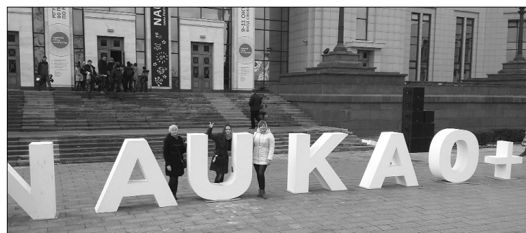
■ На Фестивале науки в Москве