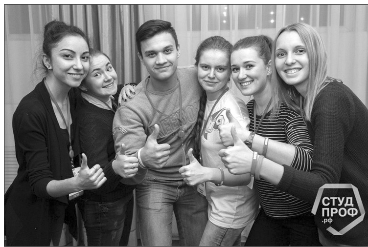
■ Посланцы городов Поволжья

«Самая, как мне кажется, сокровенная вещь, которой дорожат студенты, — это, ко-