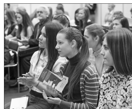
■ «Пицца» для ума и души