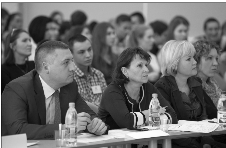
■ Проекты — в фокусе внимания жюри