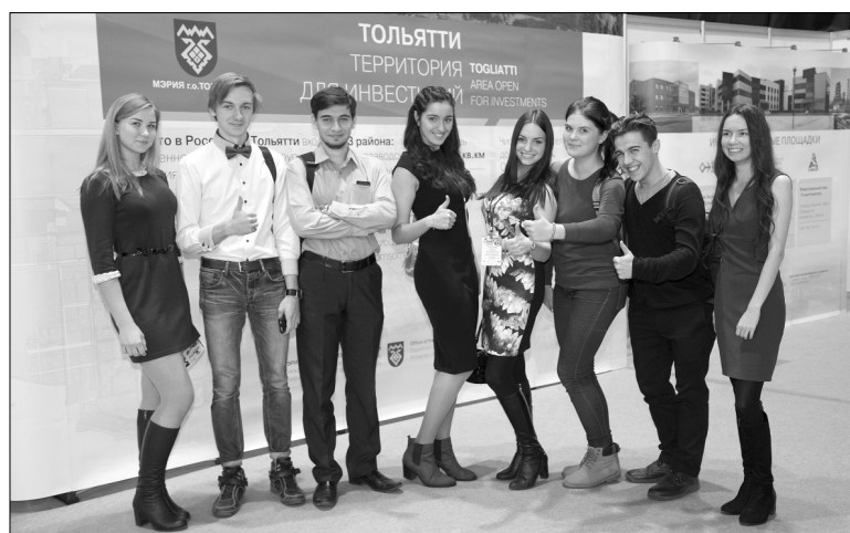
■ Будущее города — студенты ТГУ

Два дня, 22 и 23 октября, в УСК «Олимп» проходил форум «Город будущего. Тольятти-2015». В его работе приняли участие сотрудники, преподаватели и студенты Тольяттинского государственного университета.