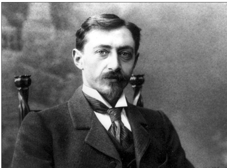
■ Иван Бунин

В октябре исполнилось 145 лет со дня рождения великого русского писателя и поэта, первого лауреата Нобелевской премии по литературе из России (1933 год) Ивана Бунина .