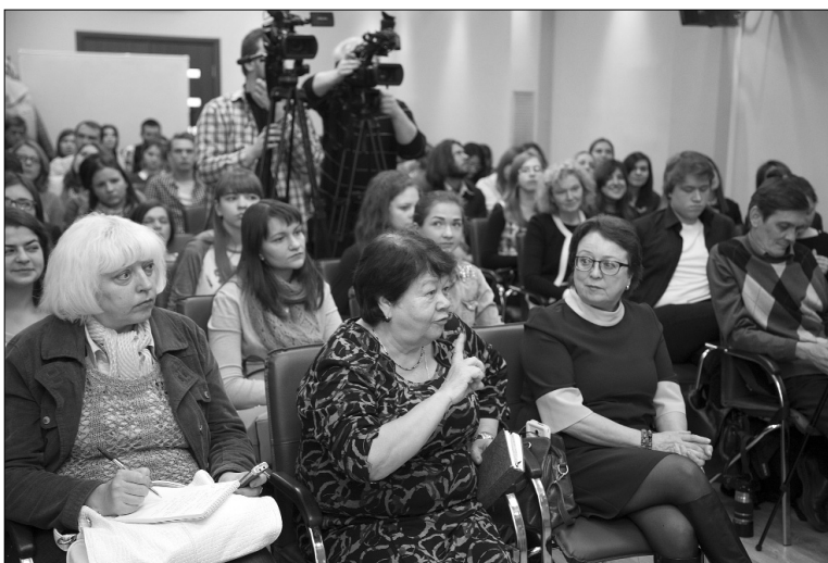
■ Каков вопрос!

Таким образом, Иван Засурский является автором идеи о том, что «сумма знаний, помноженная на доступ в квадрате, является богатством информационного об-