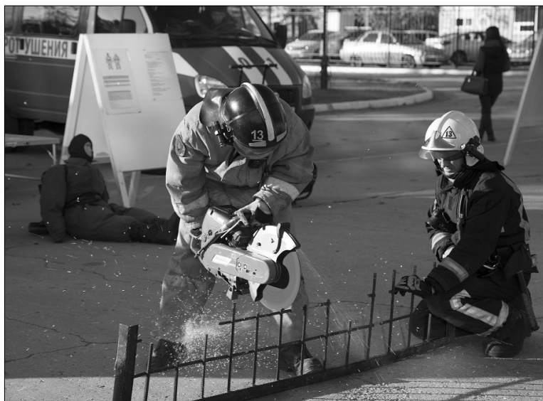
■ Инженер должен уметь всё

Сделать непрямой массаж сердца, облачиться в форму пожарного, измерить уровень шума в помещении — всё это и не только смогли сделать школьники в стенах ТГУ на фестивале инженерно-технических направлений, который проходил 22 и 23 октября в главном корпусе университета.