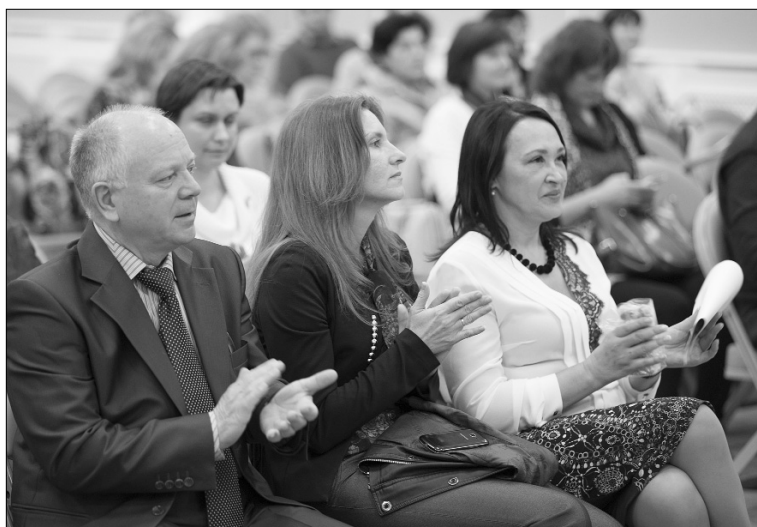
■ Общими усилиями поднимем престиж химии

Институт химии и инженерной экологии ТГУ провёл круглый стол «Вопросы современного химического образования», в котором приняли участие учителя, преподающие химию в школах города.