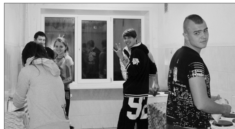
■ На субботнике