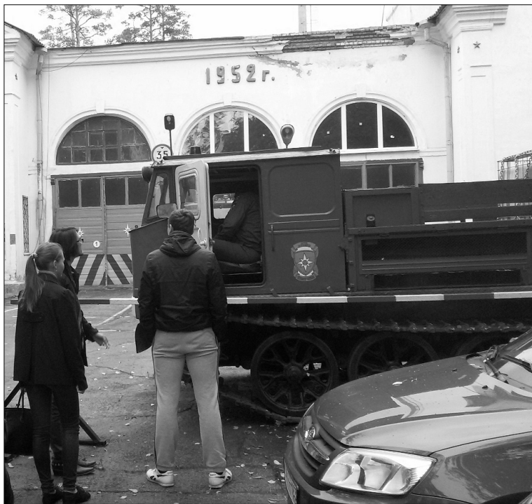
■ Студенты знакомятся с пожарной техникой

Подготовка специалистов для профессиональной деятельности всегда сопряжена с применением лабораторного и практического оборудования. Современные законодательные инициативы позволяют организовывать и проводить учебный процесс с использованием материальной базы промышленных предприятий и организаций. Это и необходимость, поскольку подготовить профессионала, не показав ему существующий уровень производственных технологий и не сориентировав на перспективный, скорее нельзя, чем невозмож-