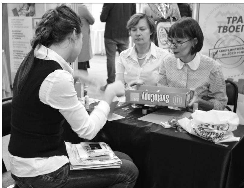
■ Каждый мог сделать выбор на ярмарке вакансий

16 и 17 октября в Тольятти проходила V межрегиональная выставка-форум «Образование. Развитие. Карьера». На площадке УСК «Олимп» было представлено 50 образовательных учреждений Самарской области.