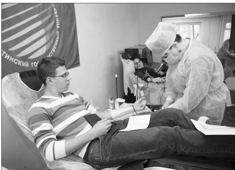
■ Смелые люди — доноры

Огромное количество людей нуждается в переливании крови. Помочь им может практически любой человек. Неравнодушные студенты и преподаватели ТГУ не остались в стороне и приняли участие в традиционном Дне донора.