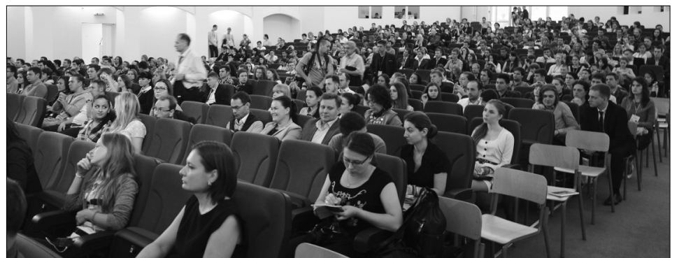
■ Молодые учёные со всей России