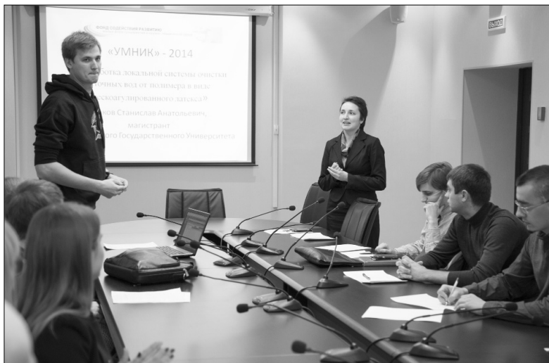
■ Вначале было приветствие...

Полуфинальный этап областного конкурса по про-