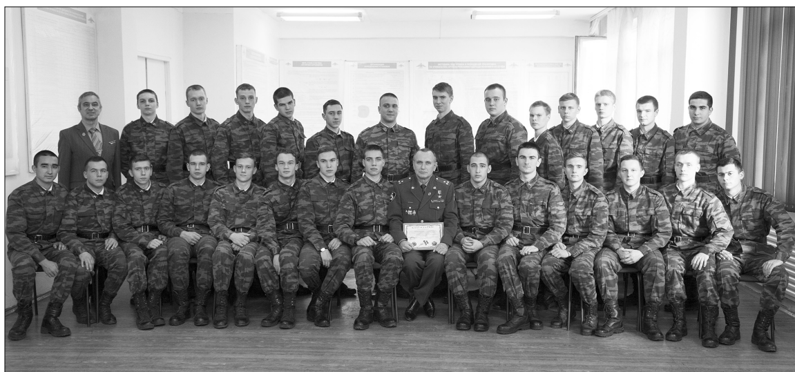
■ Традиционное фото на память