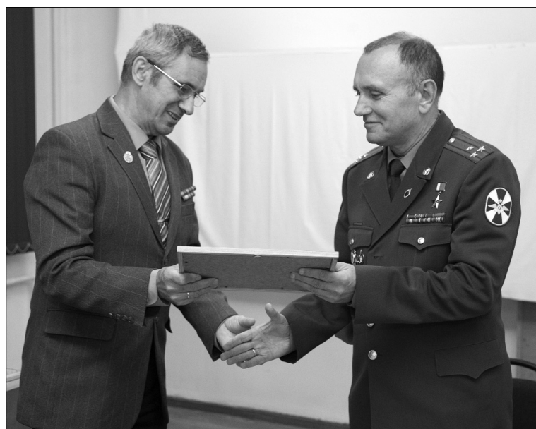
■ Вручение благодарственного письма Герою России

Со своей стороны, мы не имели никакого тяжёлого во-