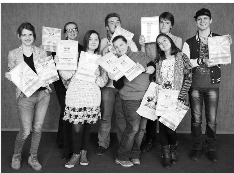
■ Все награды — наши!

«АэроСМИ» — это фестиваль для всех, кто занимается развитием студенческих средств массовой информации; он проводится с целью поддержки и развития современных достижений студенческой прессы. Фестиваль — это ещё и площадка по обмену профессиональным опытом между студентами, которые работают в современных направлениях журналистики, и место, где они могут познакомиться с процессами издания СМИ в вузах губернии. Организаторами «АэроСМИ» выступили студенты Самарского государственного аэрокосмического университета.