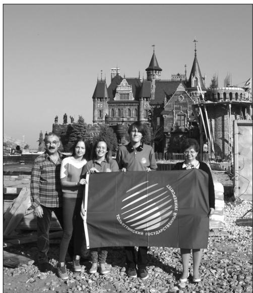
■ ГумПИ на фоне замка

— Выезды в средние школы стали в нашем институте доброй традицией. График поездок согласовывается заранее, в актовом зале собираются выпускники нескольких школ. Например, во время второй поездки в этом учебном году в село Хрящевка на встрече были и гости из соседнего села Белозёрки.