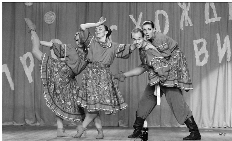
■ Шоу-балет «Театро»

А ты знаешь, откуда берёт свое начало твоя профессия? 6 октября в актовом зале ТГУ первокурсники ГумПИ немного пофантазировали на эту тему. Почему бы и нет? Ведь этот день — их официальное посвящение в студенты.