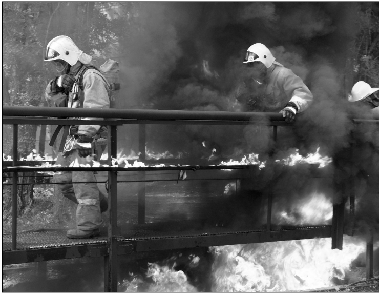
■ «Психополоса» — не для слабаков

Студентам кафедры управления промышленной и экологической безопасностью ИнМаш ТГУ удалось испытать себя огнём на полосе препятствий, именуемой полосой психологической подготовки — «психополосой».