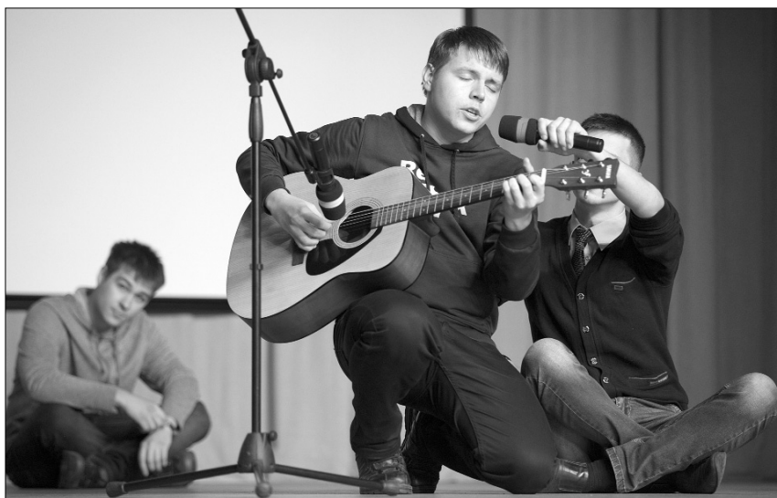
■ Первая проба талантов

В четверг 8 октября все первокурсники ИМФИТа в 16.00 находились в предвкушении необычного... Через несколько минут они должны были пережить одно из главных событий в их жизни — посвящение в студенты.