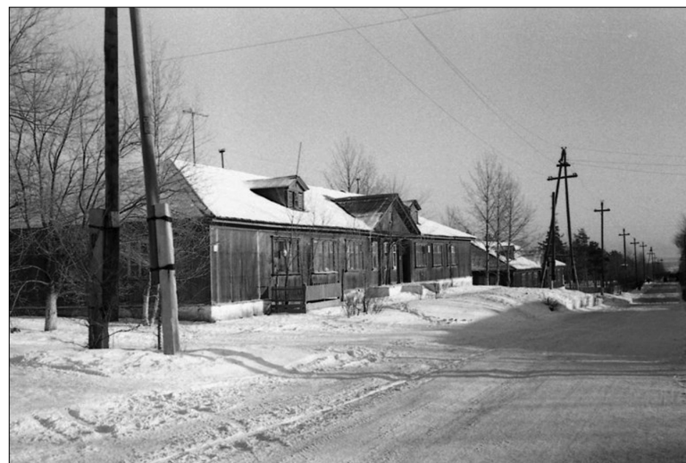
■ Первые дома вольнопоселенцев в Комсомольске. 1950-е годы