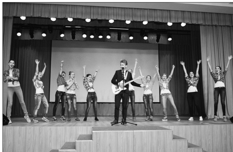
■ Больше фото с посвящений смотри на vk.com/titsa