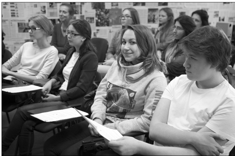
■ Трудно поверить, но речь шла и о формулах!