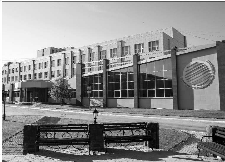
■ ТГУ — территория инноваций

— Тема нашего гранта «Формирование общепрофессиональных компетенций студентов в воспитательной деятельности образовательной организации» связана с той работой, которую осуществляли вузы с 2010 года — момента принятия новых образовательных стандартов. Присоединение России к Болонской конвенции выдвинуло новые задачи в области воспитания студенческой молодежи, которые необходимо рассматривать в профессиональном контексте с позиций компетентностного подхода. Воспитание в вузе — не набор воспитательных мероприятий, его необходимо соотносить с результатами образования, по которым оценивается эффективность работы вуза и качество подготовки выпускников: формированием общекультурных, общепрофессиональных и профессиональных компетенций — такова позиция авторского коллектива. Воспитание в конкретном вузе связано с укладом университетской жизни, его корпоративной культурой, стилем отношений между участниками,