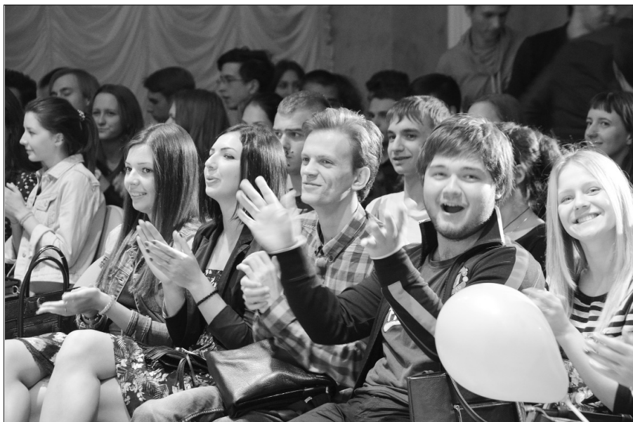
■ Феерия креатива и позитива

Вскоре всех пришедших пригласили в актовую зал, где состоялся концерт. Луч-