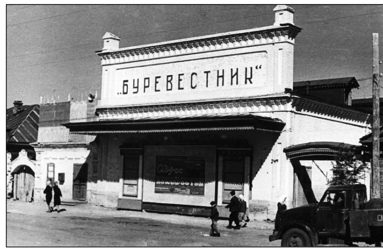
■ Кинотеатр «Буревестник». Начало 1950-х

Наряду со школьным образованием особенно остро