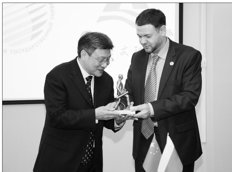
■ Первый студент ТГУ уже уехал в университет г. Шаосин

По словам председателя Совета Шаосинского университета, всё высшее образование в КНР жёстко регулируется