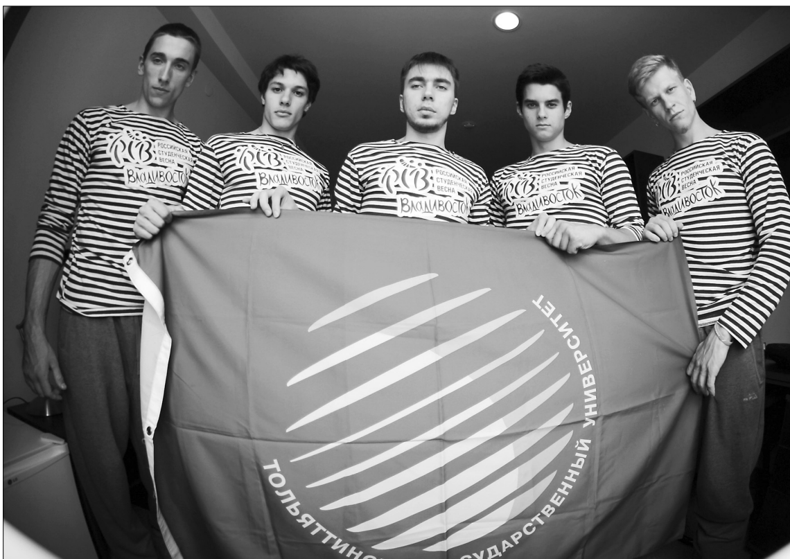
■ Команда VioCube на «РСВ-2015»