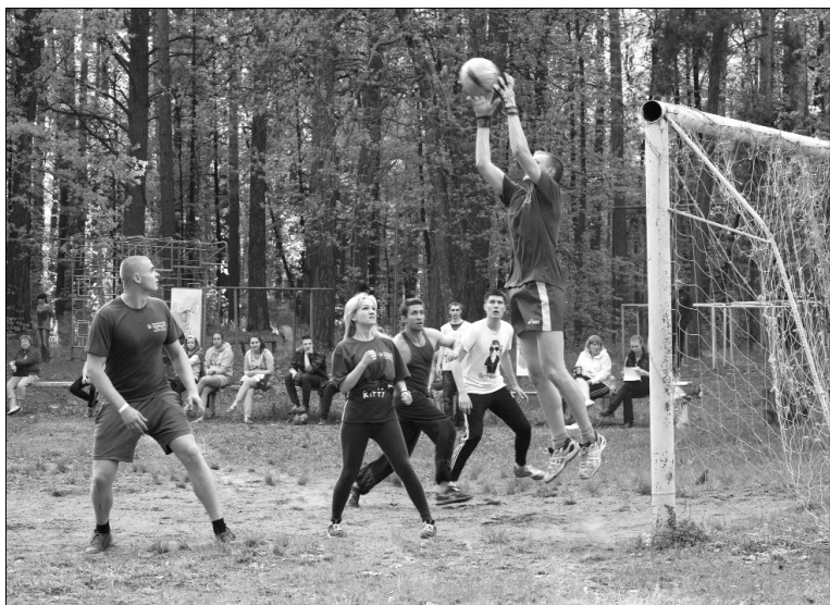
■ Большие страсти на мини-футболе