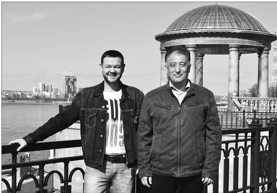
■ За спинами ректоров — китайский город Хэйхэ

Речь идёт о большой химии, машиностроении, энергетике и электротехнике. Тольяттинский госуниверситет является системообразующим вузом для этих отраслей промышленности. Наряду с ними в ТГУ реализуются образовательные программы в сфере строительства, экономики и юриспруденции, а