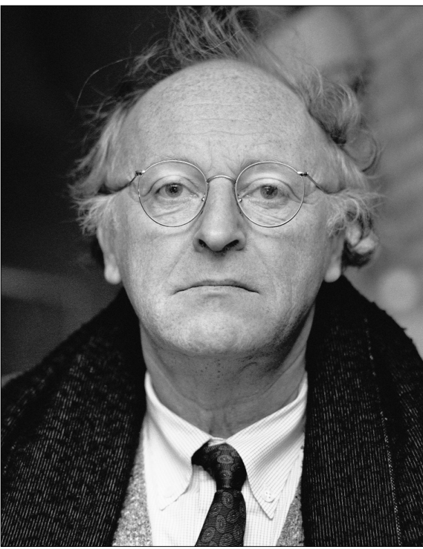
■ Иосиф Бродский

Но времена и нравы жестоки. В ноябре 1963 года в газете «Вечерний Ленинград» появляется статья «Окололитературный трутень», в которой Бродского клеймят за «паразитический образ жизни», цитируют неудачные строки его стихотворений, вырвав из контекста и исковеркав многие из них. Через год в этой же газете публикуется подборка писем читателей, которые якобы требуют наказать «тунеядца Бродского» (за тунеядство в СССР арестовывали). А далее — два суда, приговор и ссылка (пять лет принудительного труда). Письма в защиту Иосифа Бродского были отправлены Дмитрием Шостаковичем , Корнеем Чуковским , Александром Твардовским и другими видными деятелями литературы. Наказание было отменено после полутора лет ссылки. Но в мае 1972 года Бродскому вновь пригрозили тюрьмой и психбольницей, советовали выбрать эмиграцию. Поэт выбрал путь пилигрима, изгнанника («Письма