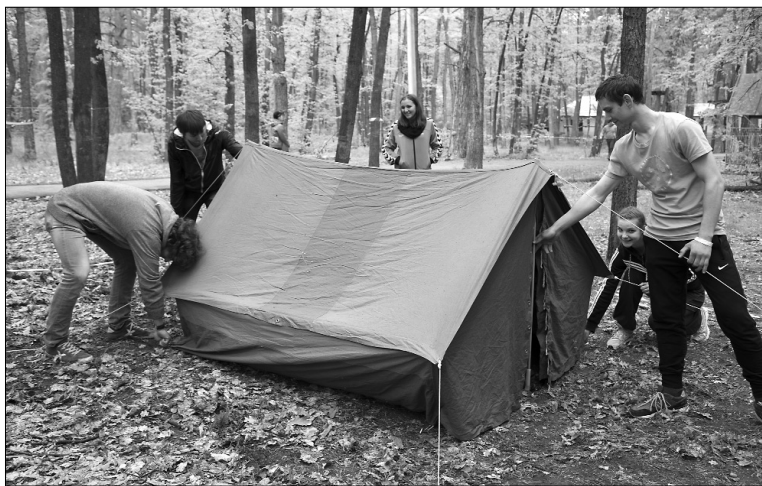
■ Конкурс турнавыков

Самыми главными мероприятиями слёта были, конечно, туристические: техника пешеходного туризма, турист-