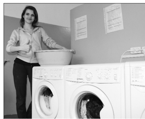
■ Профком одобряет!

Благодаря усилиям студсовета общежития, коменданта, профкома и многих других людей студенты получили полностью отремонтированное помещение, в котором есть две гладильные доски, сушилки для белья и, самое главное, три стиральные машины!