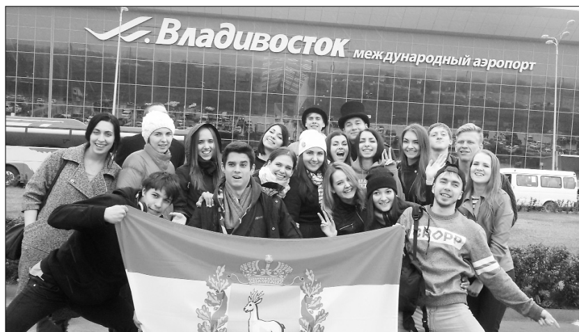
■ Делегация Самарской области