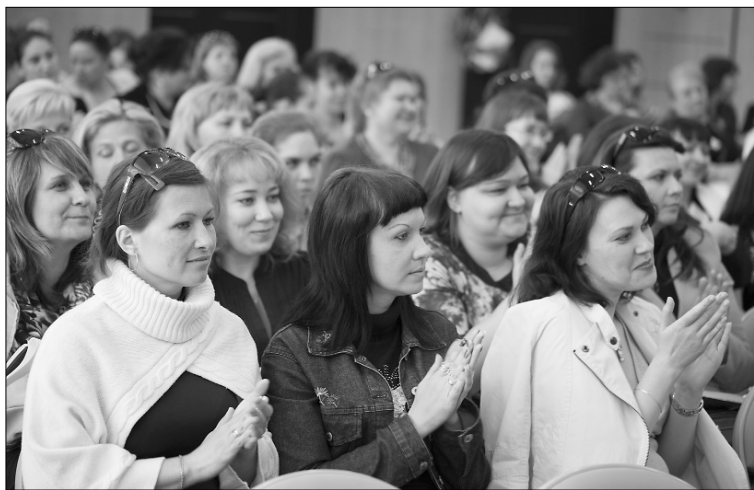
■ Зал внимал психологам

В работе пленарного заседания конференции приняли участие 178 человек, далее в мастер-классах и заседаниях секций участвовали более 200 человек.