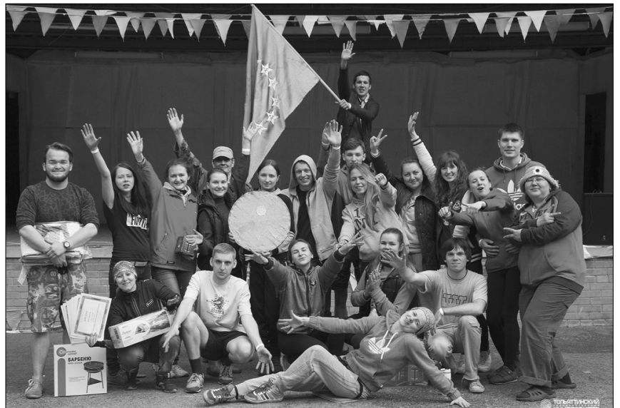
■ ГумПИ — команда победителей