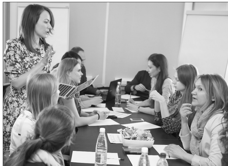
■ Мозговой штурм

партнёров и рассказала о целях проекта: «Мы хотим, чтобы правильные люди узнавали о том, куда можно устроиться на работу, видели новые и интересные проекты, которые появляются в Самарской области».