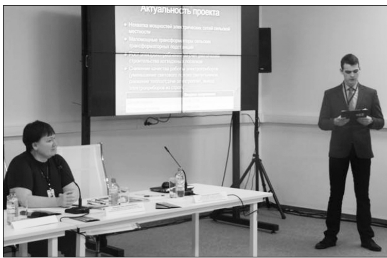
■ Проект защищает Андрей Гишаев

На встрече с журналистами в рамках Недели глава Минтруда Максим Топилин назвал пять самых опасных видов деятельности, которые дают почти 70% погибших от