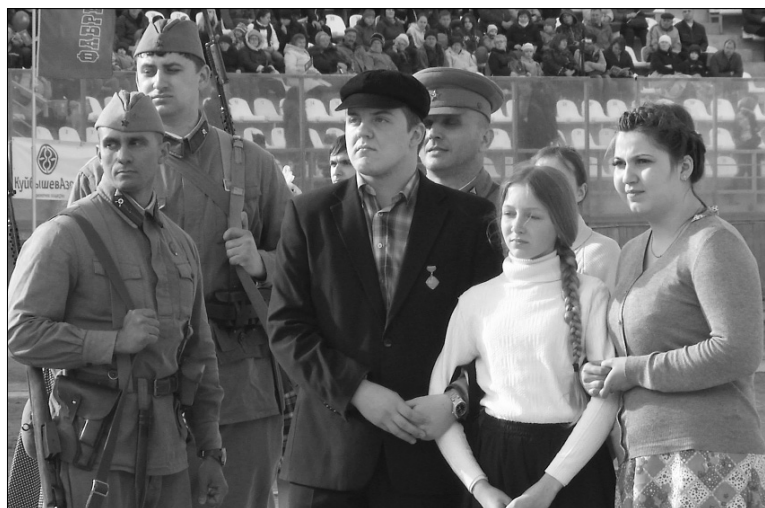
■ Каждый участник постановки вжился в образ

Необычная военно-историческая реконструкция состоялась в СТК имени А. Степанова. Воскресным вечером 26 апреля, по счастью, не было дождя, и горожане, пришедшие на стадион, могли без «стихийных помех» наблюдать масштабную постановку «Битва за Великое Отечество». В ней приняли участие более 100 человек, среди которых было 25 студентов Тольяттинского государственного университета.