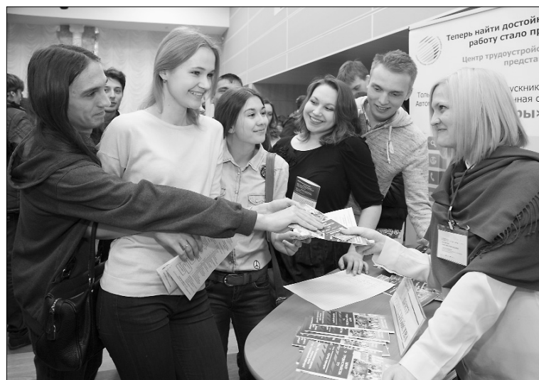
■ Стимул к карьере — обмен информацией

М ногие студенты уже наверняка задумывались о том, продолжать ли обучение после получения диплома бакалавра или идти работать, а также где подработать на каникулах летом. Дать ответы на эти актуальные вопросы был призван «День твоей карьеры», прошедший 23 апреля в ТГУ.