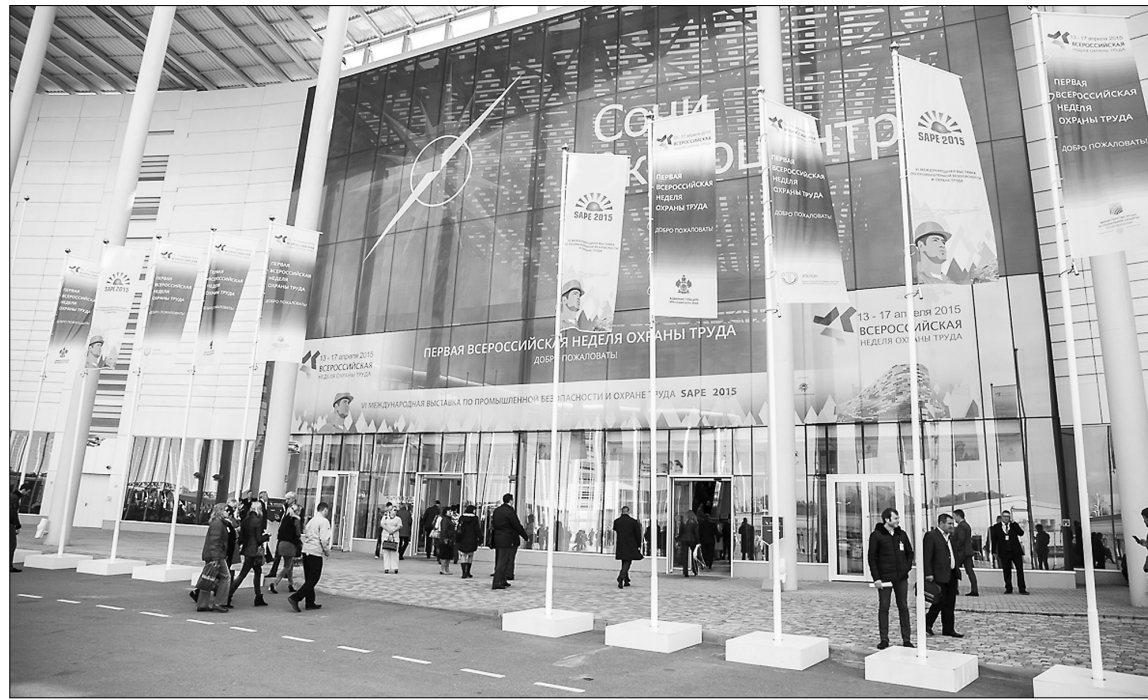
■ Главный медиацентр Сочи

Генеральный секретарь Международной ассоциации социального обеспечения Ханс Конколеwski заметил, что большую роль играет