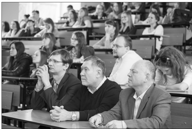
■ Информация к размышлению

Впрочем, о вредных условиях работы на предприятии гости и студенты поговорили во второй половине встречи. На вопрос о реакции организ-