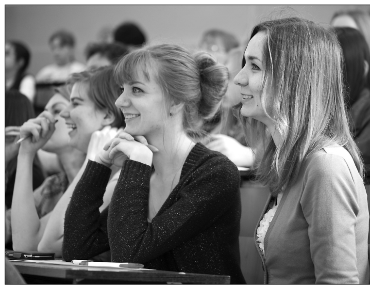
■ Быть грамотным — весело

По традиции перед диктантом демонстрировался специальный ролик, посвящённый данной акции. Главная тема шуточного репортажа в этом году звучала так: «Грамотные люди вымирают, их нужно взять под охрану ЮНЕСКО». Но, как говорится, в каждой шутке есть доля правды — уровень грамотности снижается. В конце ролика организаторы «Тотального диктанта» отметили, что это мероприятие становится своеобразным праздником и сравнимо с Новым годом. Они пожелали участникам насладиться текстом, приятной компанией и интересной игрой. Важно отметить, что организаторы попросили участников не списывать, а в случае если кто-