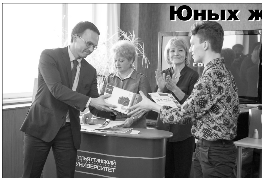
■ Награждение победителей в 2014 году