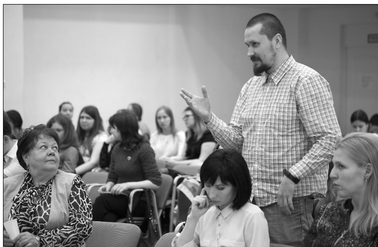
■ Дискуссия неизбежна