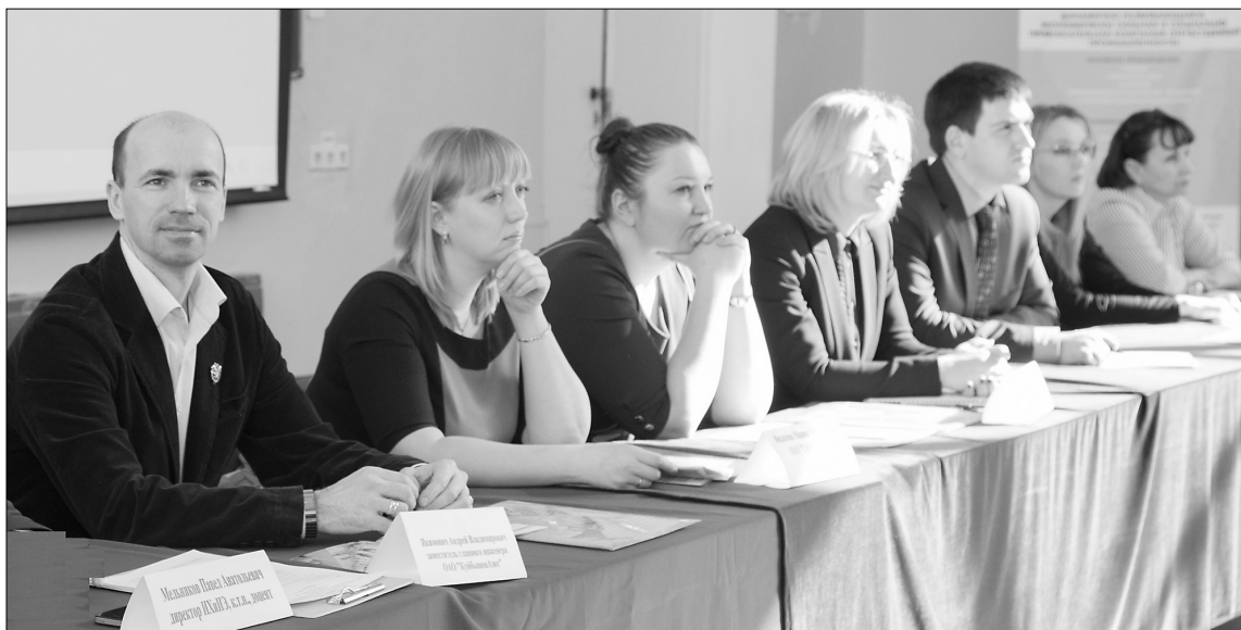
■ Абитуриентов встречали сразу работодатели