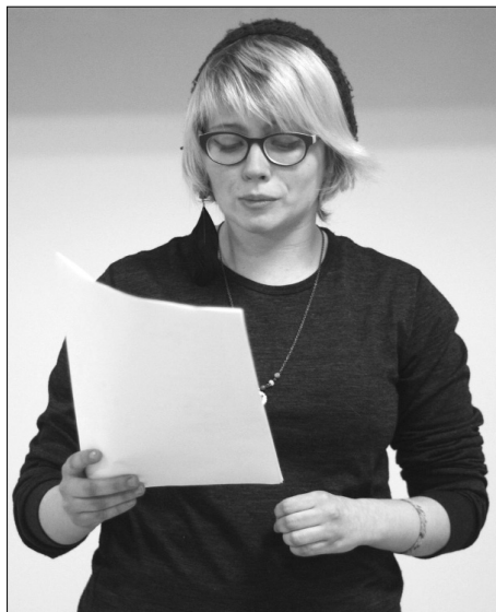
■ Сокровенное творчество

Проверить свой поэтический талант мог любой житель города в возрасте от 14 до 27 лет — достаточно было всего лишь прийти в библиотеку в день отборочного этапа и заполнить заявку. В итоге к началу состязания желающих поделиться своим творчеством набралось ровно двадцать человек — на пять больше, чем в прошлом году. Среди участников соревнования были и студенты нашего университета, причём некоторые