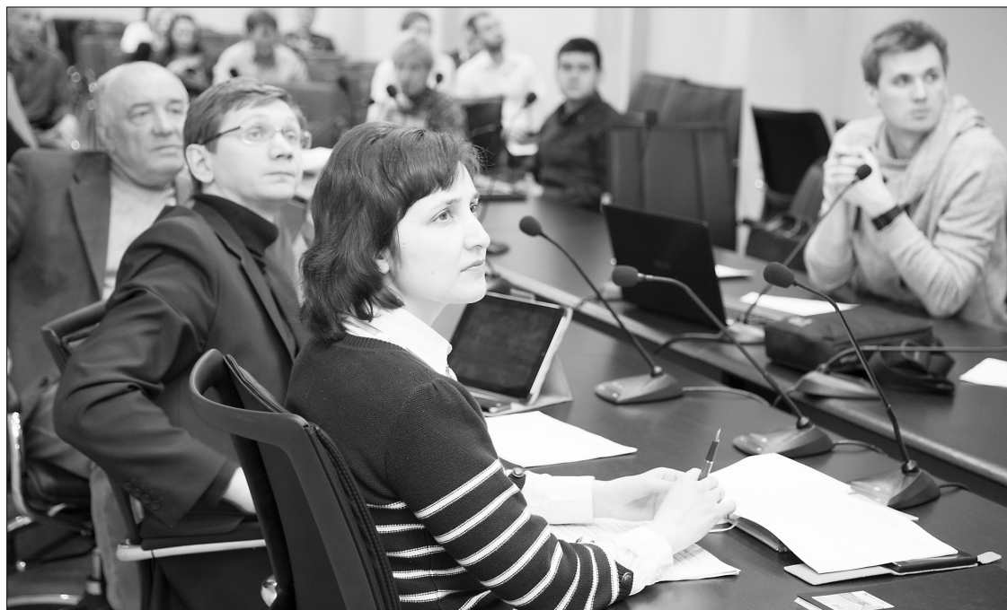
Идёт презентация проектов

В стенах Тольяттинского государственного университета 18 марта прошёл полуфинал конкурса по Программе У.М.Н.И.К.