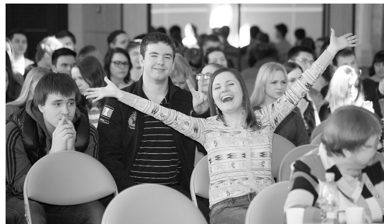
■ Зрители в восторге

— В нашем бурно меняющемся мире всё меняется постоянно, с одной стороны — это хорошо, но хочется чего-то неизменного. Эта студенческая традиция — собираться каждую весну, чтобы посмеяться над собой и не только над собой, — неизменна уже многие десятилетия. Когда я был студентом, она уже была не новой. Поэ-