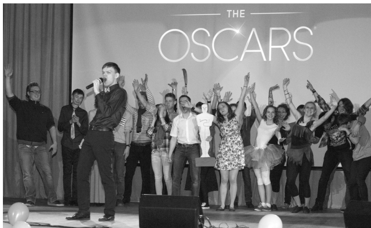
■ «Финалка» — самый забойный номер

18 марта в Институте математики, физики и информационных технологий (ИМФИТ) ТГУ прошла «Студенческая весна — 2015».