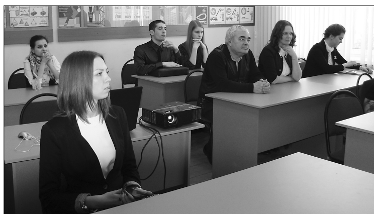
■ Заседание в ТПП

Организация, проведение и результаты секции «Экология и природопользование» продемонстрировали высокий уровень развития научно-исследовательской работы студентов в Тольяттинском государственном университете и других образовательных учреждениях Тольятти.