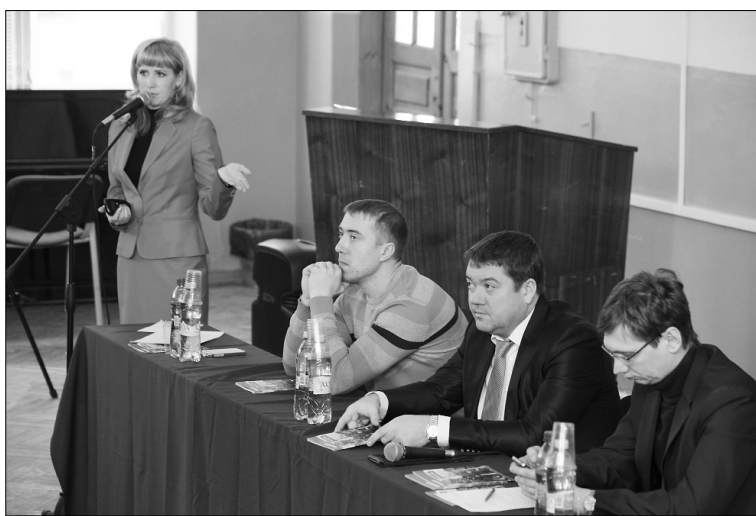
■ СИБУР открывает массу возможностей

и перспективные работни- ки имеют возможность полу- чать дополнительное обра- зование в ведущих биз- нес-школах, что способ- ствует карьерному росту. В конце 2011 года СИБУР запустил целевую про- грамму обучения студентов в магистратуре. Она пред- полагает подготовку по двум направлениям: «Тех- нология высокомолеку- лярных соединений (ВМС)» и «Химическая технология основного органического и нефтехими- ческого синтеза (ТООНС)». Учебные про- граммы этих направлений рассчитаны на двухлетний срок обучения.