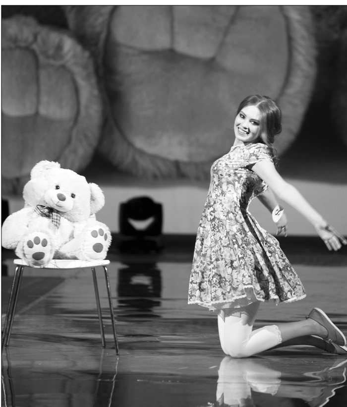
■ Творческий номер