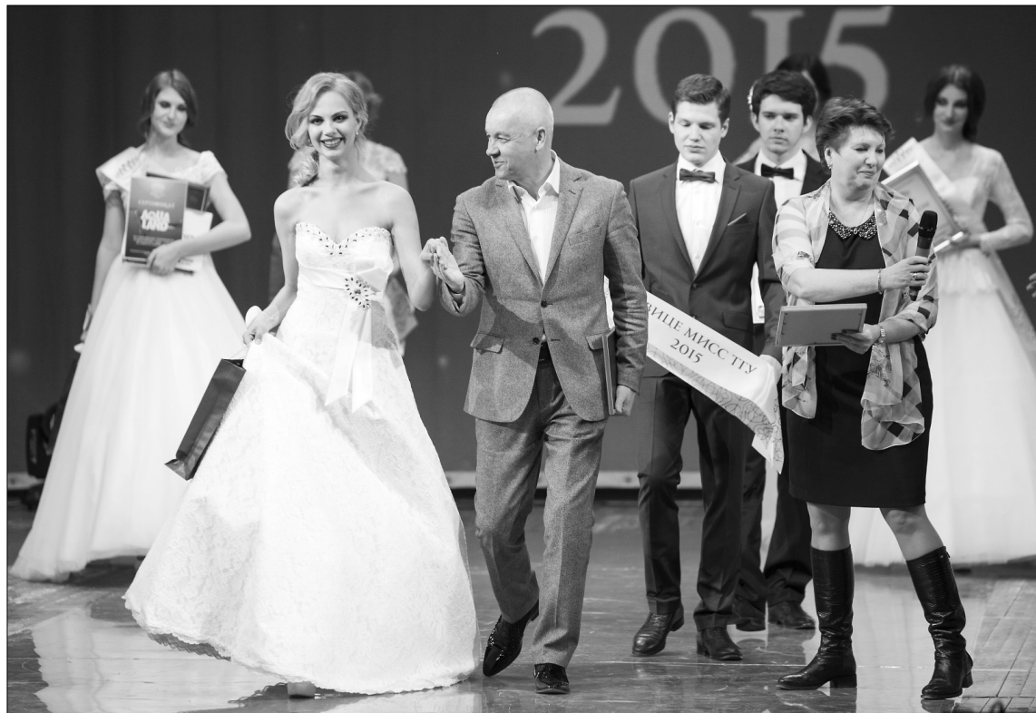
■ Церемония награждения