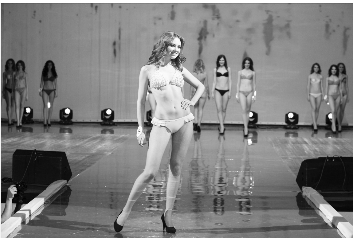
■ Выход в купальниках