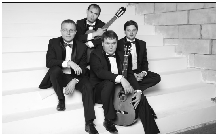
■ Квартет им. Фраучи

Музыканты совершают подлинную революцию в развитии гитарного квартета. Значительную часть репертуара составляют собственные переложения ансамбля, среди которых есть абсолютно уникальные. Единственное в мире переложение увертюры Бет-