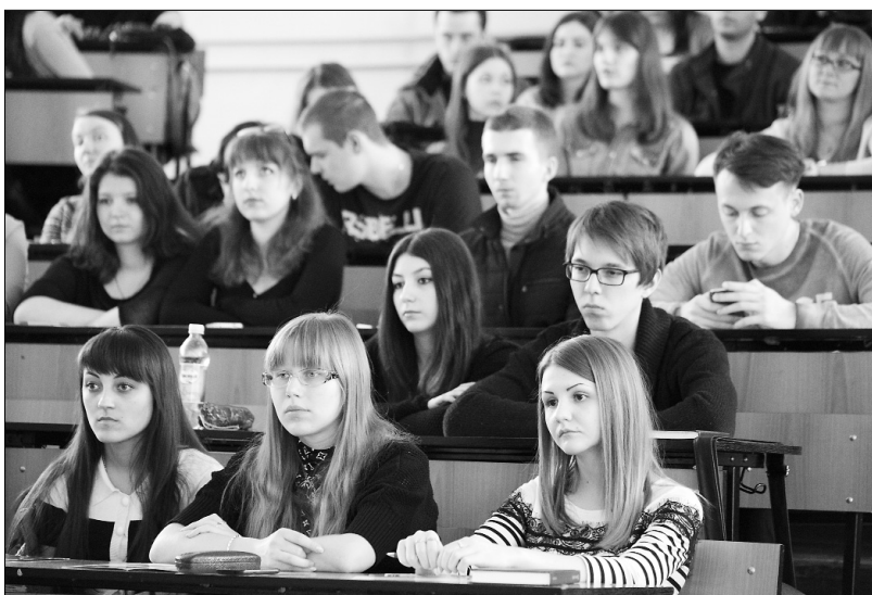
■ Студентам есть о чём поразмышлять

Пришедшие на встречу ребята интересовались усло-