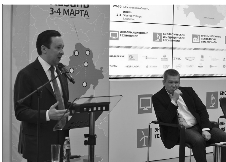
■ Каждый доклад — открытие