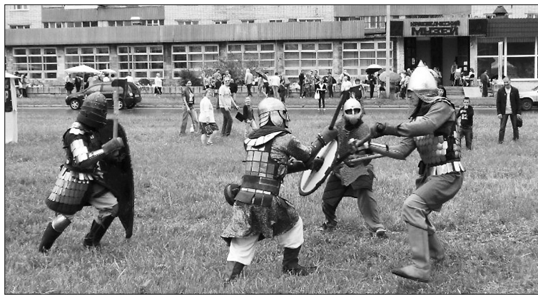
■ Музейный пикник

Историко-ролевой клуб «Княжичи» совместно с Парковым комплексом истории техники им. Сахарова проводит ежегодный «Княжеский турнир» по историческому фехтованию.