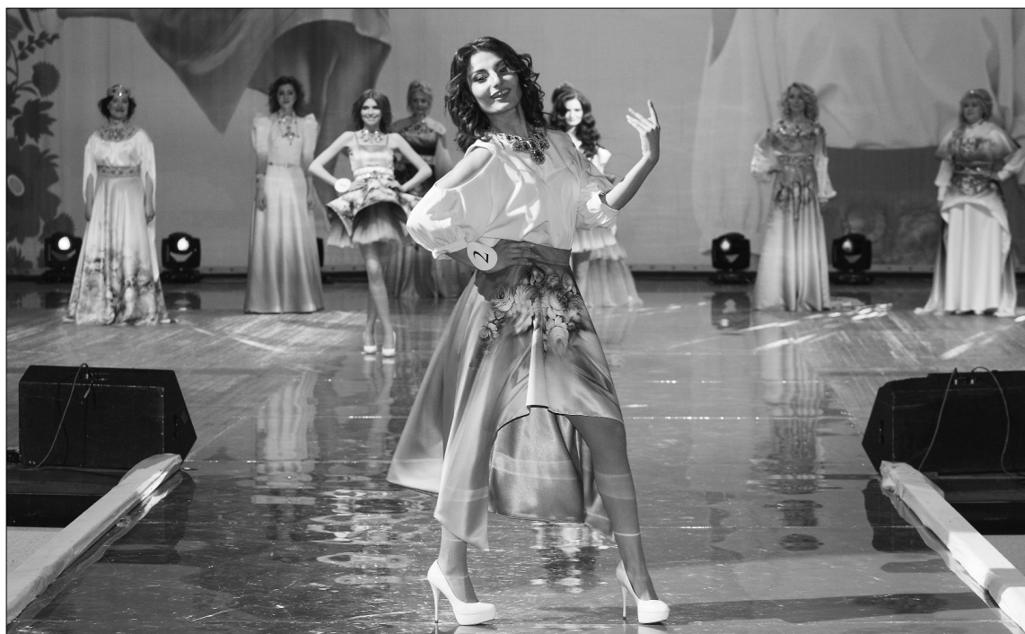
■ Дефиле в дизайнерских платьях