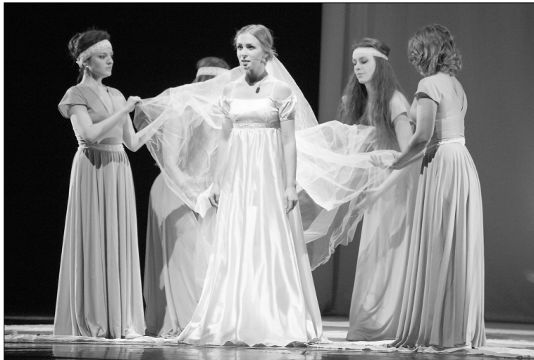
■ И торжество, и вдохновение...

В чера в драматическом театре «Колесо» им. Г. Дроздова состоялось торжественный вечер под названием «Литературный бал», посвящённый открытию «Года литературы» в нашем городе. Прекрасными чувственными мелодиями и терпкими и лёгкими движениями вальса встретили своих гостей организаторы праздника, после чего пригласили всех на торжественное открытие тольяттинского литературного празднества.