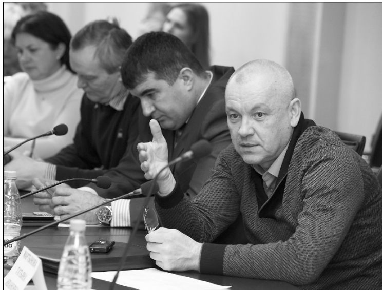
■ Дискуссия на актуальную тему

...Вот такая проблема. И очень хотелось бы, чтобы в нашем многонациональном городе сохранилось традици-