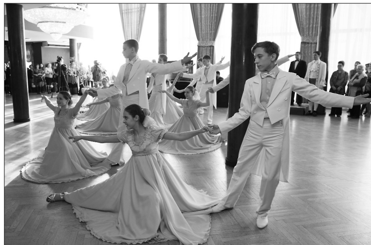
■ Грянул бал!..