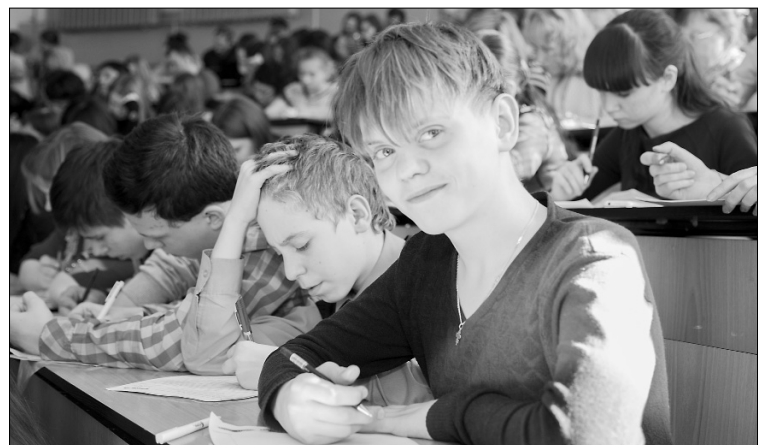
■ Диктанту все возрасты покорны

Дополнительную информацию можно получить по телефону 54-33-76 или по e-mail: kdmtlt@mail.ru.