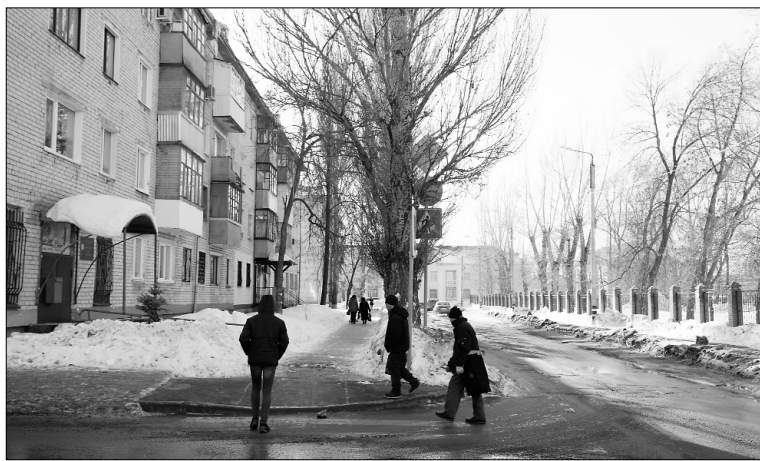
■ Неизвестный бульвар Пушкина

Названия — хранители исторической памяти, «визитная карточка» улицы, набережной, проспекта... Топонимы можно назвать зеркалом истории, это своеобразный памятник той эпохи, в которую они возникли. Современный Тольятти — город «ударной комсомольской стройки», потерявший свой исторический облик в водах Куйбышевского водохранилища, — является наиболее ярким представителем советской топонимики.