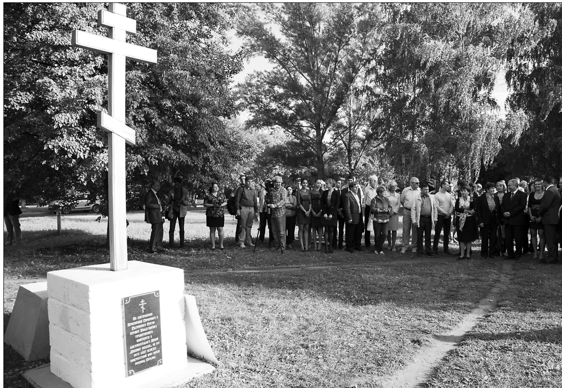
■ На этом месте будет воздвигнут университетский храм

Так, почти на 8 млн рублей были профинансированы проекты Фонда развития ТГУ. Данный проект был создан в 2010 году в рамках взаимодействия «Духовного наследия» с градообразующим университетом Тольятти в целях финансирования ряда важнейших вузовских мероприятий в области социальной и воспитательной работы,