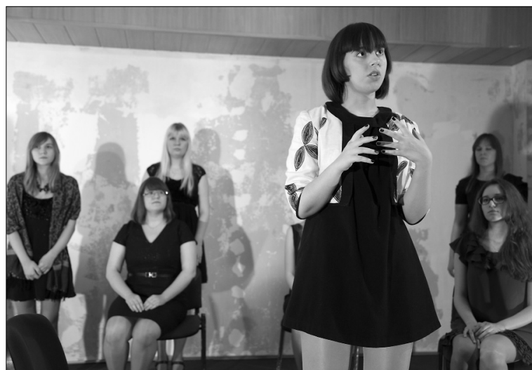
■ Поэзия как откровение души