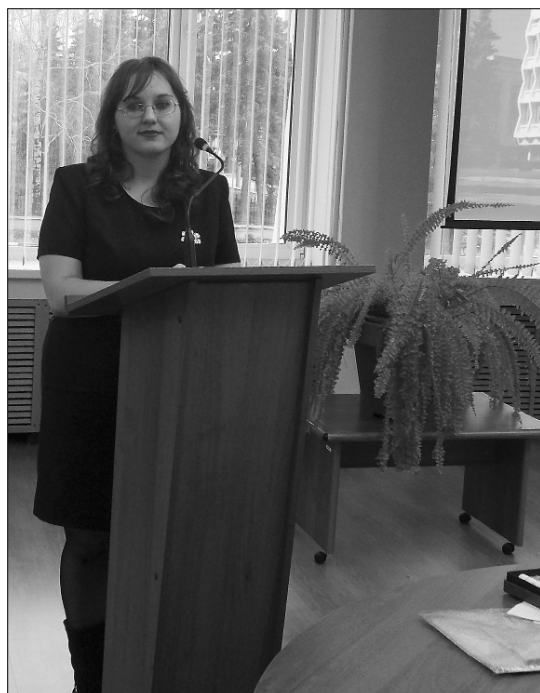
■ Наука — это увлекательно