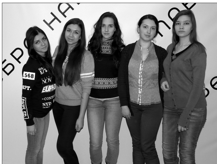
■ На других посмотреть и себя показать

Доклаживались и обсуждались актуальные вопросы образовательной роботехники, прие-