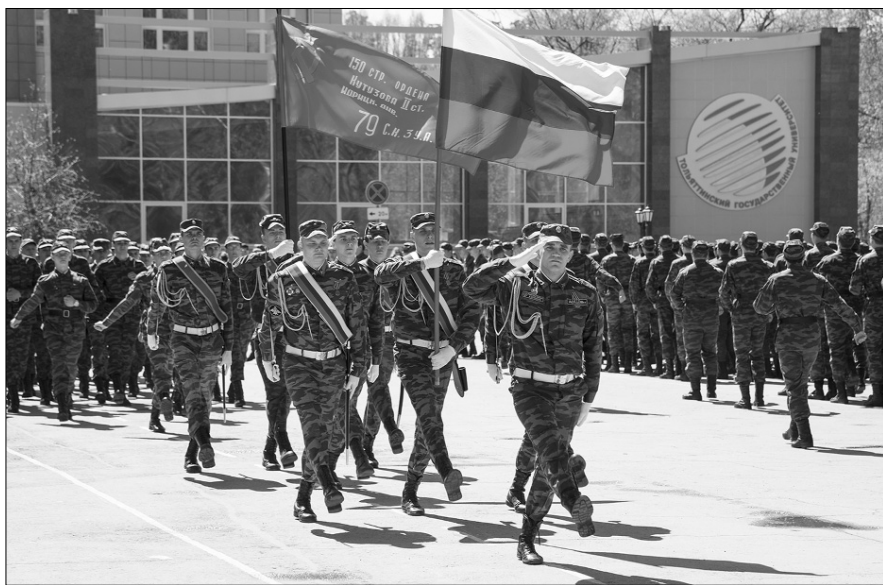
■ Парад в честь Дня Победы