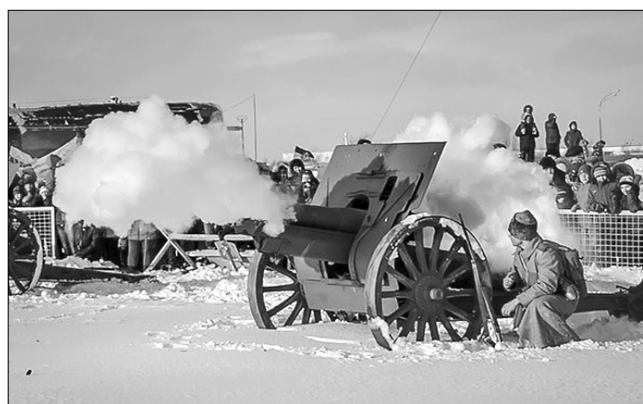
■ Выстрел 122-мм гаубицы

Об организаторах. Событие подготовили сотрудники Паркового комплекса истории техники им. К.Г. Сахарова. Теперь это муниципальное автономное учреждение культуры. Разумеется, главными участниками стали ребята из клуба военно-исторической реконструкции «Волжские стрелки». Хотелось бы ещё отметить ребят из Общественного молодёжного движения «Казачий дозор — Поволжье». Они принимали участие во всех конкурсах и викторинах, показали искусство владения нагай-