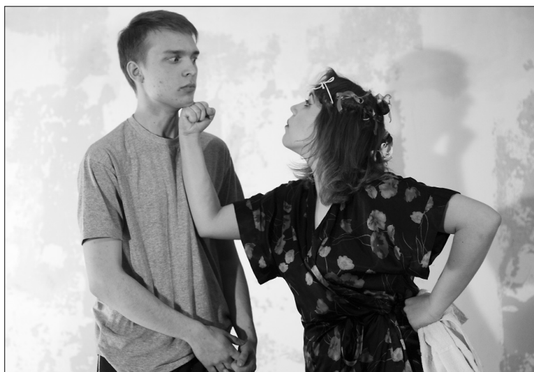
■ Персонажи Зощенко разошлись не на шутку!