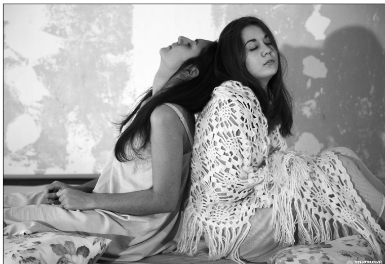
■ Неимоверное страдание...