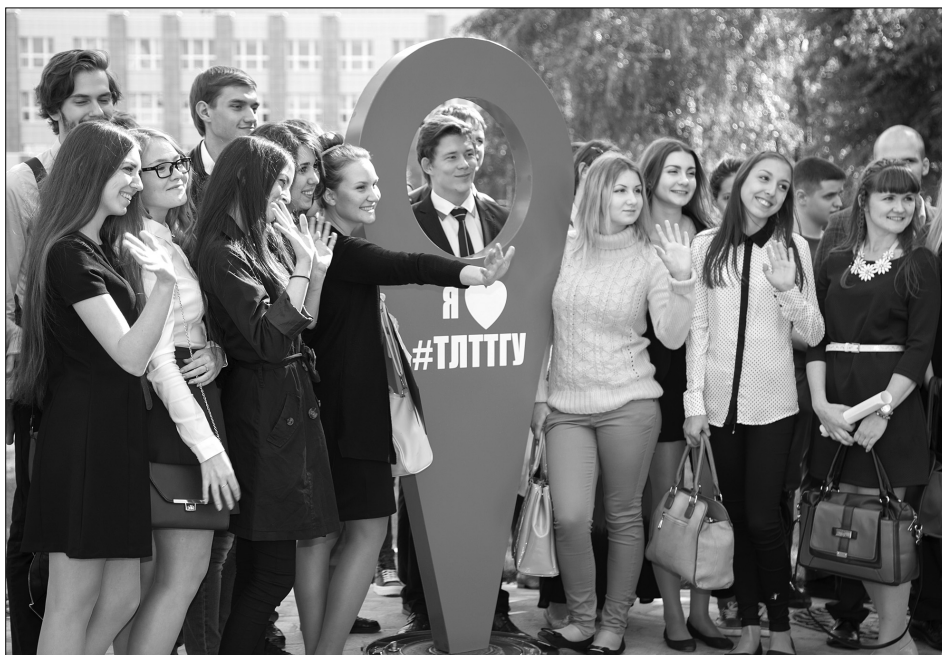
■ Геометка ТГУ — место, где все фотографируются

День знаний — волнующее событие не только для первокурсников, но и для первокурсников. 1 сентября 2015 года Тольяттинский государственный университет вновь открыл свои двери в мир знаний для новопришедших студентов.