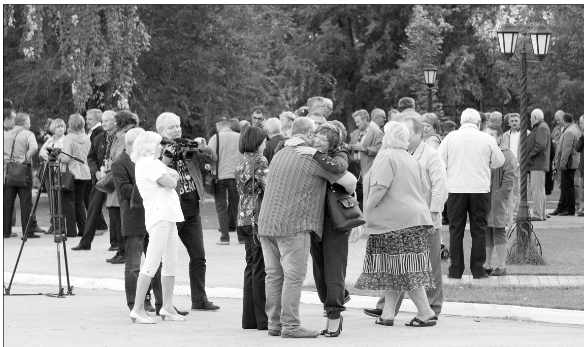
■ Эти незабываемые встречи...