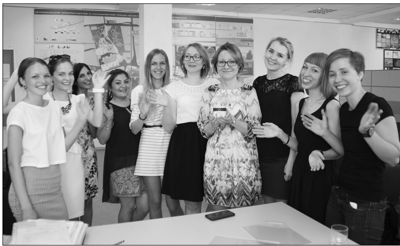
■ Дизайнеры ТГУ после защиты

И стинным украшением Тольятти и других поволжских городов могут стать дизайнерские проекты выпускников ТГУ. Заметим, что речь идёт именно о реализации этих проектов. Разработка оригинальных концепций и их профессиональное воплощение в дизайн-проектах, убедительные презентации — всё это отличный результат защиты бакалаврских работ студентов кафедры дизайна и инженерной графики Архитектурно-строительного института.