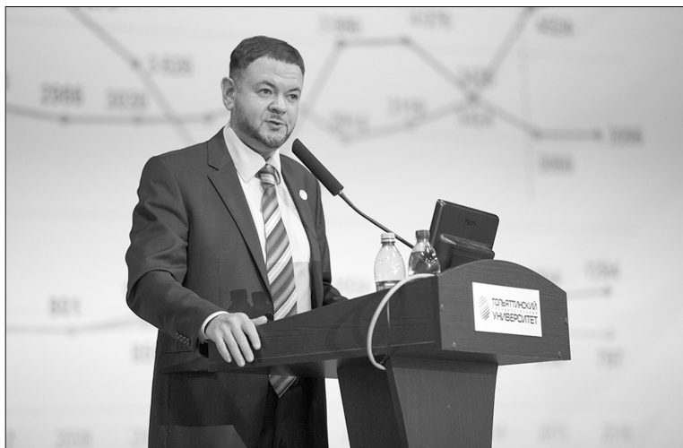
■ Развиваться, а не выживать

собственного финансирования и 292 миллиона рублей в целом.