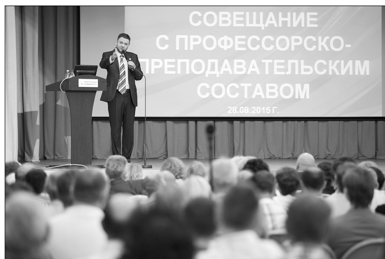
■ Время итогов и планов