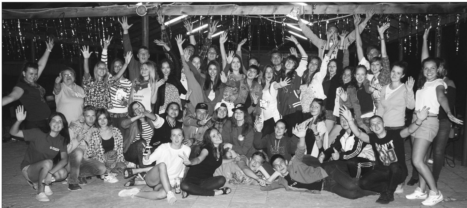
■ Лето — это маленькая жизнь вместе

Ежегодно всех самых активных и талантливых студентов поощряют интересным «отпуском». В этом году самую лучшую летнюю неделю 45 ребят провели на территории турбазы «Ветерок».