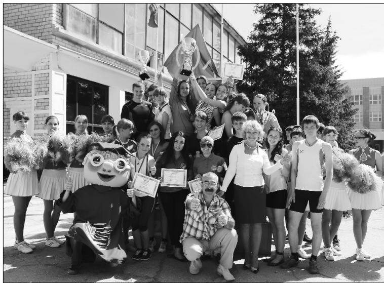
■ Герои спорта

Тольяттинский государственный университет 29 мая отметил день рождения и чествовал лучших спортсменов на торжественном приёме ректора.