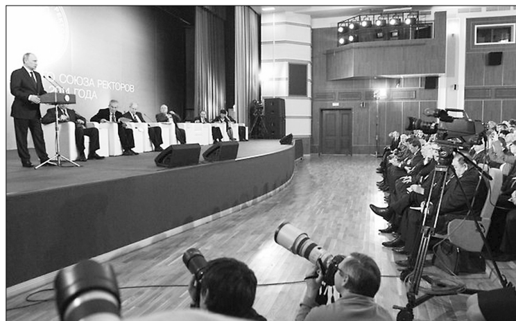
■ Выступление президента Владимира Путина перед ректорами России