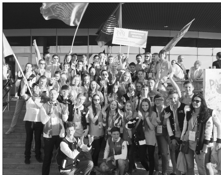
■ Волонтёры — это сила!

Уже несколько месяцев в головах студентов только она... Нет-нет, это не учёба и не сессия. Это — «Российская студенческая весна»! Двадцать два года она колесила по стране, чтобы в 2014-м вернуться на свою историческую родину в Самарскую область, в Тольятти.