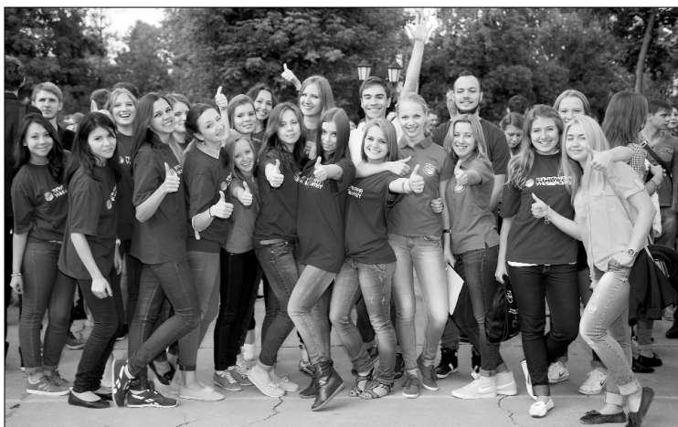
■ Студент — звучит гордо!