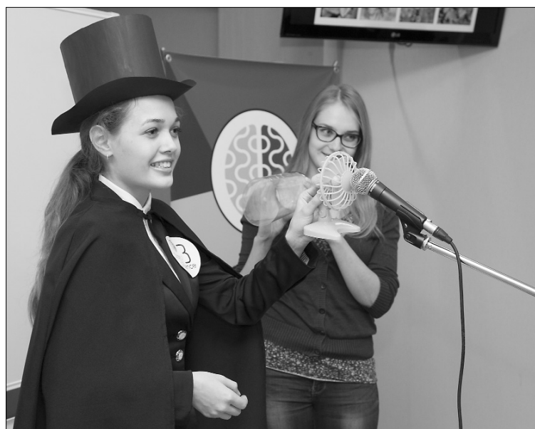
■ О сложном — просто...

30 октября в Деловом центре НИЧ Тольяттинского государственного университета состоялся «научные бои» Stand-Up Science. В оригинальном интеллектуальном проекте приняли участие молодые учёные — студенты различных институтов ТГУ. Стоит сказать, что, наверное, ещё никогда сложные научные идеи не объяснялись столь наглядно и красочно!