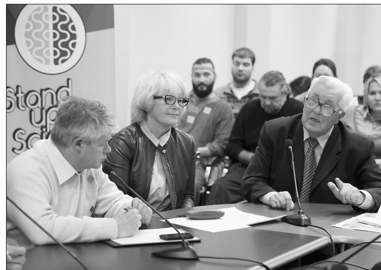
■ В спорах рождается истина

С 30 октября по 4 ноября в Тольятти прошла IV спартакиада боевых искусств (СБИ) «Непобедимая держава» — крупнейшее спортивное событие Самарской области. В этом году в спартакиаде приняло участие порядка шести тысяч спортсменов в более чем 30 видах спорта.