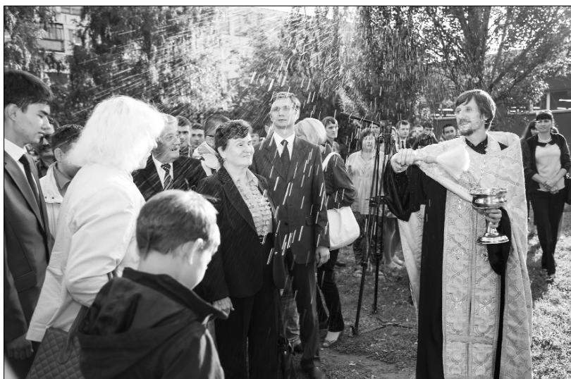
■ Всех окропили святой водой

Тольяттинский храм святой мученицы Татианы несёт