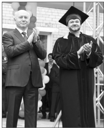
■ С Днём знаний!

Для Тольяттинского государственного университета 2014 год стал годом выбора дальнейшего пути развития во всех смыслах.