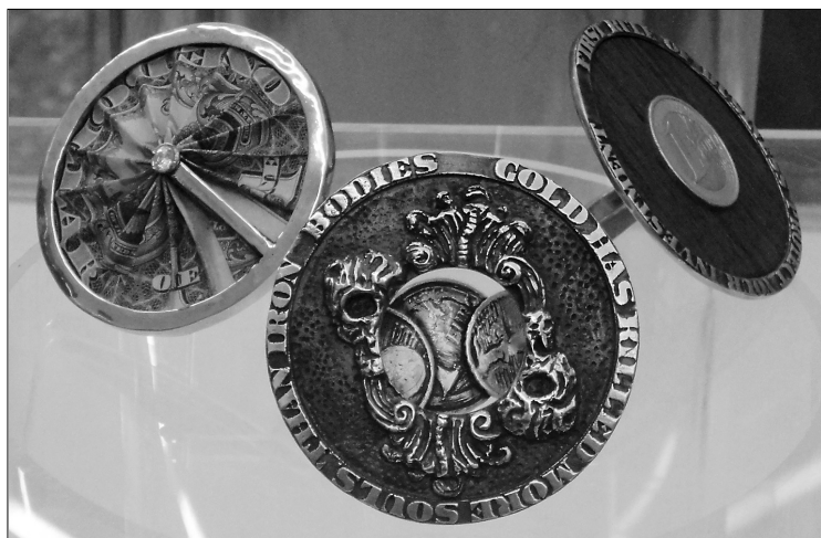
■ Серия колец. Автор — Данил Ермоленко