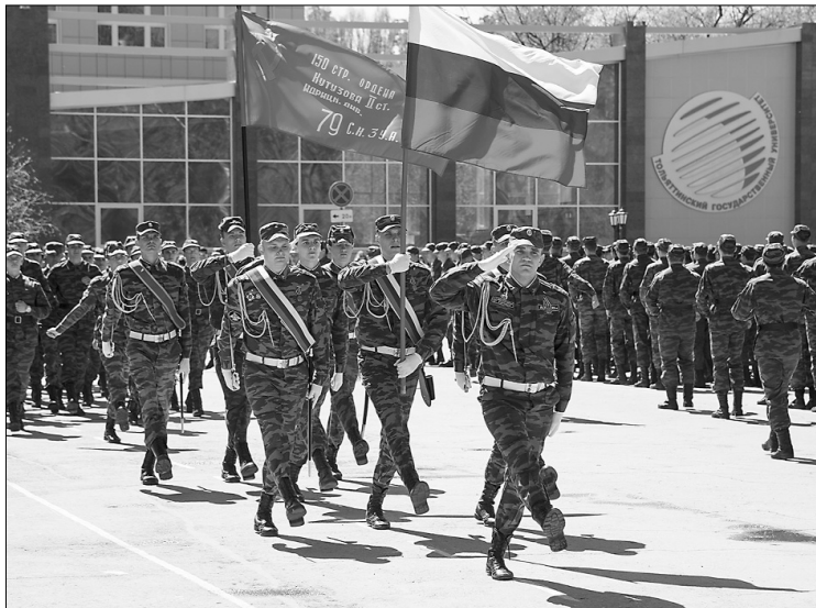
■ Ритмичный марш

На площади перед главным корпусом Тольяттинского государственного университета 8 мая в полдень студенты вместе с преподавателями и ветеранами собрались на традиционное торжественное мероприятие «Весна 45-го года», посвящённое 69-й годовщине Победы в Великой Отечественной войне.