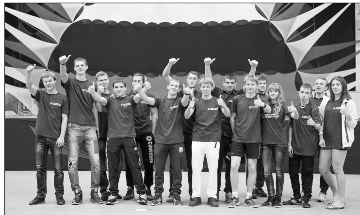
■ Команда победителей

ТГУ уверенно лидирует в городской универсиаде высших учебных заведений.