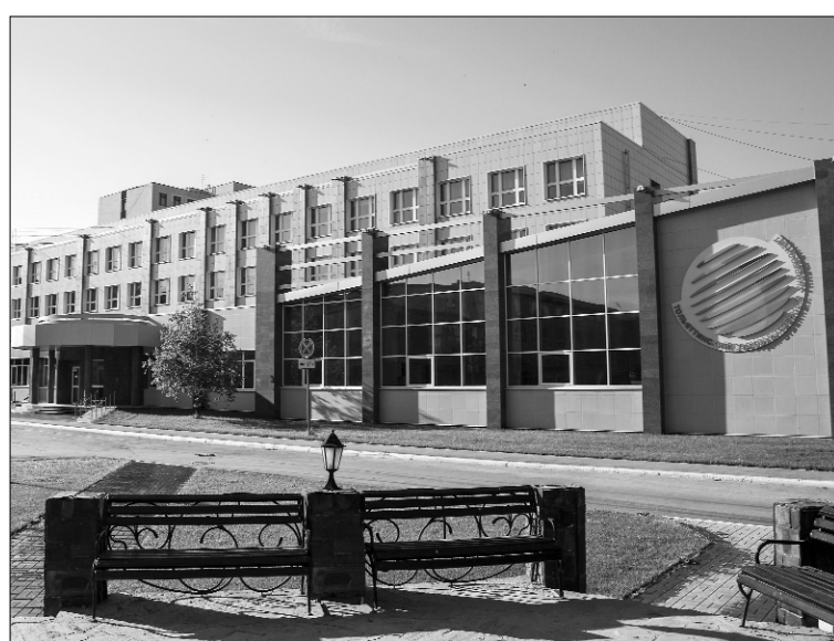
■ Имидж университета — во всём!

— «Эффективность вуза» — понятие значительно более широкое, чем просто