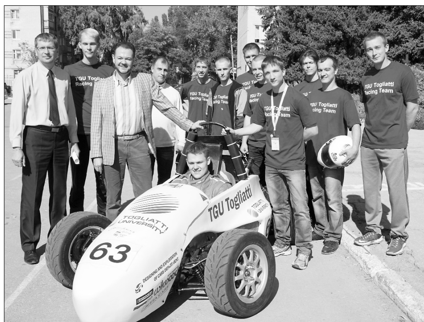
■ Настоящая команда победителей

Н аш город, как вы знаете, славится «чудесами» автомобильной техники, однако эта машина не просто вышла в свет, но ещё и вывела наш университет на мировую студенческую арену, название которой — Formula Student.