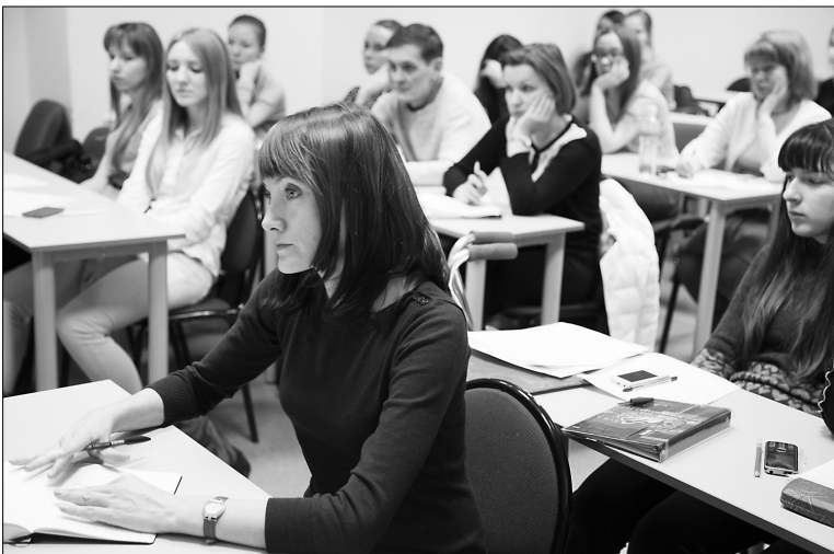
■ Информация к размышлению

М астер-класс профессора МГУ, известного в стране филолога Елены Кара-Мурзы провела 5 декабря кафедре русского языка и литературы ТГУ. Всем, кто побывал на этой встрече, было о чём поразмышлять.