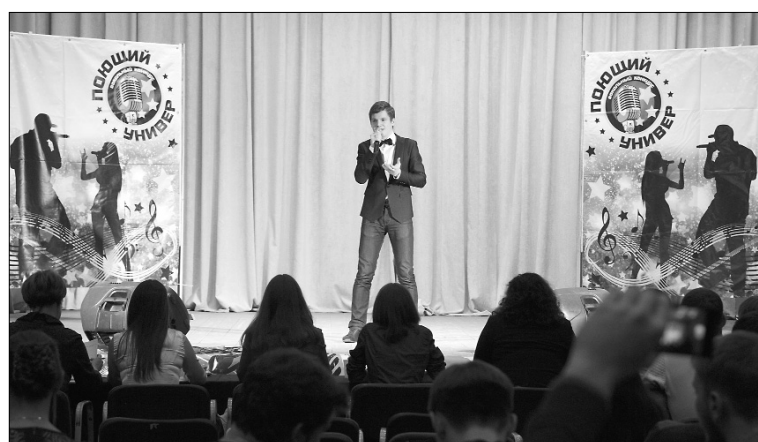
■ На отборочном туре

Также на конкурсе звучали романсы на стихи Бунина и рэп, песни из советских мультфильмов и из репертуара Мадонны, известные арии из мюзиклов и неожиданные песни на японском языке. Широту репертуара оценило даже строгое жюри, в числе которых профессиональные исполнители, руководители вокальных коллек-