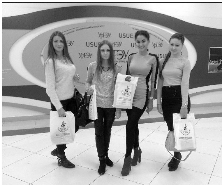
■ Фото на память в Екатеринбурге

Помимо мероприятий в университете, у нас была возможность поближе познакомиться с административным центром Свердловской области, увидеть своими глазами множество достопримечательностей Екатеринбурга. Всем известно, что Урал — родина тысячи месторождений железа, меди, драгоцен-