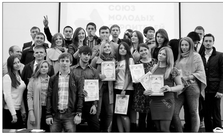
■ Участники форума «СтройМолодёжь-2020»

Л етом 2015 года в Тольяттинском государственном университете (ТГУ) планируется проведение всероссийского и, возможно, международного форума молодых строителей.