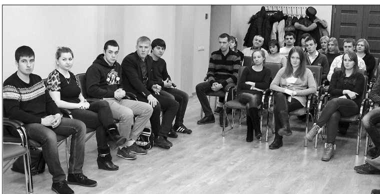
■ Студенты — будущие предприниматели