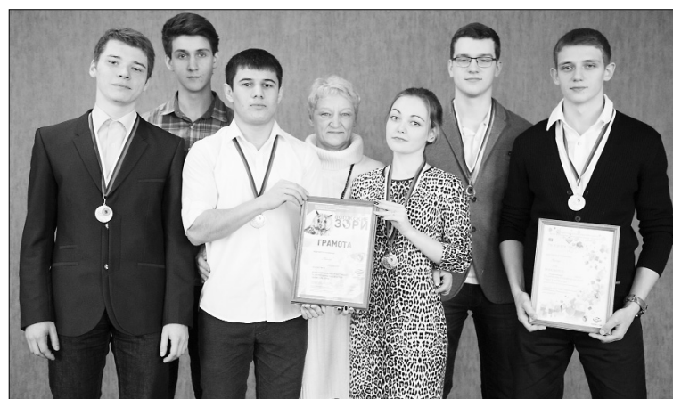
■ «Фемида» — команда победителей