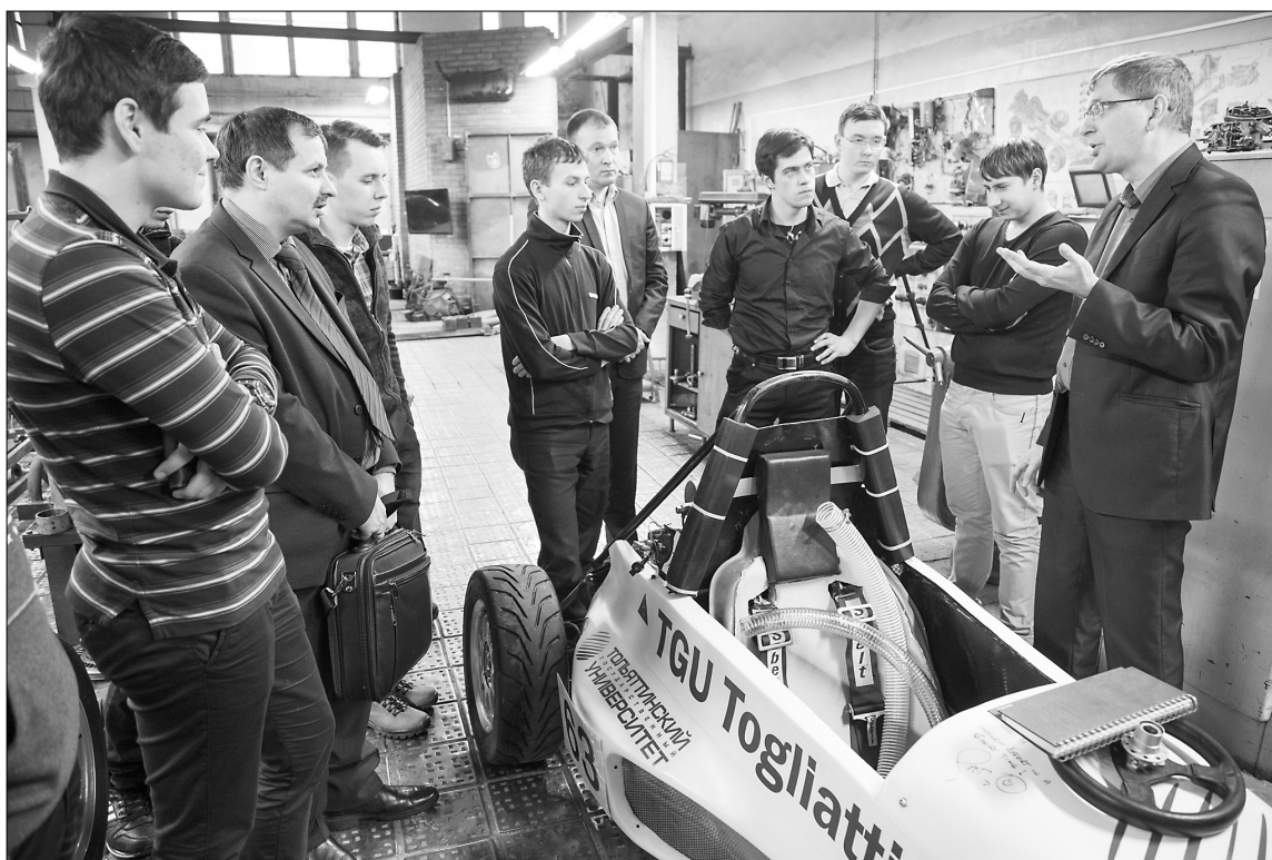
■ Собранный своими руками болид — для чемпионов пока лишь мечта

В понедельник, 15 декабря, наш университет посетила команда Formula Student Набережночелнинского государственного института Казанского Федерального университета в составе 20 человек, для того чтобы перенять теоретический и практический опыт наших «формульцев».