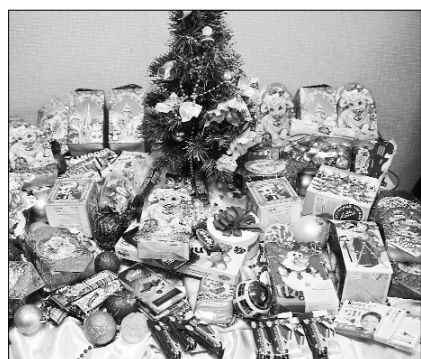
■ Подарки детям

Не забывайте, что Новый год — праздник волшебства и исполнения желаний, в который верят и ребята из социального приюта для детей и подростков «Дельфин». Подарим им эту сказку вместе!