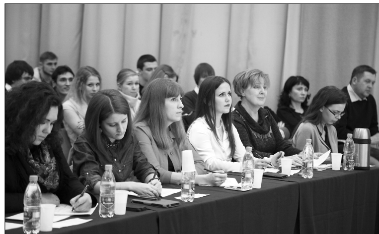
■ Жюри слушало и слышало

Всего было подано более 80 заявок. Среди номинаций самая популярная — эстрадный вокал. Новшеством стало введение обязательной темы одного из двух вокальных произведений, которые готовят конкурсанты, и в этом году была выбрана «Патриотическая». Как ока-