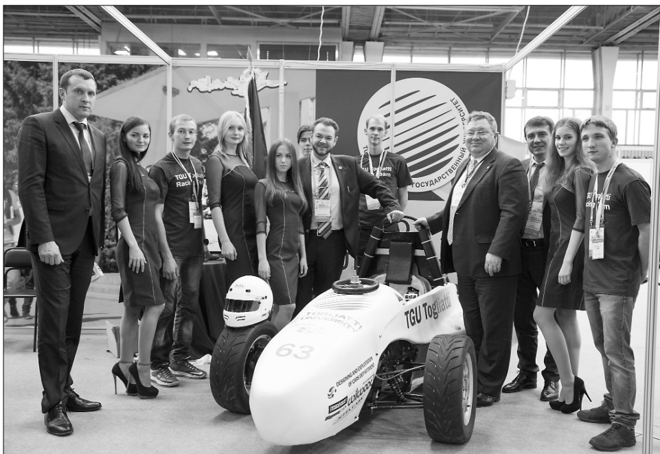
■ Заслуженное внимание высоких гостей

Тольяттинский государственный университет принял активное участие в работе восьмого международного форума «АВТОПРОМ. АВТОКОМПОНЕНТЫ — 2014» — единственного специализированного форума в Самарском регионе, в котором участвуют автомобильные компании, поставщики, инженеринговые фирмы, представители отраслевых организаций и кластеров.