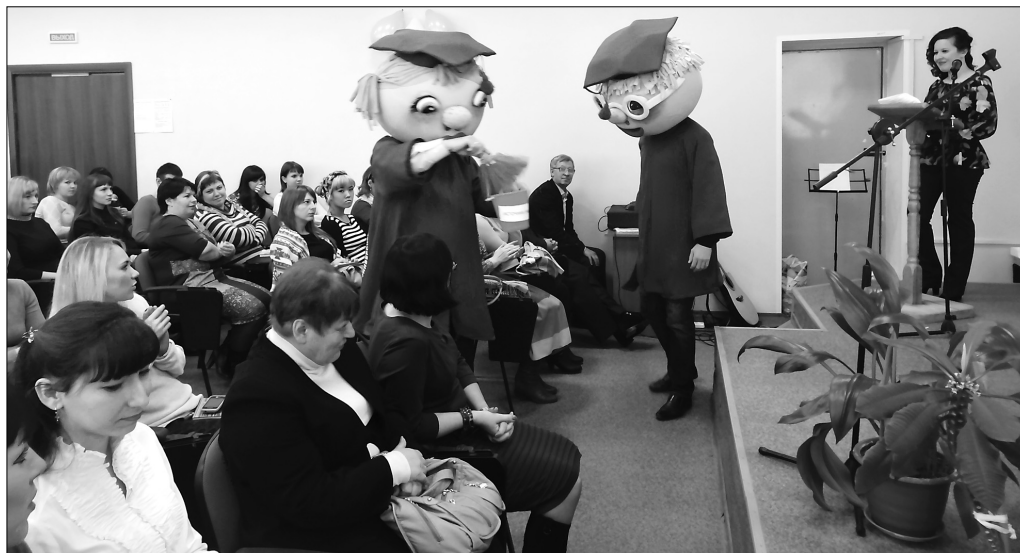
■ Универ и Универочка «окропили» посвящённых

...Эти слова из песни, которая прозвучала 17 ноября в исполнении 216 счастливиц, посвящённых в студенты ТГУ. Дата посвящения была выбрана особая — 17 ноября в мире отмечается Международный день студентов. В Лондоне и Париже, в Москве и Тольятти звучал в этот день «Гаудеамус». В сызранском представительстве ТГУ он прозвучал тоже.