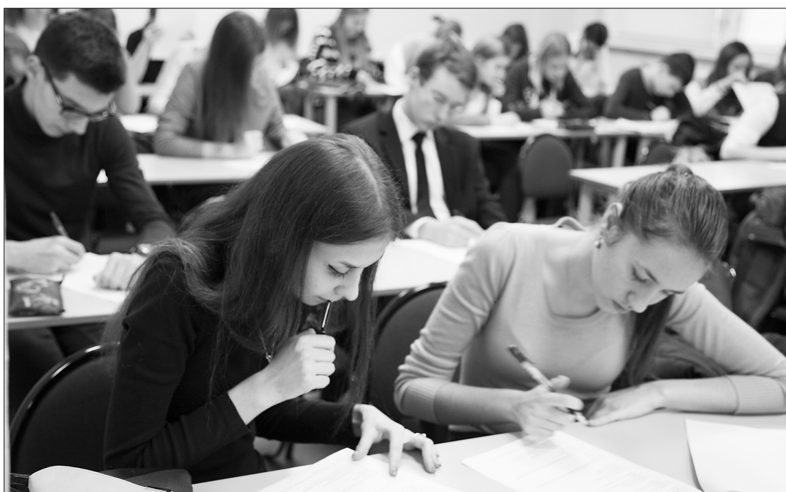
■ «Каждый пишет как он дышит...»

П родолжить данную фразу предложили школьникам, пришедшим 28 ноября в ТГУ на олимпиаду по журналистике.