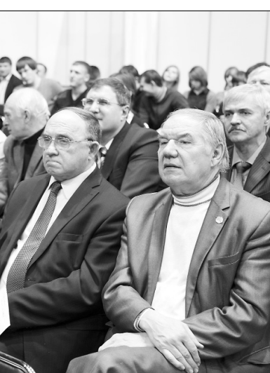
■ Обсуждая будущее