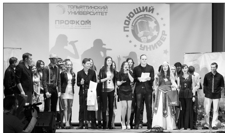
■ Финальная песня 2013 года

риотического направления. Заявку на участие можно подать не более чем в двух номинациях. Заполненная заявка предоставляется до 17 часов 8 декабря в электронном виде на e-mail: kvs1019@yandex.ru