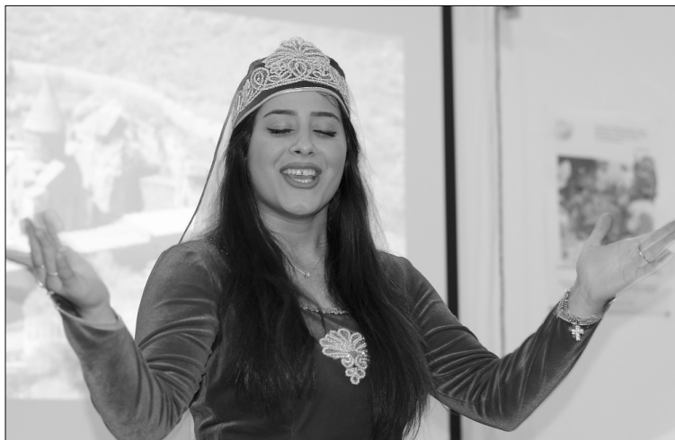
■ Экспрессивная песня