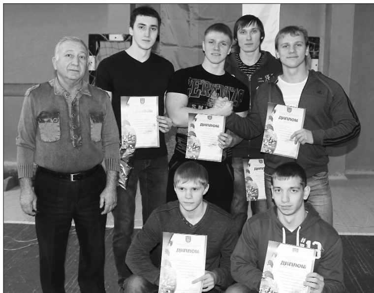
■ Наши победители

Традиционный открытый турнир г.о. Тольятти по классическому жиму штанги лёжа памяти Павла Хрущёва прошёл 30 ноября в спортивном зале МБУ №47. Эти соревнования собирают любителей силового экстрима не только из Тольятти, на них приезжают гости из ближайших городов области.