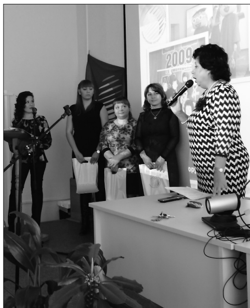
■ Поздравление в адрес первокурсников

Начал свою деятельность в Тольяттинском государственном университете с марта 2013 года.