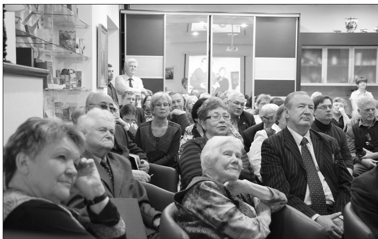
■ В гостиной Дома учёных нет свободных мест