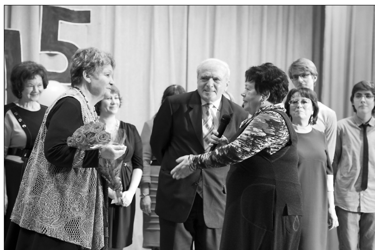
■ Основатели кафедры на сцене

что её выпускники трудятся по всей стране. Они востребованы везде, в том числе и в Москве, в ведущих СМИ нашей страны. То есть они профессиональны и успешны. Вот это очень важно.