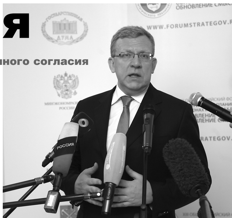
■ Алексей Кудрин, экс-министр финансов

На форуме были представлены российские и мировые консалтинговые агентства, первые руководители городов и регионов. Как отметил Алексей Комягин, «в процессе обсуждения закона «О стратегическом планировании в РФ» выяснилось, что