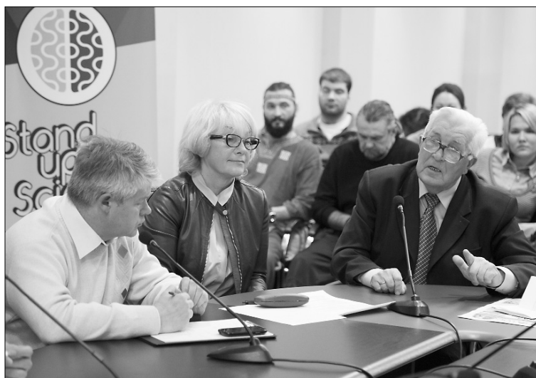
■ В спорах рождается истина