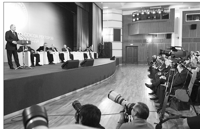
■ Выступление президента Владимира Путина перед ректорами России

санкций, вопросы подготовки кадров, поддержки сис-