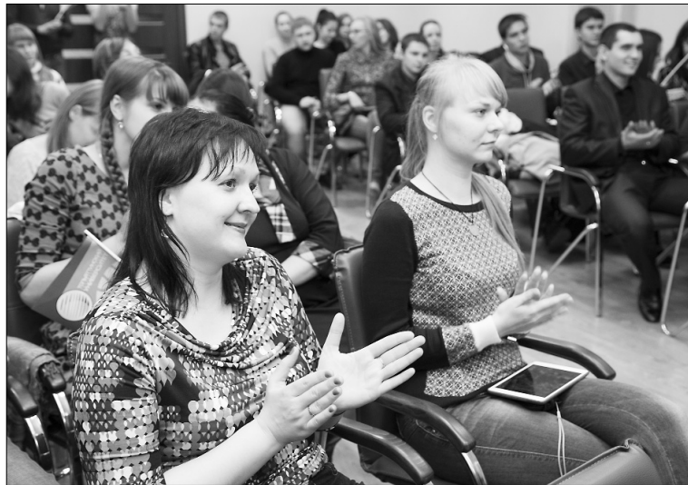
■ ...научный бой — это увлекательно

кой наглядной и простой наука не была, пожалуй, никогда! Всеми «виной» одно из жёстких правил конкурса: участникам необходимо не только провести лекцию высокого уровня сложности за пять минут, но и рассказать о своём изобретении, используя обычные предметы или креативную презентацию. Ведущий сражения даже предложил участникам спеть или станцевать, лишь бы это помогло им в объяснении