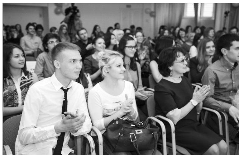
■ В зале была очень дружелюбная атмосфера

Многие из выпускников продолжили образование в российских и зарубежных вузах.