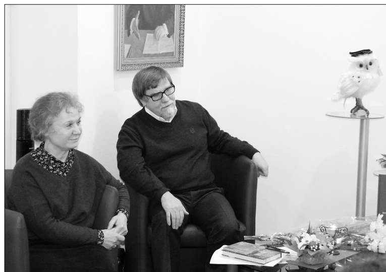
■ Виновники торжества