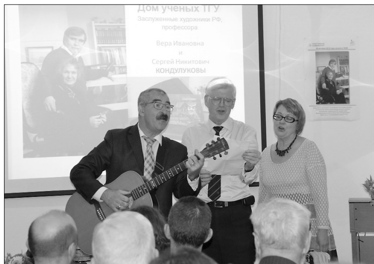
■ Стихами и песнями — о вечном