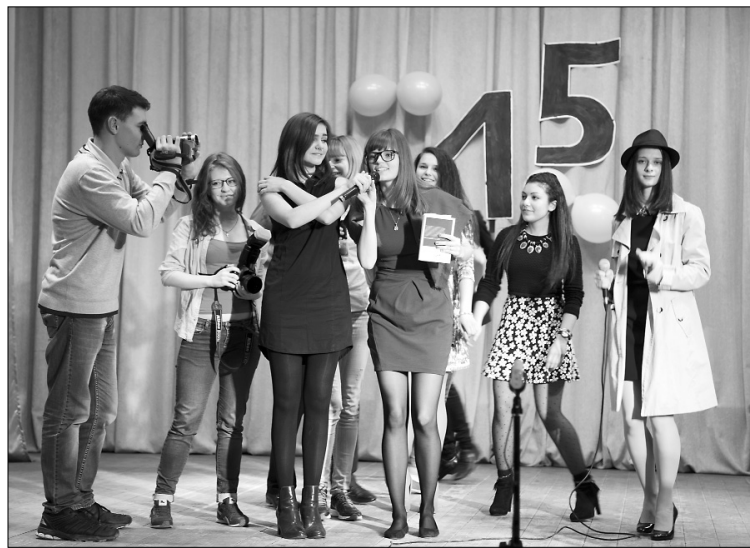
■ Посвящение в первокурсники