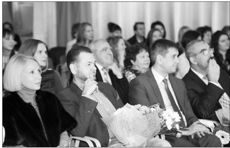
■ Почётные гости