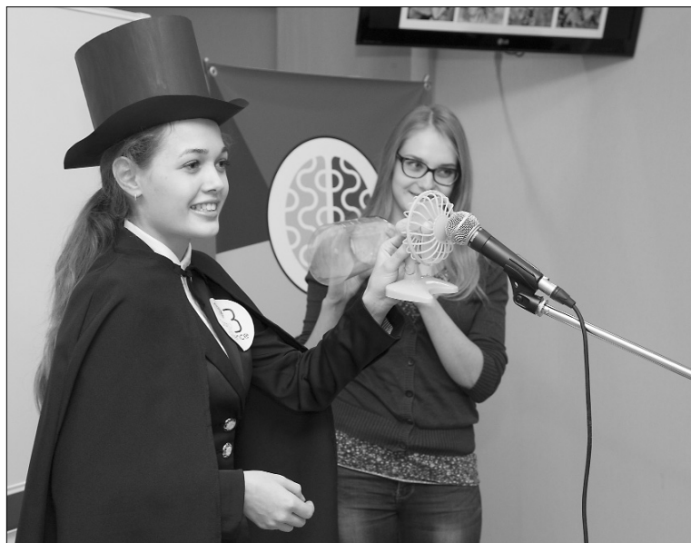
■ О сложном — просто...