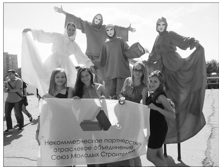
■ Студенты-строители ТГУ в гуще событий

дой из архитекторов, дизайнеров и художников смог выиграть конкурс по разработке проекта сквера имени С.Ф. Жилкина , грант в размере 150 тыс. рублей, а также контракт на изготовление рабочего проекта и авторский надзор: «Работа была трудная, учитывая то, что члены нашей команды находятся в разных городах Самарской области. Тем не менее мы смогли справиться и достигнуть высоких результатов. Наша победа — это прежде всего победа команды. Также эта победа открывает нам большие профессиональные возможности».