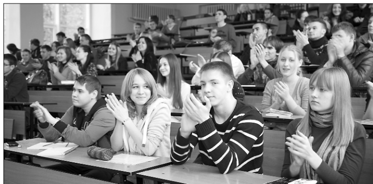
■ Лекции от практиков всегда интересны

Контакты: г. Тольятти, ул. Белорусская, 14, кафедра управления промышленной и экологической безопасностью, корпус «Д», ауд. Д-408. Телефон 53-92-36.