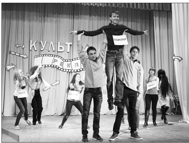
■ Готовы прыгать выше головы

А вот социологи решили спасти людей, предотвратив... конец света. Бабка-колдунья, сумасшедший профессор и