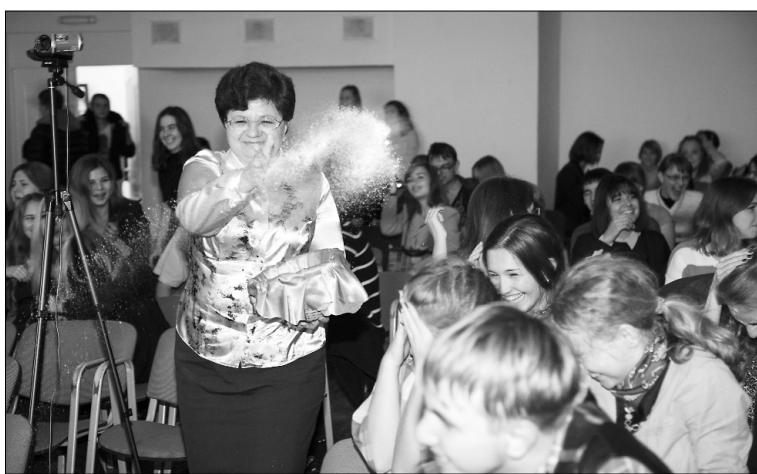
■ «Священной» соли хватило на всех

В ТГУ 8 октября состоялось традиционное посвящение первокурсников в гуманитарии и педагоги. Заведующие и преподаватели всех кафедр ГумПИ принимали «парад студентов» и не только остались довольны зрелищем, но и буквально влюбились в своих новобранцев, которые рассказывали со сцены о важности своих профессий для человечества.