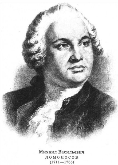
Михаил Васильевич ЛОМОНОСОВ (1711—1765)

ТГУ вновь распахнул двери для самых умных школьников нашего города. На этот раз поводом для этого послужило по-настоящему масштабное событие — всероссийский Турнир имени М. Ломоносова, проводившийся вот уже в 37-й раз.