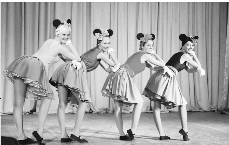
■ «Мультяшные» герои на сцене ну очень милы...

В ТГУ прошла плеяда посвящений первокурсников, и десятого октября эстафета перешла к Институту энергетике и электротехники (ИЭиЭ). Ребята-первокурсники с особым озорством и энтузиазмом подошли к делу, представив свою будущую профессию в наилучшем свете. И кажется, им вполне удалось доказать, что без мастера-электрика или инженера-энергетика дальнейшая жизнь мало кого обрадует своим дискомфортом.