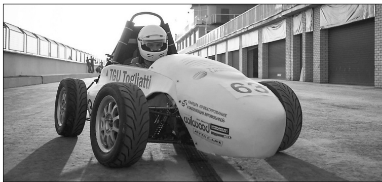
■ Болид ТГУ на трассе в Москве

Команда Formula Student TGU приступила к работе в новом сезоне. Ребята, что совсем недавно вернулись из Москвы с международного этапа соревнований Formula Student, сегодня уже готовятся к следующим испытаниям, и для этого им нужна наша помощь.