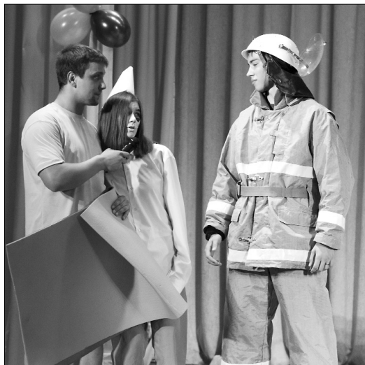
■ Пожарный наставляет...

Группа ТБб-1401 победила в номинации «Лучшая сказка», ребята доказали, что пожарная безопасность важна даже для сказочных персонажей, именно поэтому они выбрали свою профессию.