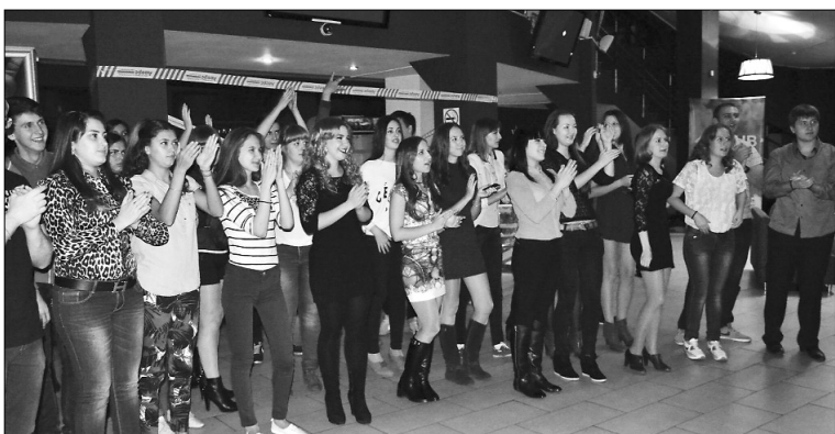
■ Юристы могут всё!

Этот вечер можно смело добавить в студенческую копилку самых значимых моментов и интересных воспо-