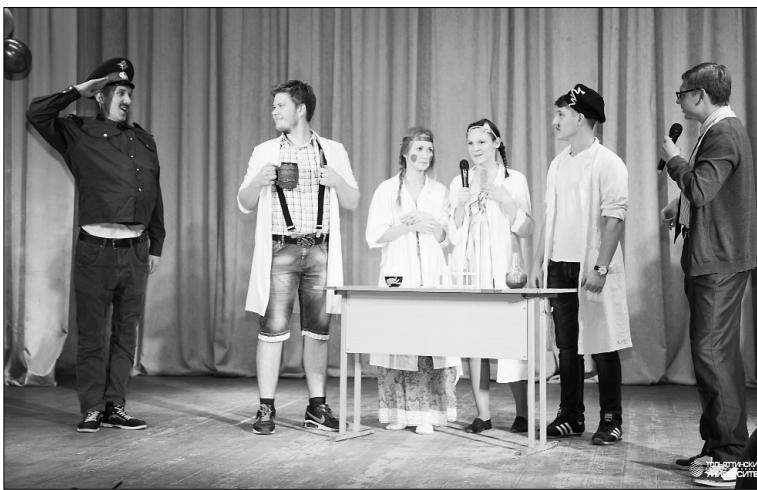
■ Импровизация на сцене

И мпровизированная церемония вручения премии «Золотой болт», в которой, по словам ведущих, отказался принимать участие даже Леонардо ДиКаприо, прошла 9 октября в актовом зале корпуса ТГУ на улице Фрунзе, 2г.