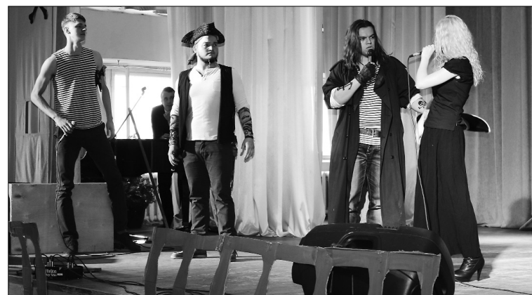
■ Творческий номер старшекурсников

Первокурсники показали свои таланты: многие пре-