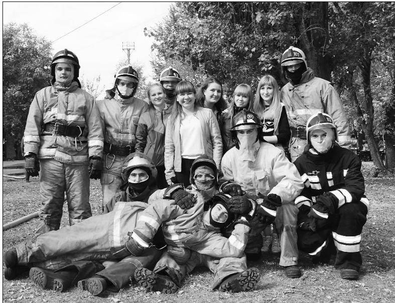
■ В полном боевом облачении

участие в учениях. И не просто «болеют» за любимые пожарные части, но и каждый желающий может надеть боевую одежду пожарного, что-