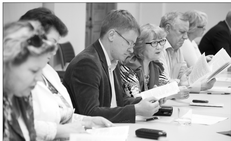
■ Анализ — путь к верному решению