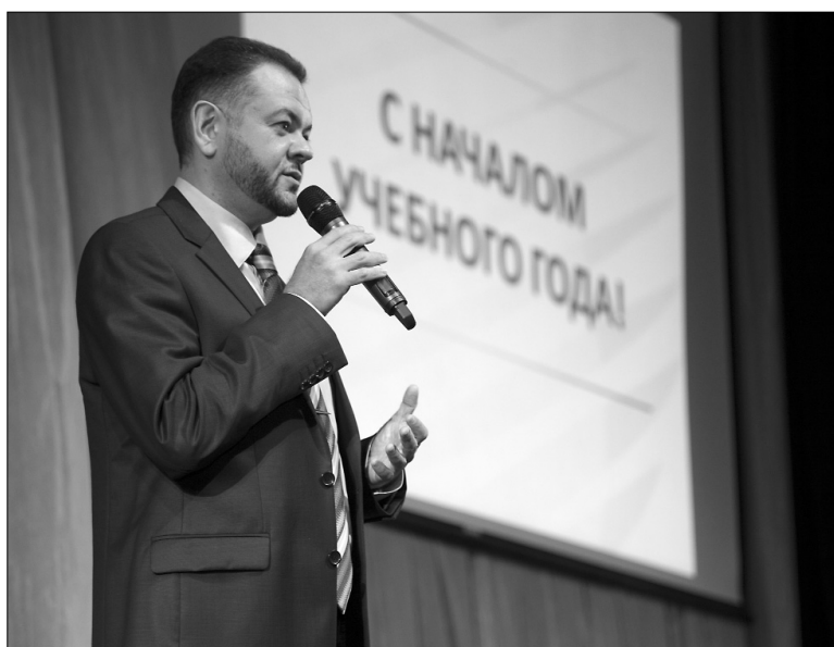
■ Задачи поставлены

рейтинге Webometrics, в котором заиндексировано около 22 тысяч вузов со всего мира. Сейчас ТГУ опережает в этом рейтинге подавляющее большинство американских и европейских вузов и находится где-то в середине списка английских вузов. Webometrics отражает прозрачность сайта вуза, в частности то, как на сайте представлены разработки наших преподавателей и учебно-методические материалы, а также публикационную активность.