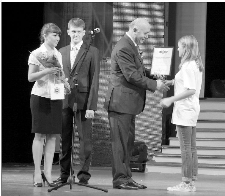
■ Почёт и призы — молодёжным лидерам

В регионе действует система стимулирования талантливой молодёжи в виде различных видов финансового поощрения и мероприятий, подчёркивающих значимость достижений одарённых детей. По итогам 2012 года поощрено 148 школьников — победителей и призёров олимпиад всероссийского и международного уровня, а также 59 наставников, в 2013 году — уже 198 школьников и 90 педагогов.