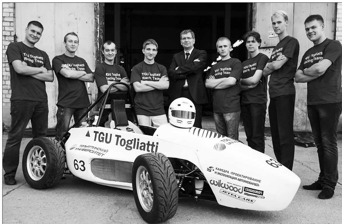
■ Верим: впереди успех

Оказывается, каждый третий конструктор или инженер «Формулы 1» — вершины автомобильного и гоночного искусства — начинал именно в серии «Формула Студент». Тогда как наши соперники из России уже давно «пасутся» в этих соревнованиях и имеют огромный опыт, близкий к тому самому «искусству», мы только-только шагнули на международ-