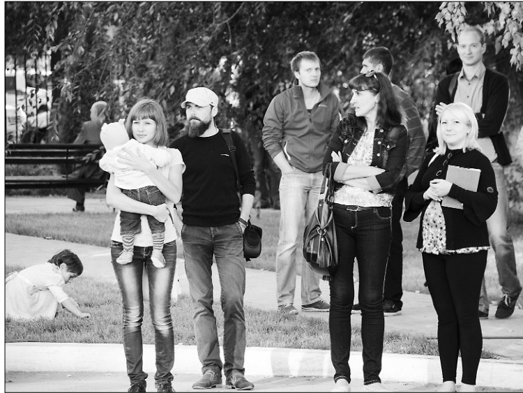
■ Каждый год на том же месте!

Было очень заметно, как зрители горячо отзывались на забытые мелодии своей молодости и будто снова превращались в студентов... Все участники получили призы, а победители — особо ценные, любезно предоставленные профкомом студентов и аспирантов ТГУ наручные часы с символикой «Российской Студвесны». Упоминание фестиваля студенческого творчества только прибавило ярких красок в воспоминания этого вечера. Многие в своё время были или зрителями, или участниками своих «Студвесен». Очень