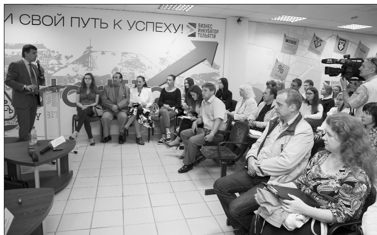
■ Министр открыт для всех