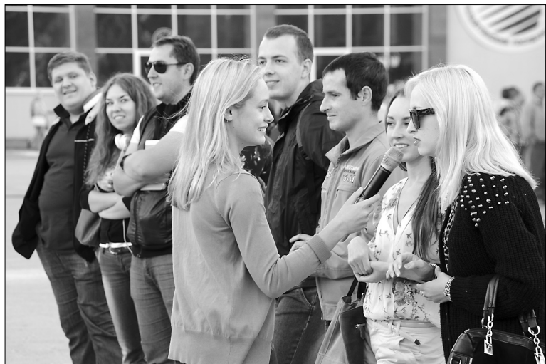
■ Проверка знаний — викторина с призами