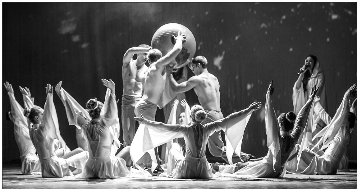
■ Фантастический сплав танца и вокала

— 200 добровольцев, состоящих в штате различных служб волонтерской делегации: работа со студенческими делегациями, гостями и членами жюри и др.