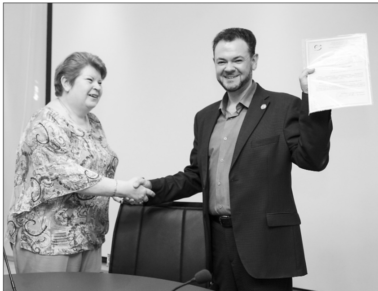
■ Сертификат вручён

Т ольяттинский государственный университет (ТГУ) стал первым в Самарской области вузом-участником системы добровольной сертификации «Военный Регистр». Вручение сертификата соответствия системы менеджмента качества университета военному и гражданскому ГОСТам состоялось 15 мая в деловом центре НИЧ ТГУ.