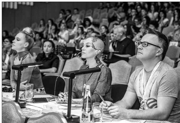
■ «Звёздное» жюри

никам «Студвесны» предстояло разделиться на различные площадки: музыкальное направление — вокальные и инструментальные номера; танцевальное направление — театральное направление — театр мод, КВН; оригинальный жанр — цирковые представления; региональные программы — целостная постановка с вокальными, танцевальными и театральными представлениями; журналистика.