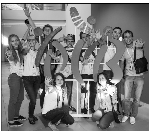
■ Мы сделали это!

— Я работала волонтером в службе сопровождения делегаций. Обязанности очень просты: помочь ребятам из другого города быстро сориентироваться на месте, никуда не опоздать, потому что программа насыщенная, ну и, конечно же, рассказать о нашем городе, чтобы гости чувствова-