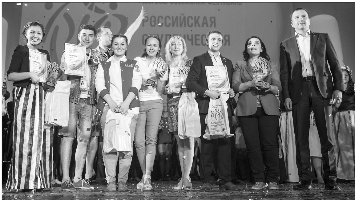
■ Звёздный час студенческих талантов

на отборочном этапе снимали на видео все члены жюри, а зал аплодировал стоя. Уровень экспрессии исполнения и высокое вокальное мастерство были очень горячо встречены зрителями.