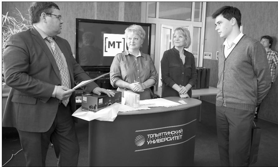
■ Спонсоры конкурса не скупятся на призы

Награждение проходило в форме дружеской встречи, на