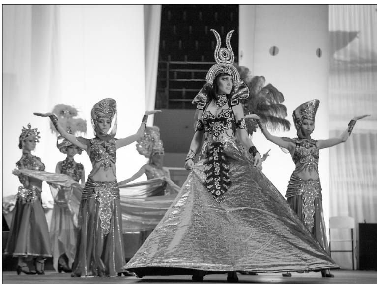
■ Театр моды или национальные костюмы?

Николай Меркушкин, губернатор Самарской области