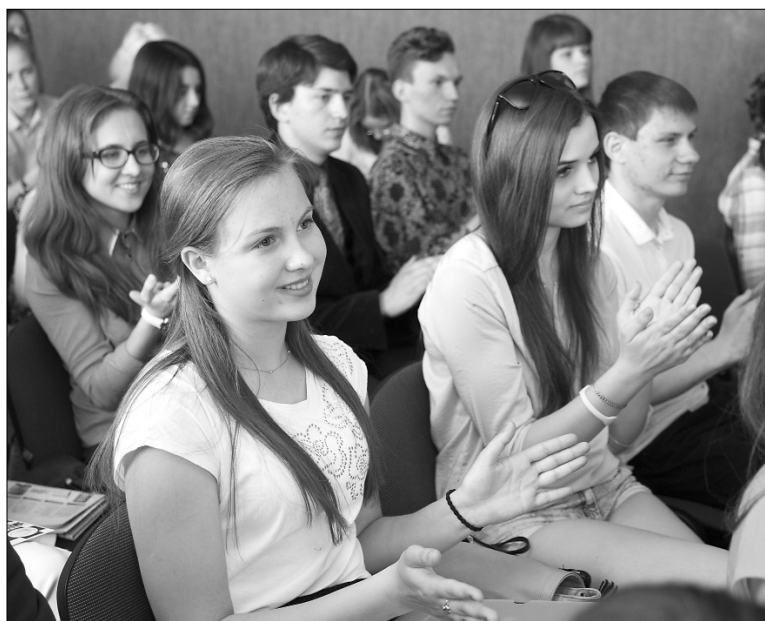
■ Участники конкурса