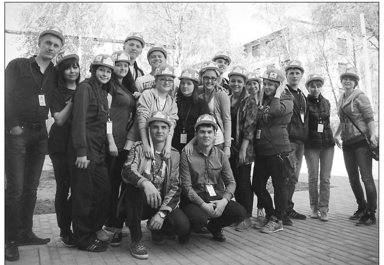
■ Студенты-строители из ТГУ