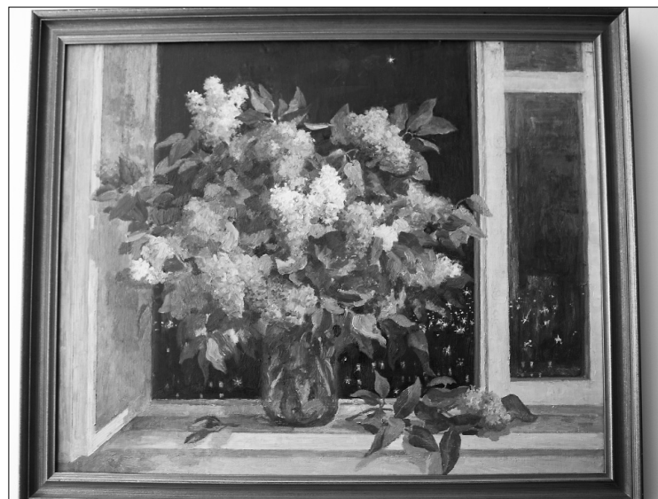
■ С. Кондулуков. Сирень в объятиях ночи