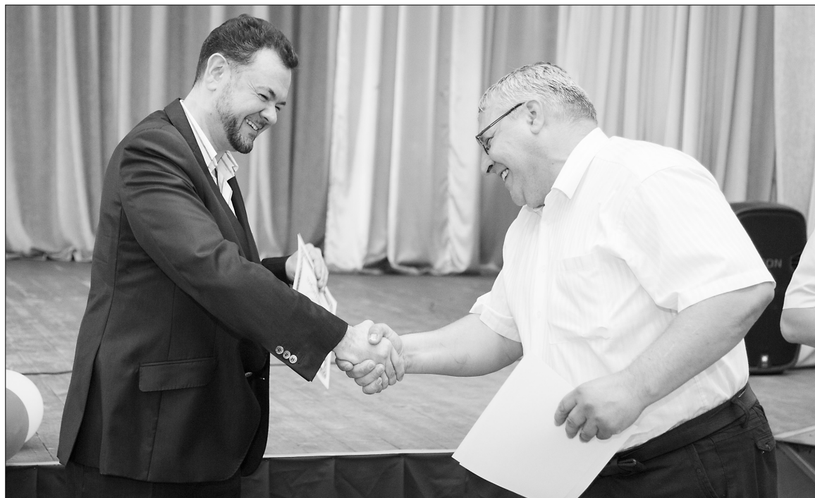
■ Отличные итоги проделанной работы