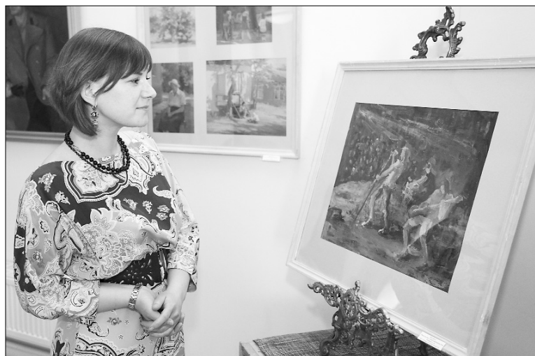
■ В экспозиции

Работы учеников представлены учебными заданиями, включающими живописные портреты, мозаику, эскизы росписей, рисунки, анализирующие строение человека. Осознаешь, что именно ученики впитывают в себя то, что достаётся им по наследству от талантливых учителей.