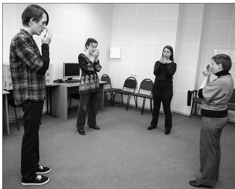
■ Сначала научись говорить тихо...

— Тренинг интенсивный. Два раза в неделю. И какой бы тренинг вы ни делали два раза в неделю, он даст результат, даст прогресс. В процессе прохождения курса мы делаем три записи. В конце будем слушать и отмечать, изменилось что-то или не изменилось. Но человек сам себя плохо слышит, ему не совсем кажется чётким это измене-