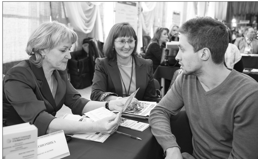
■ Хочешь работать? Выбирай...

Карьера — дело нешуточное. И откладывать трудоустройство до выпуска не стоит. Лучше позаботиться о своём будущем уже сейчас. В этом студентам призван помочь «День твоей карьеры», прошедший недавно в ТГУ.