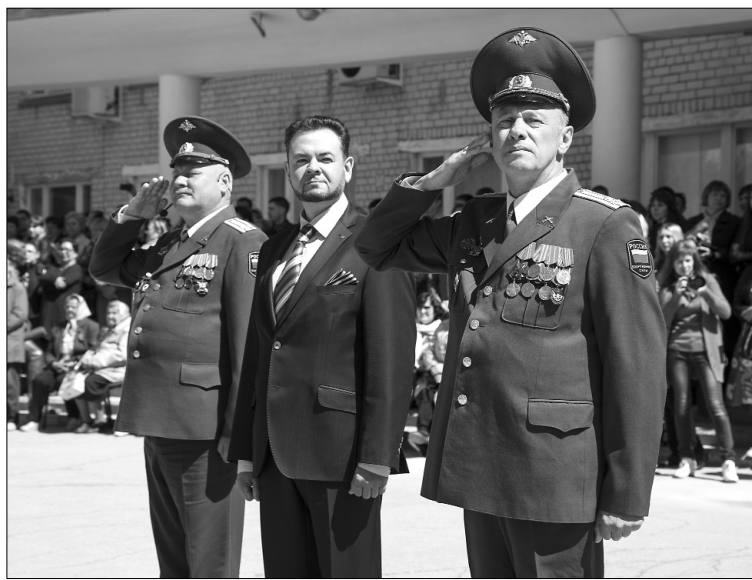
■ В торжественном строю