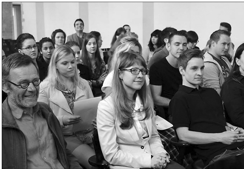
■ Мастер-класс в Бельгии

Российский город Тольятти очень сильно выделялся на фоне других представленных европейских городов. Некоторые вещи мне было очень сложно объяснить — например, то, что у нас нет велосипедных дорожек, ветряных электростанций и что мусор у нас почти не перерабатывается. А один раз я сказала: «Я живу в небольшом промышленном городе численностью