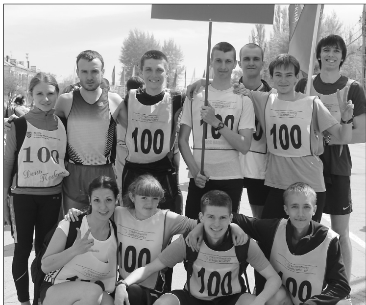
■ Победители в День Победы