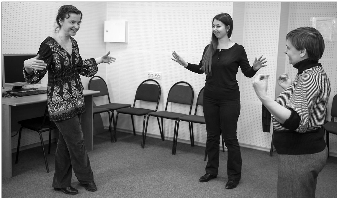
■ Слово должно рождаться свободно...

Каждый хочет быть услышанным. Как минимум. А как максимум, чтобы его слушали с интересом и желанием — с восхищением.