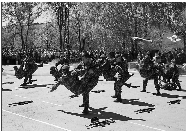
■ Яркое выступление: спецназ — за Победу!