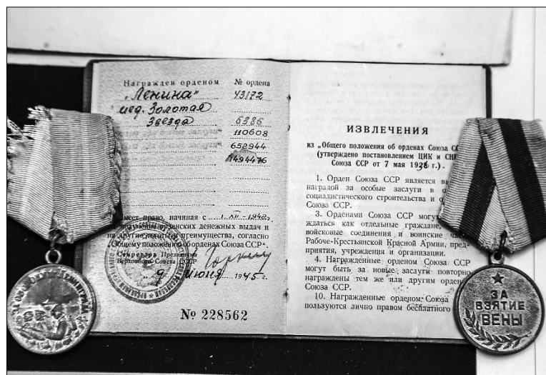
■ Раритетные экспонаты