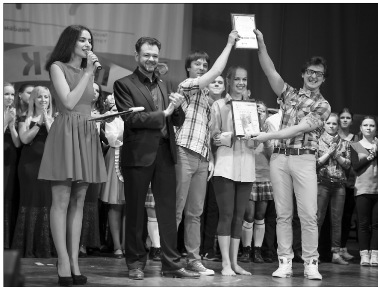
■ Ректор награждает лучших

Затем началась конкурсная программа, и в этот вечер на сцене были только лучшие из лучших. Каждый номер — маленький шедевр. Наверное, будь я на месте жюри, высший балл получили бы все. Хотя всё же были такие номера, которые запомнились больше остальных. Например, группа «Сидней» с песней «Видели ночь». Яркие костюмы, харизма участников, всем известная песня — всё это добавляло симпатии коллективу. Слушаешь их и