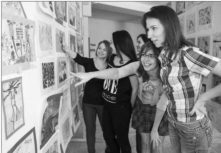
■ Детские рисунки — это радость!

22 апреля состоялось 4-е заседание профессиональной лиги «Техносферная безопасность». Формат её проведения был разработан четыре года назад. Практически это объединённое совместное заседание профессионального совета кафедры управления промышленной и экологической безопасностью ТГУ. В совет входят руководители органов государственного над-