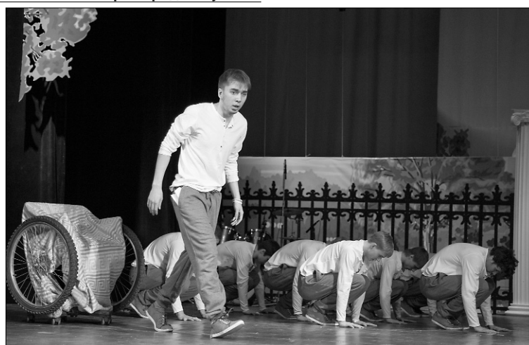
■ «Чувства, которые не передать»

на сцену. Одна девушка с виолончелью и одна за ширмой посреди сцены. А теперь попробуйте представить: пронзительная трогательная музыка и плавные движения девушки за ширмой, вернее, её тени. В следующий момент,