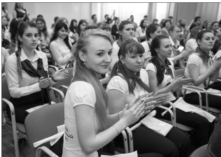
■ Олимпиада сдружила всех