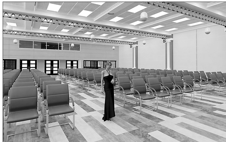
■ Проект преобразования актового зала

В 2014 году в соответствии с решением губернатора Самарской области Николая Меркушкина в региональном бюджете предусмотрены средства в объёме 27 млн рублей на улучшение материально-технической базы Тольяттинского государственного университета.