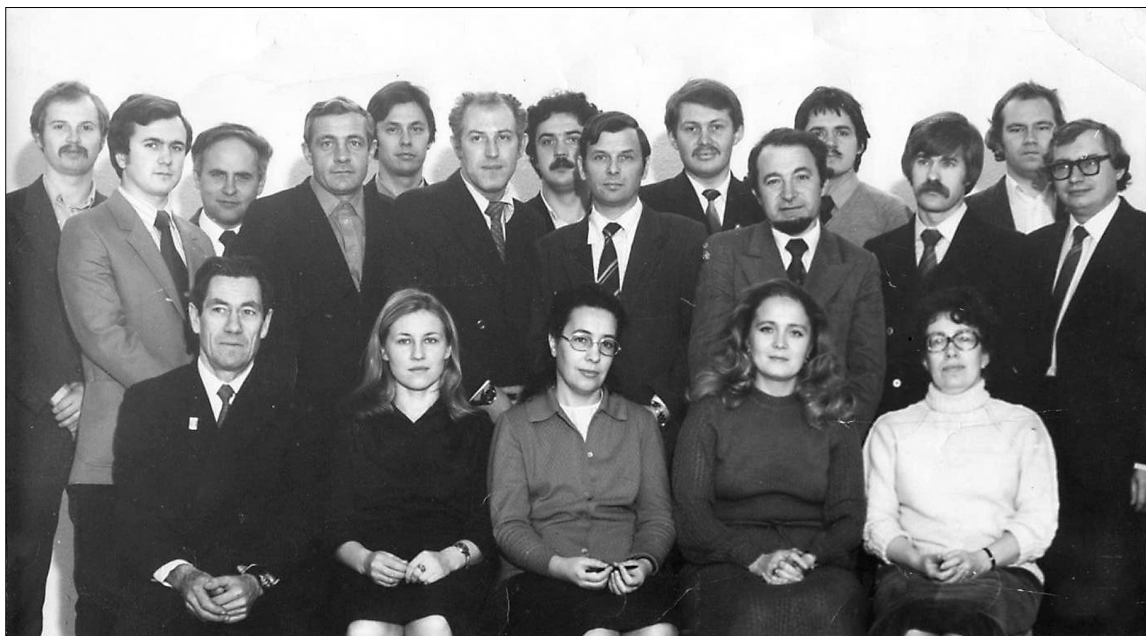
■ Старый состав кафедры

Высшее автомобильное образование в Тольятти возникло в 1967 году, когда постановлением Правительства СССР на базе филиала Куйбышевского индустриального института был создан Тольяттинский политехнический институт. Новый вуз был призван обеспечить строящийся Волжский автомобильный завод кадрами различных специальностей, в том числе по программам «Автомобили и тракторы» и «Двигатели внутреннего сгорания».