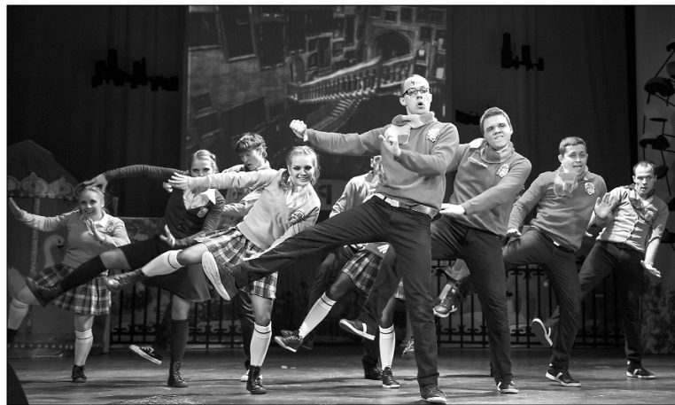
■ «Обыкновенная магия»

А было и такое выступление, от которого по спине пробежали мурашки. Тишина в зале подтверждала, что всё внимание зрителей обращено