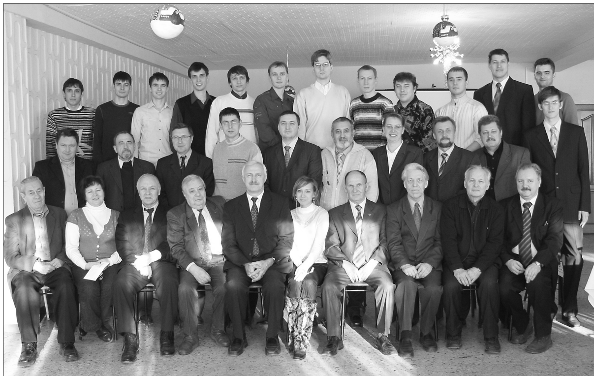
■ Поздний состав кафедры