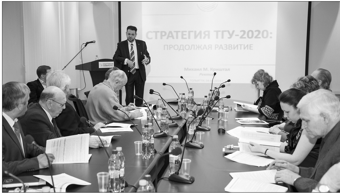
■ Начало положено...

4 апреля в Тольяттинском государственном университете прошла презентация нового фундаментального документа «Стратегия развития Тольяттинского государственного университета до 2020 года» — результата плотной работы коллектива вуза в течение девяти месяцев. Таким образом дан старт целому циклу мероприятий по доработке документа с последующим представлением и утверждением его на расширенном заседании Учёного совета.