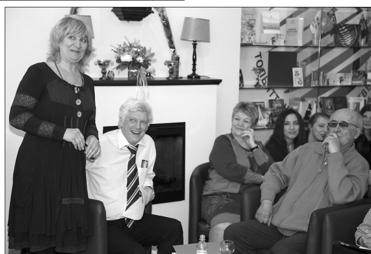
■ В гостиной сияли солнечные «зайчики» смеха...

«Смех — дело серьёзное, социальное и полезное... Смейтесь больше умственным, а не телесным смехом!»