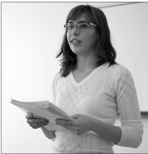
Стихи — это плод вдохновения и... творческих мук