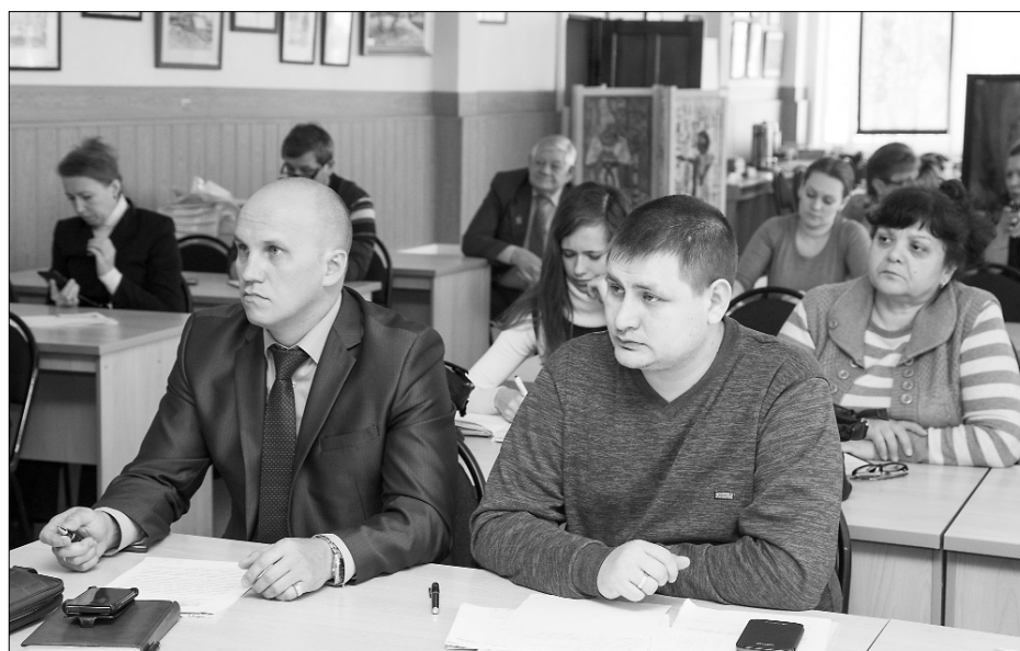
■ Встреча как информация к размышлению

Т ретьего апреля состоялась встреча представителей Тольяттинского государственного университета (ТГУ) с членами Ассоциации учреждений профессионального образования г.о. Тольятти. Цель — поддержка абитуриентов — выпускников средних профессиональных образовательных учреждений города при поступлении в вуз по новой системе, позволяющей обучаться по индивидуальному учебному плану, в том числе в ускоренные сроки. К слову, менее чем за месяц такой возможностью уже решили воспользоваться более 100 студентов и выпускников колледжей и техникумов Тольятти.