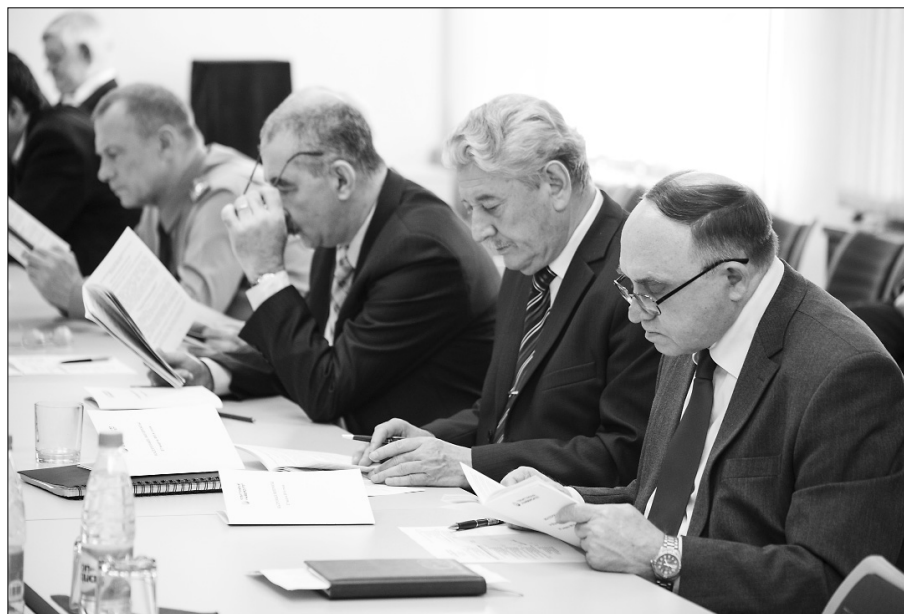
■ Момент размышления — момент истины

Увеличился и объём научно-исследовательских работ (НИР) на одного научно-педагогического работника (НПР). В 2013 году он составил 250,7 тыс. рублей, а в 2012 году был 211,9 тыс. рублей. Стоит отметить, что данный показатель включён в мониторинг деятельности вузов, однако, согласно данным отчётности, ТГУ в целом удаётся сохранить тенденцию роста данного показателя. Хотя при этом общая численность НПР и объёмы НИР уменьшились. Это обусловлено в первую очередь общефедеральной тенденцией снижения объёма финансирования и количества грантов. Данные обстоятельства, безусловно, заставляют вуз активизироваться в плане взаимодействия с негосударственным сектором, а также адаптироваться к новым формам господдержки. По словам Сергея Петерайтиса, ТГУ успел вовремя уловить эти веяния. Как результат — появление в составе университета Научно-исследовательского института прогрессивных технологий, аттестация в