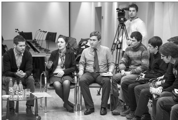
■ Заинтересованное обсуждение

Беседа началась с историй бизнесмена о первых заработанных деньгах, о воспитании, о первом опыте в бизнесе. Но это не был