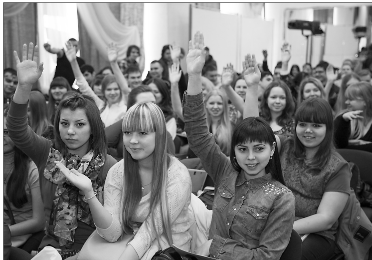
■ У студенток ТГУ есть цель в жизни