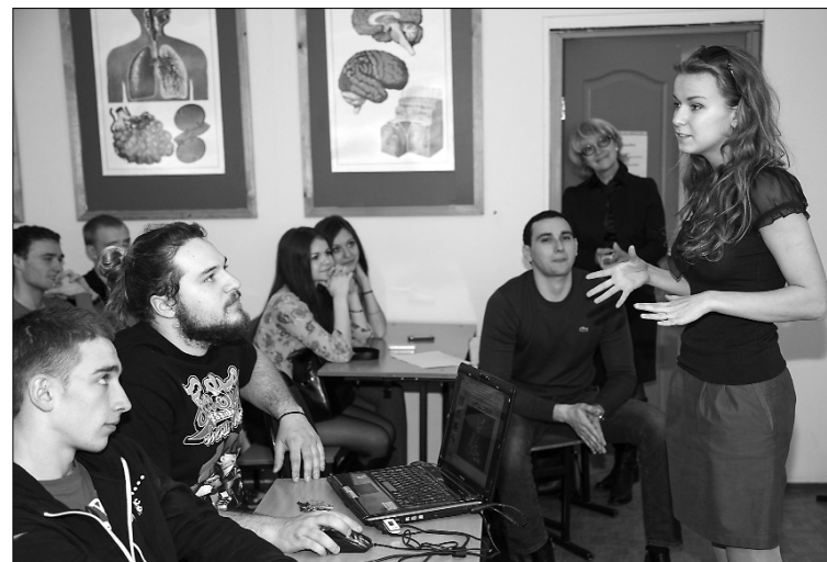
■ Первое задание в школе лидеров

щению попала смена «ЖКХ и строительство», зато появилась смена «Малая Родина — большие возможности», где будут прорабатывать и реализовывать проекты развития агропромышленного комплекса и малых городов. К тому же к участникам присоединится молодёжная делегация Китайской Народной Республики в составе 150 человек, а это значит, что «iВолга» выходит на новый, международный уровень.