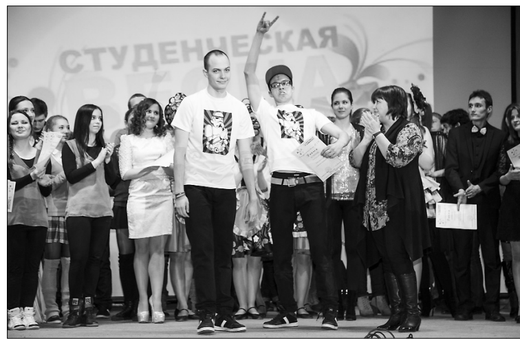
■ Награждение лауреатов и дипломантов