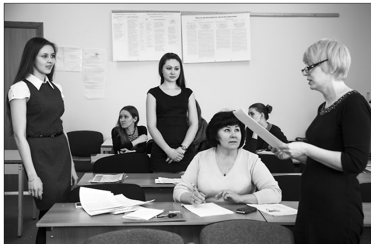
■ Обсуждение доклада

В ТГУ прошла XII городская научная студенческая конференция «Молодёжь. Наука. Общество», в работе которой приняли участие 193 участника из 12 вузов, представившие 174 доклада.