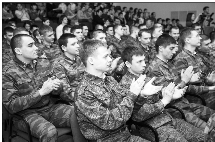
■ Студенты ИВО ТГУ — будущие офицеры

цах и дедах, об их подвигах, Россия непобедима, Россия будет сохранять свою мощь и свою державность.