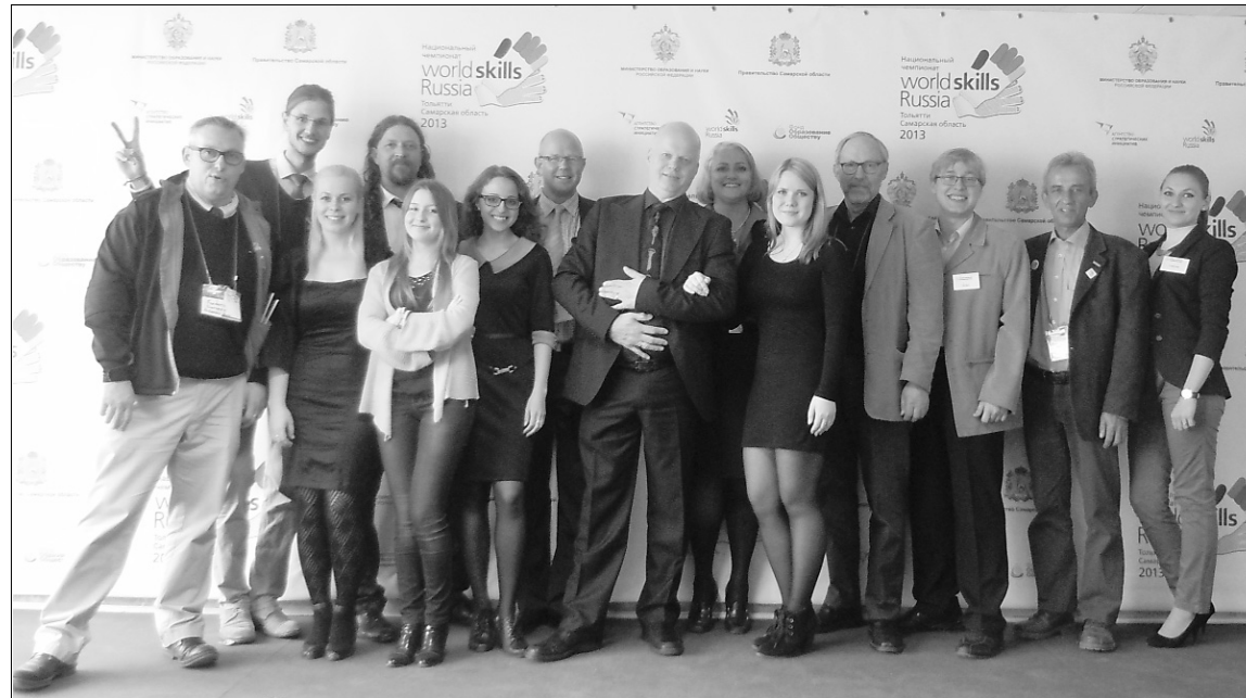
■ Члены жюри WorldSkills Russia и их помощники — переводчики студенты ТГУ

Не стоит забывать также о том, что конкурсы переводов, которые проводятся сотрудниками кафедры или в которых участвуют наши студенты, — это своеобразная школа повы-