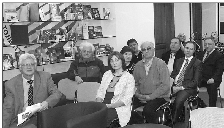
■ Музыка — наслаждение для всех

В нынешнее время каждый сам ищет свой путь к музыке. Одни с детства посещают музыкальные школы, кон-