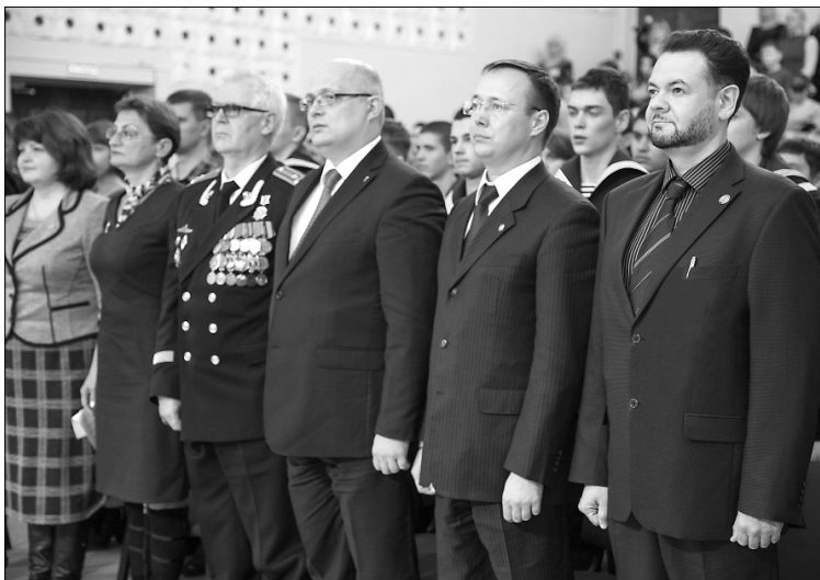
■ Открытие церемонии награждения. Гимн России

ных центров. Институт военного обучения ТГУ — без прикрас, один из лучших в стране. За годы своего существования военная кафедра и учебный военный центр нашего вуза подготовили более 14 тысяч офицеров. Все они готовы, защищая нашу Родину, дать достойный отпор потенциальному противнику. Я человек не военный, но когда вижу стройные ряды студентов ТГУ, проходящих колоннами в военной форме, каждый раз испытываю гордость за нашу страну. Уверен, что, пока мы помним о наших от-