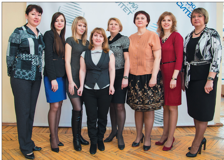
■ Коллектив управления по работе с персоналом