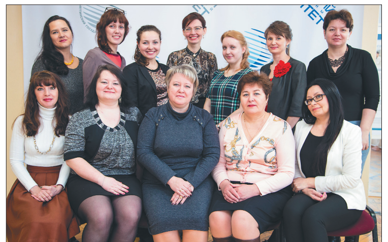
■ Коллектив управления делами