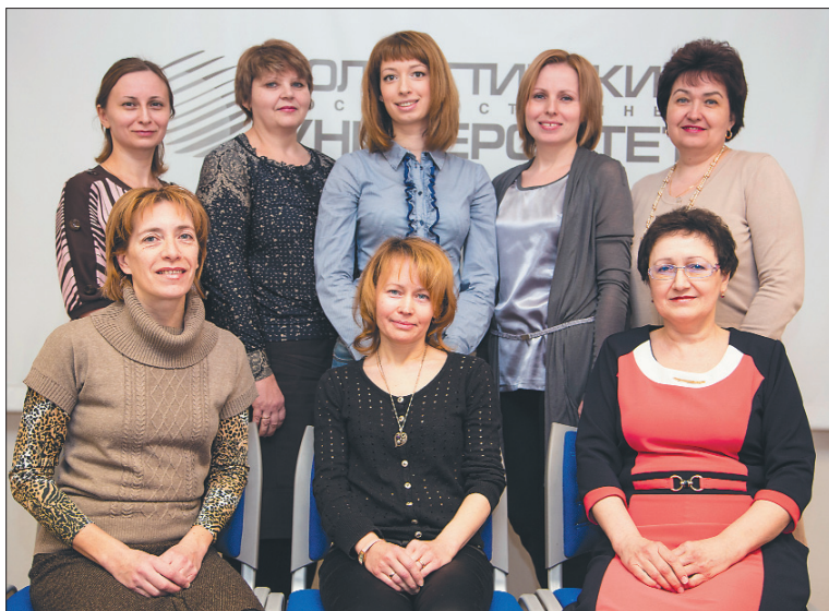
■ Коллектив Центра экономического развития

— Уже одно то, что в моём коллективе работают только женщины, говорит само за себя. Они, безусловно, для