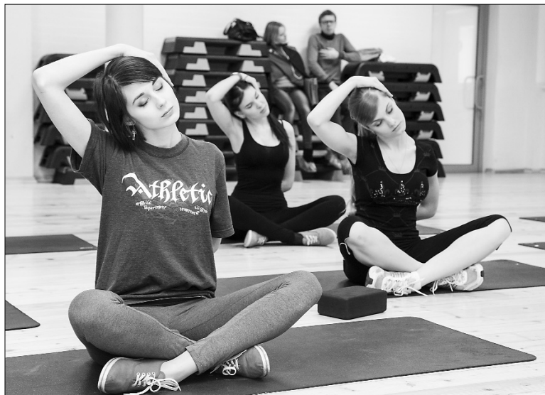
■ ...в спортзале «Фит Лайн»

редные встречи с патронессами конкурса «Мисс ТГУ», очередные репетиции, испытания и открытия.