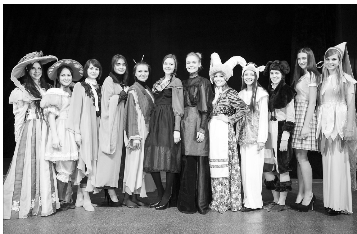
■ На сцене профессионального театра...

Времени остаётся всё меньше, а дел появляется всё больше. Репетиции, фото- и видеосъёмки, постоянные занятия, встречи с патронессами... Помимо индивидуальных встреч, состоялись уже три групповые: в фитнес-центре «Фит Лайн», в Тольяттинском художественном музее и в театре «Дилижанс».