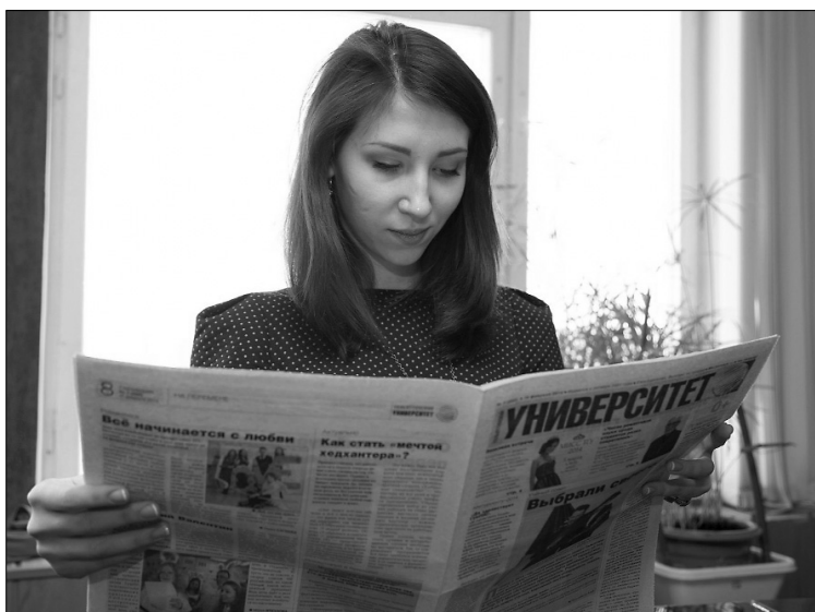
Заходи на нас посмотреть — vk.com/gazetaty

Редакция газеты «Тольяттинский университет» объявляет конкурс на лучшую фотографию со свежим выпуском нашей газеты. Фото на конкурс выкладывайте в альбом группы vk.com/gazetaty в соцсети «ВКонтакте». Победитель будет определяться по результатам народного голосования (про накрутки мы знаем, поэтому будем следить и нещадно наказывать). «На-