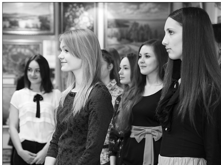
■ ...в художественном музее...

— Нас сегодня посетили удивительные красавицы. Но нужно отдать им должное, за их изумительными внешними данными стоит нечто большее. Во время экскурсии я наблюдала за девушками и