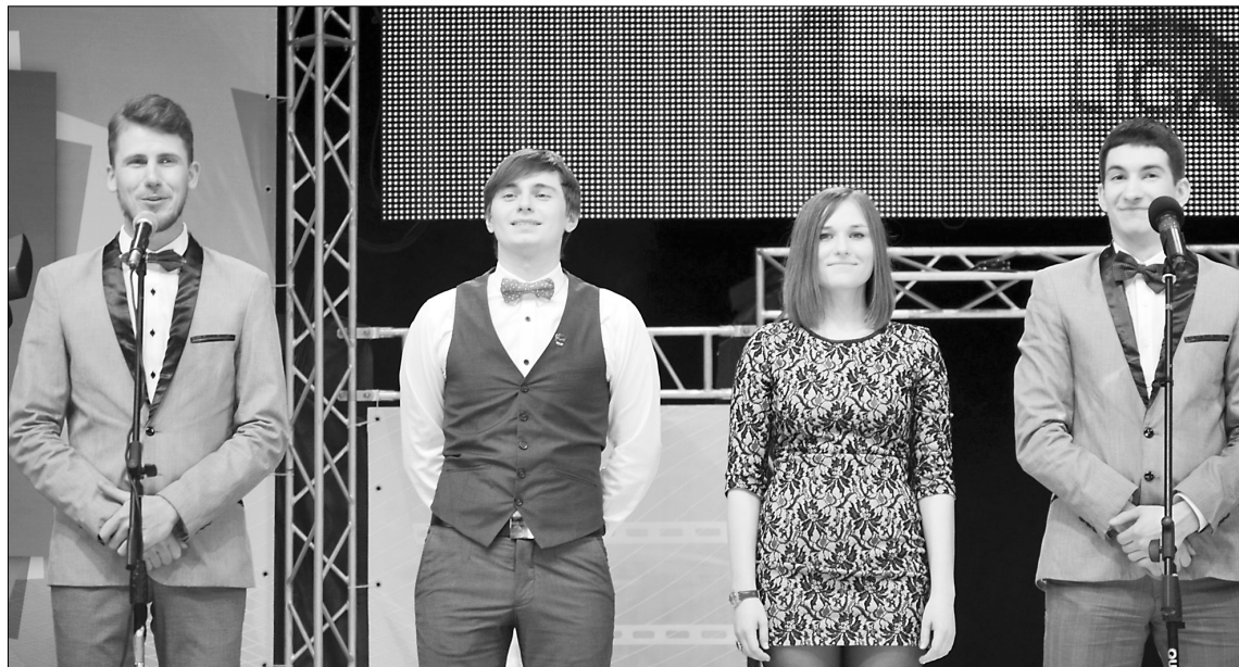
■ Они умеют «делать юмор»

«просто смешных» до самых «весёлых и находчивых». Однако каждый из отборочных