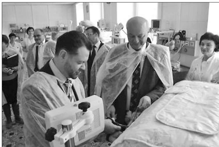
■ Доброе дело во благо детей

14 января группа компаний «АКОМ» совместно с Фондом «Духовное наследие» им. С.Ф. Жилкина открыли новый 2014 год благотворительной акцией и подарили родильному отделению Тольяттинской городской больницы № 2 имени Баныкина новое медицинское оборудование для палаты интенсивной терапии.