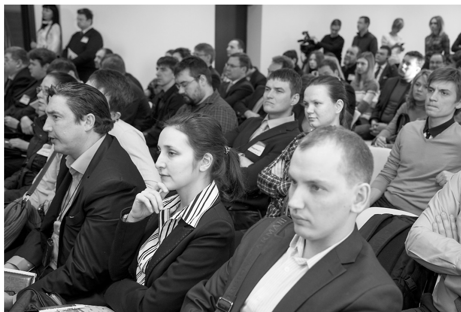
■ Участники Russian Startup Tour