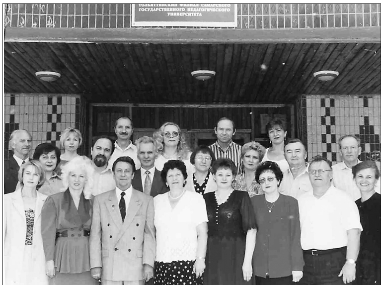
■ Преподавательский состав Тольяттинского филиала Самарского педагогического института в день 10-летнего юбилея