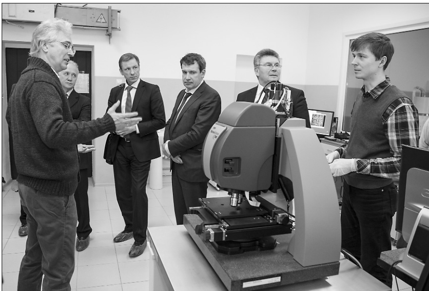
■ В новейших лабораториях ТГУ...