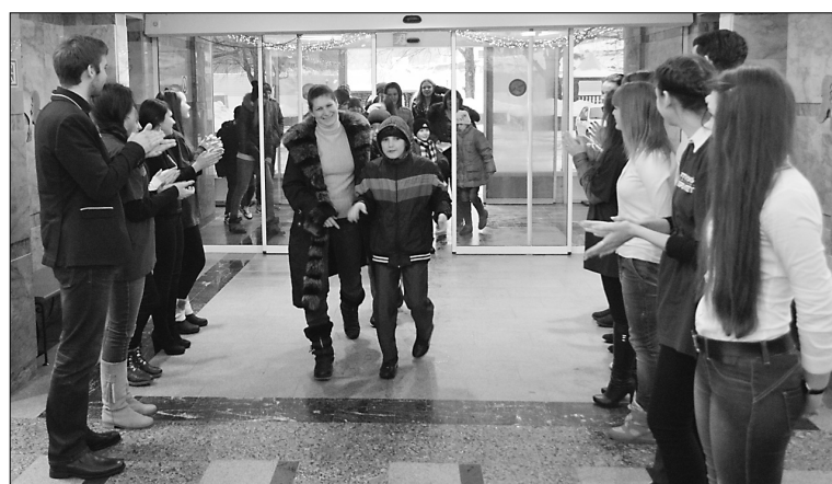
■ Детей приветствовали аплодисментами