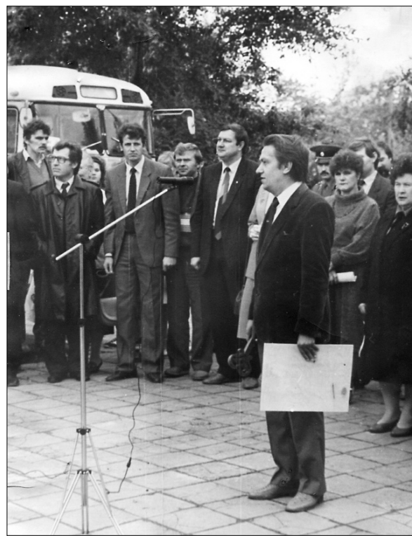
■ Открытие пединститута