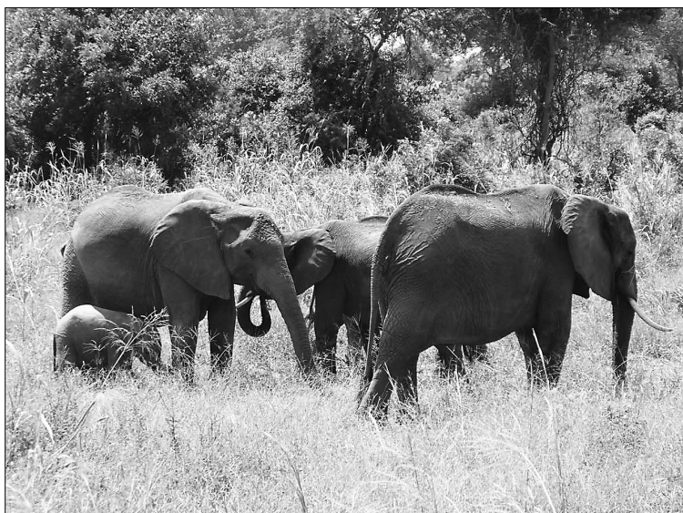
■ Слоны на прогулке

Паспортов танзанийцы не имеют. У них в лучшем случае справки или прикрепительные талончики. Для того чтобы приобрести паспорт, ты должен заплатить около тысячи долларов. Деньги для них, конечно, неподъемные. Получа-