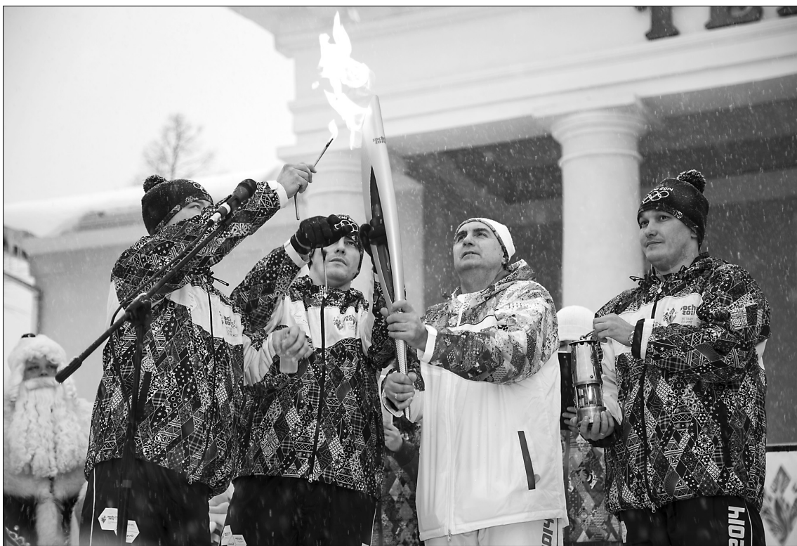
■ Есть первый факел в Тольятти!