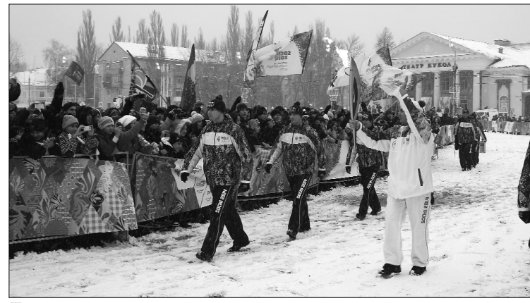
■ Эстафета добра