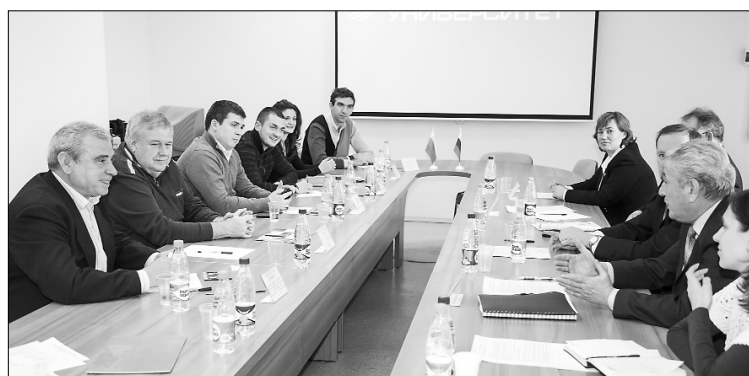
■ Встреча с делегацией из Казанька