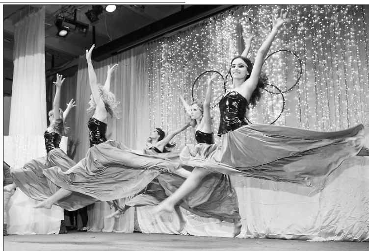
■ Экспрессия танца

Шум и крик стоял дикий, хотя хлопали люди не так активно. Зато оказалась полезной неумная энергия некоторых гостей. Во время выступления у одной из команд случайно пропал звук. Проблему решили простым способом: танцоры продолжили свое дело, пока благодарные зрители хлопали и отбивали примерный ритм. Пауза закрылась, а течение шоу не было нарушено.