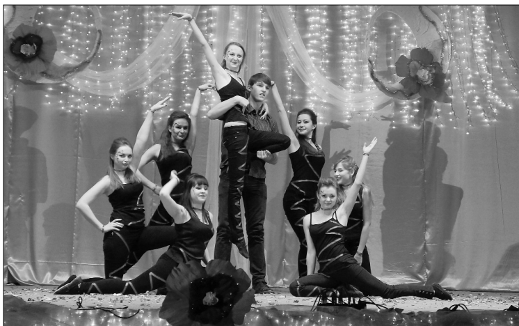
■ Праздник танца 2012 года

Студенты будут соревноваться в четырех группах: «Дебют», «Старшекурсник», «Профи» и «Уникум». Содержание композиций самое разнообразное — это и хип-