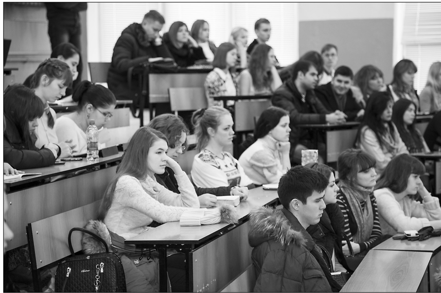
■ Студенты — журналисты, юристы и социологи