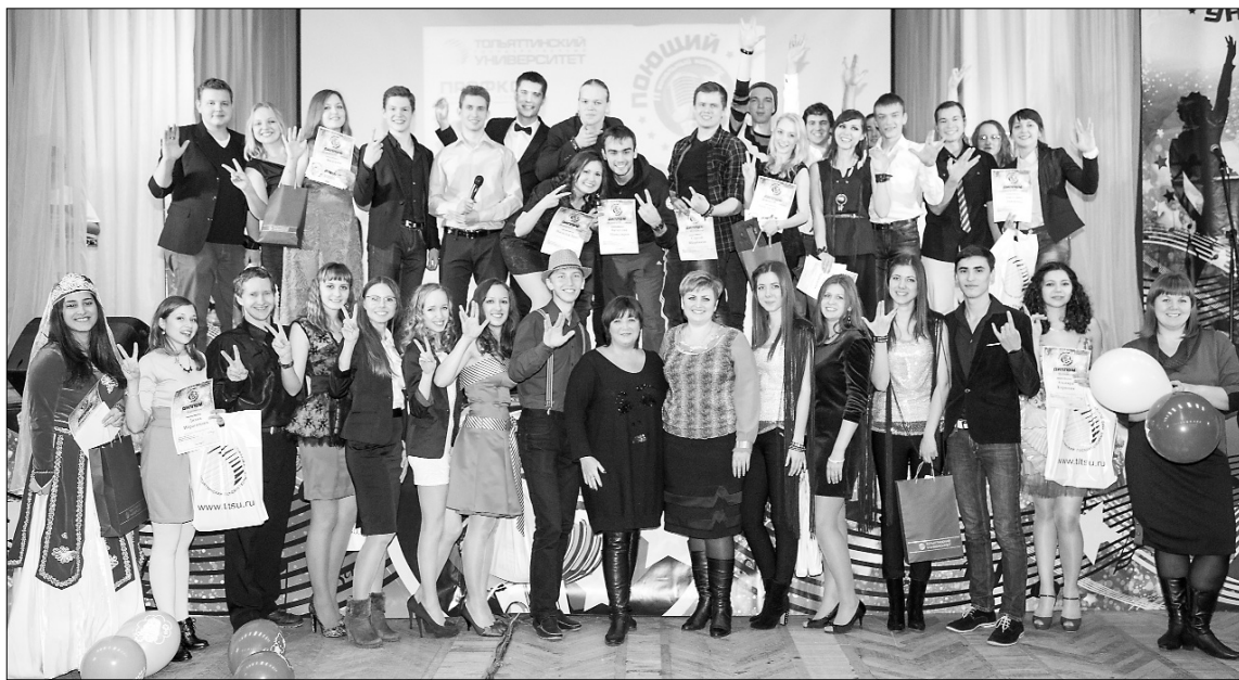
■ Участники гала-концерта — лучшие голоса ТГУ

В Тольяттинском государственном университете во второй раз прошел вокальный конкурс «Поющий УНИВЕР». Девятого, одиннадцатого и двенадцатого декабря в актовом зале ТГУ не стихала музыка. От народной песни до рэпа, от классики до современной эстрады — здесь можно было услышать все. По сравнению с прошлым годом количество участников выросло, ведь в этом году конкурс стал открытым и в нем приняли участие не только студенты, но и выпускники, и абитуриенты.