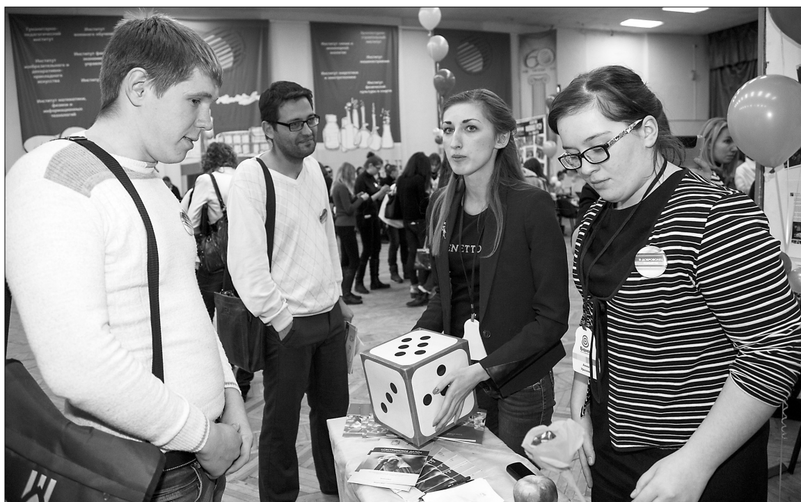
■ Главная задача волонтера — увлечь неравнодушных

В чера, 17 декабря, в актовом зале Тольяттинского государственного университета прошёл IV городской форум добровольцев, в котором приняли участие различные молодёжные объединения, некоммерческие организации, школьники и студенты. Организаторами мероприятия выступили МБУ «ДМО «Шанс» и молодёжное общественное объединение «Добровольческое движение Тольятти» при поддержке комитета по делам молодёжи мэрии г.о. Тольятти.