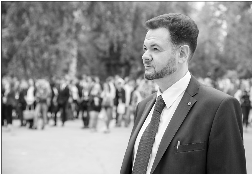
■ Ректор ТГУ Михаил Криштал

В 2012-м ситуация стала выравниваться, и уже в 2013 году мы свели дефицит бюджета при его принятии к нулю. Несмотря на то что многое в нашей жизни плохо прогнозируемо, нам удалось исполнить этот бездефицитный бюджет. Насколько я помню, в бюджет ТГУ дефицит начали закладывать начиная еще с 2007 года. И до