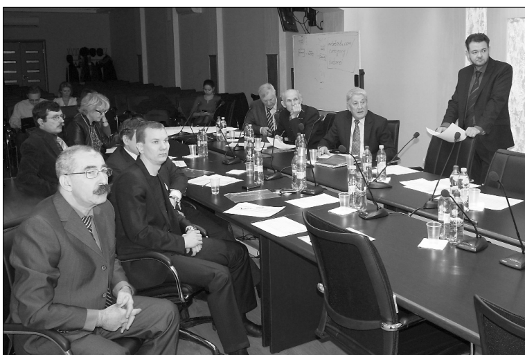
■ Финансы — основа стратегии развития

3 ноября в Тольяттинском государственном университете состоялся запуск работ по планированию финансово-хозяйственной деятельности (ФХД) институтов и кафедр.