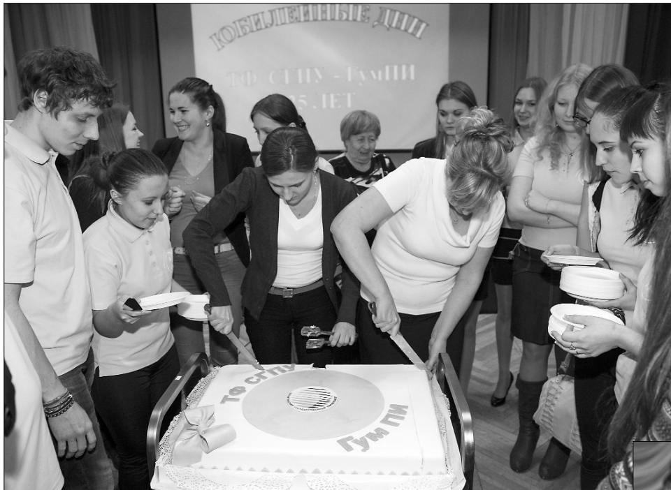
■ Сладкий «праздничный момент»

Каждый награжденный преподаватель в доверок к грамоте или благодарствен-