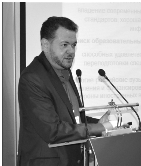
■ Окончание. Начало на 1 стр.

Понятно, что, с одной стороны, для этого необходимо дать возможность бизнесу контролировать организацию и реализа-