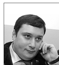
Депутат Государственной Думы А.Е. Хинштейн:

В заключение отмечу, что интенсивное развитие, которое демонстрирует ТГУ в последние годы, безусловно, идет на пользу отечественному инженерно-техническому образованию и науке.