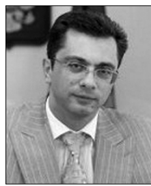
Владимир Гутенев, первый заместитель Председателя Комитета по промышленности Государственной Думы РФ:

И положительные отзывы продолжают поступать.