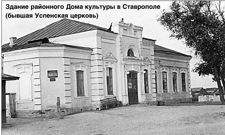
Здание районного Дома культуры в Ставрополе (бывшая Успенская церковь)