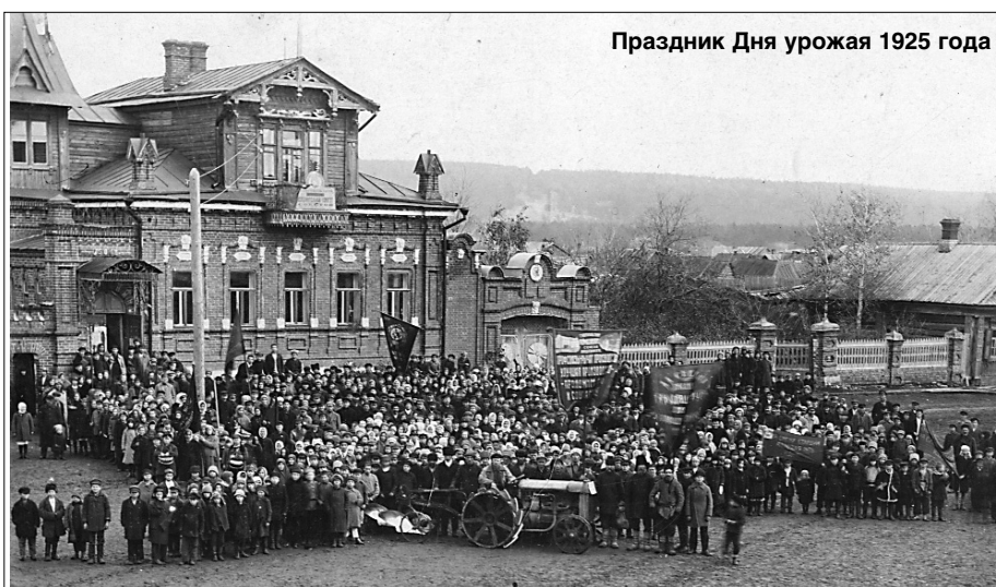
Праздник Дня урожая 1925 года

Сыграла свою роль в разнообразии досуга ставрополь-