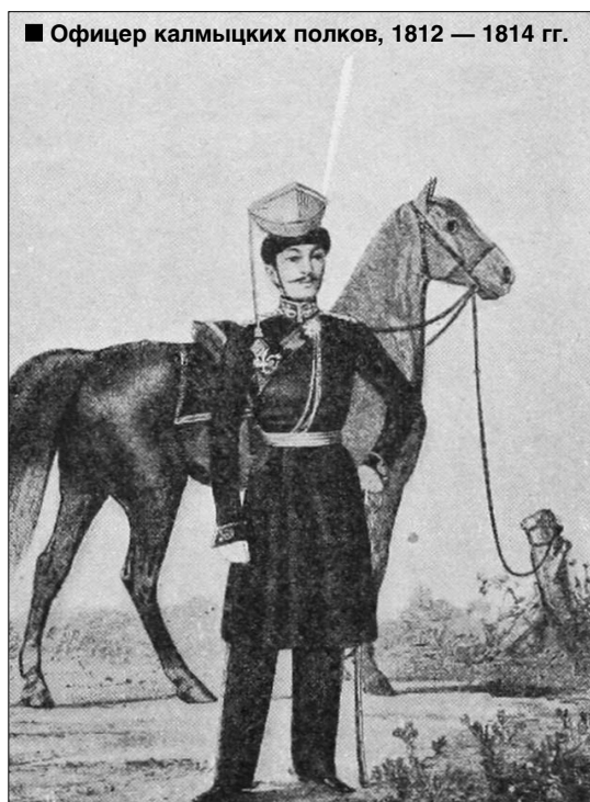
■ Офицер калмыцких полков, 1812 — 1814 гг.

Славной страницей в истории Ставропольского калмыцкого полка было его участие в битве под местечком Мир 27-28 июня 1812 года. Преследуемые частями маршала Даву, калмыки, находившиеся в арьергарде II армии Багратиона, успешно отбивали атаки неприятеля. Умелое действие конницы дало возможность без потерь отступить армии Багратиона на соединение с Барклаем-де-Толли. За участие в этом бою и под Романовом (2 июля) и