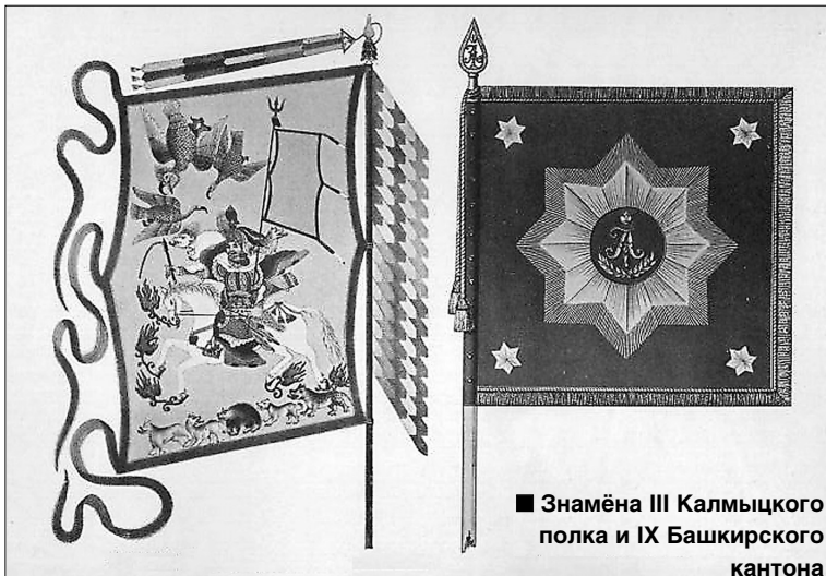
■ Знамена III Калмыцкого полка и IX Башкирского кантона

В конце 1811 года командование Ставропольским калмыцким полком принял 32-летний капитан Оренбургского гарнизонного полка Па-