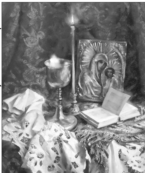
Рисунок Светланы Горячевой

Вот она, радуга! Рядом! Шёл будто жизнь... и нашёл... И уже будто бы взглядом Ввысь, в поднебесье, пошёл... Ввысь, над Землею умытой, Божью принявшю Суть! Златом небесным расшитый, Круто вздымается Путь!..