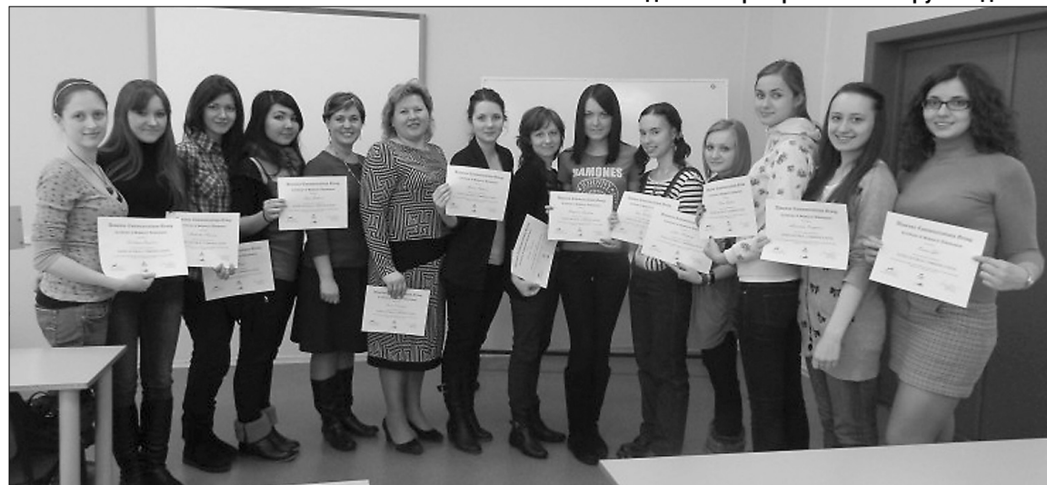
■ Обладатели сертификатов и их руководители

А 20 марта состоялось вручение сертификатов участникам курса межкультурной коммуникации, проходившего в прошлом семестре.