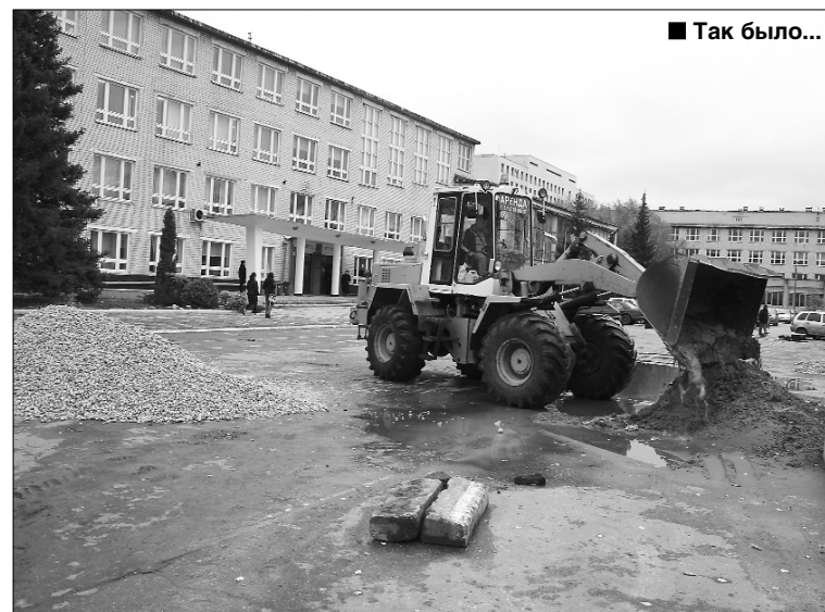
■ Так было...