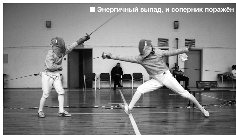
■ Энергичный выпад, и соперник поражен

Металлический звон и холодный блеск клинков, радостные возгласы спортсменов и всеобщее оживление царили 30 и 31 октября в корпусе ТГУ на Фрунзе, 2 г. Все эти два дня в малом физкультурном зале проходил Всероссийский турнир по фехтованию на саблях.