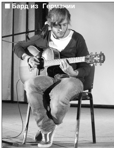
■ Бард из Германии