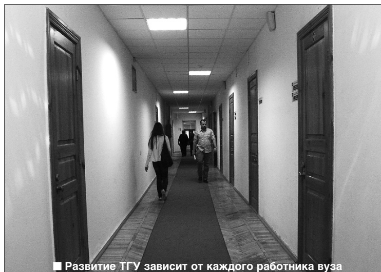
■ Развитие ТГУ зависит от каждого работника вуза

Я глубоко убеждён в том, что без развития ТГУ успешная модернизация экономики Тольятти невозможна. Мы пытаемся, и в целом успешно, донести это понимание до тех, от кого зависит принятие соответствующих решений. Но и без этих решений перспективы развития экономики Тольятти в направлении её модернизации и диверсификации, востребованность инновационных разработок резко усиливают