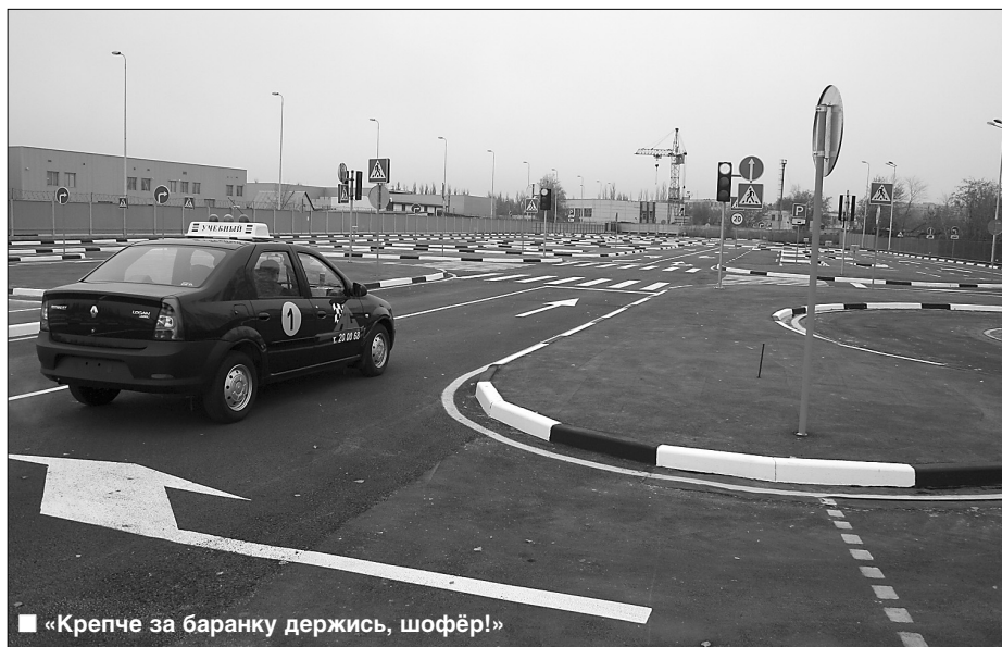
■ «Крепче за баранку держись, шофёр!»

— Расскажи, какие изменения ждут автошколу ТГУ в ближайшее время?