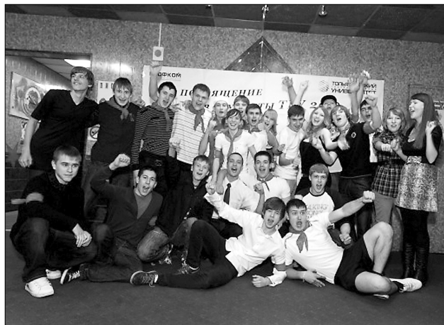
■ Чтобы учиться с пионерским задором!

28 октября «Пирамида» встретила в своих вместительных стенах первокурсников автомеханического института ТГУ, чтобы присвоить им по праву принадлежащее звание «студент АМИ».