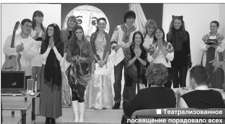
■ Театрализованное посвящение порадовало всех

Наконец-то! Дождались! В зале полно народу, играет зажигательная музыка, диджей крутит пластинки, ведущие готовятся за кулисами, а виновники торжества с волнением ждут чего-то необычного.