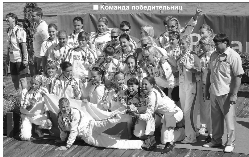
■ Команда победительниц