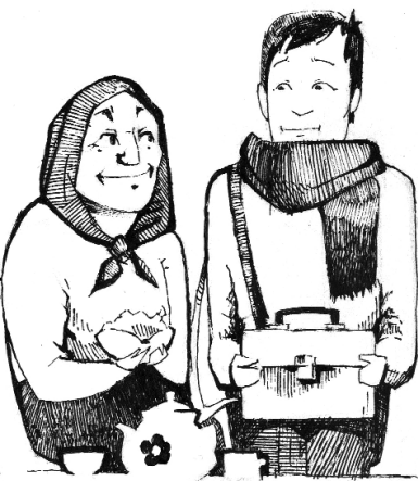
Рис. Алексея Щербакова