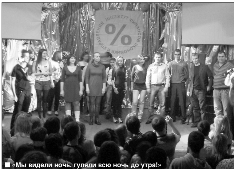
■ «Мы видели ночь, гуляли всю ночь до утра!»

Г орящая огнями сцена, жёлтыми листьями с «процентами» (бренд института) оформленный зал, уверенные ведущие и хорошо поставленные номера — всё это «Посвящение в студенты ИФЭиУ — 2010».