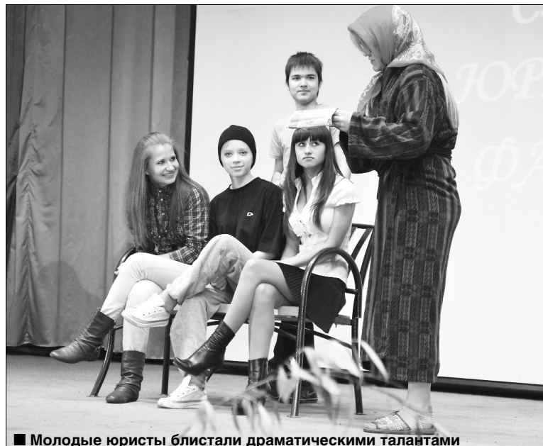
■ Молодые юристы блистали драматическими талантами

11 октября состоялось посвящение в студенты юридического факультета ТГУ.