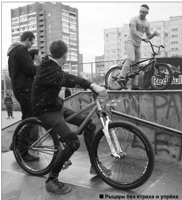
■ Рыцари без страха и упрека

С лишком низкие велосипеды для парней, слишком крутые горки без ступенек, слишком много людей с фотоаппаратами и даже телевидение — все это областные экстремальные соревнования «Fun BMX Day».