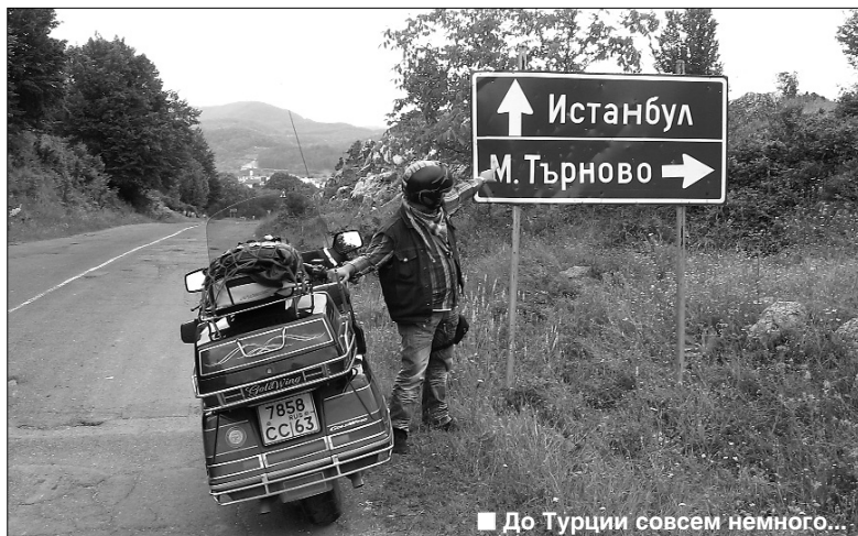
■ До Турции совсем немного...