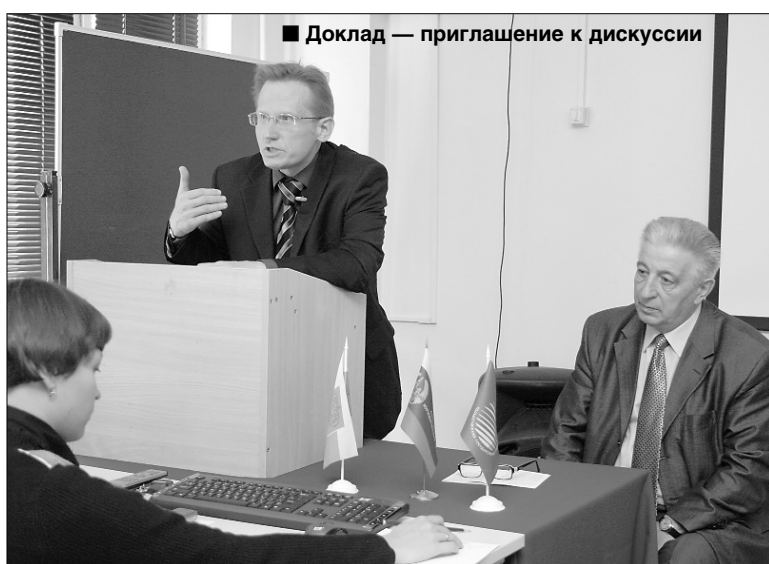
■ Доклад — приглашение к дискуссии