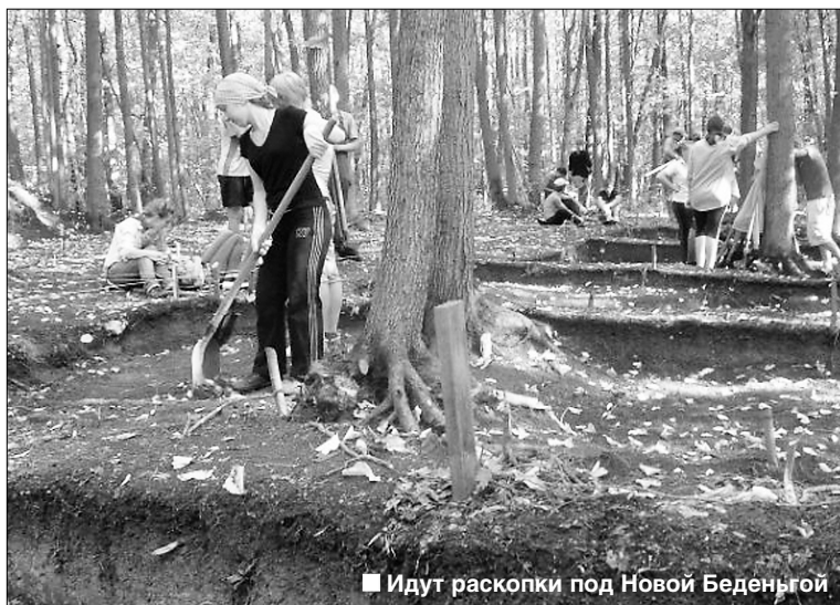
Идут раскопки под Новой Беденьгой