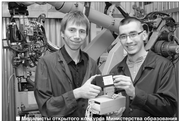
■ Медальисты открытого конкурса Министерства образования