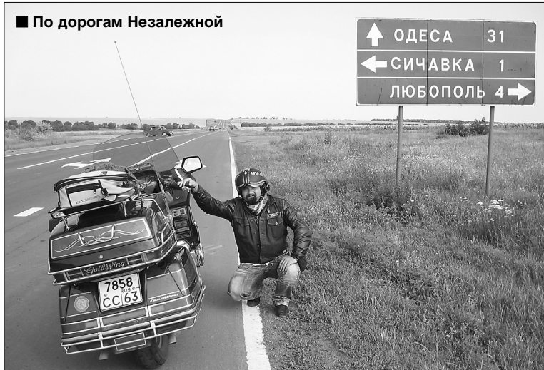
■ По дорогам Незалежной

ским паромным линиям, паром закрывается. Делать нечего — маршрут прежний, едем вокруг Черного моря посуху.