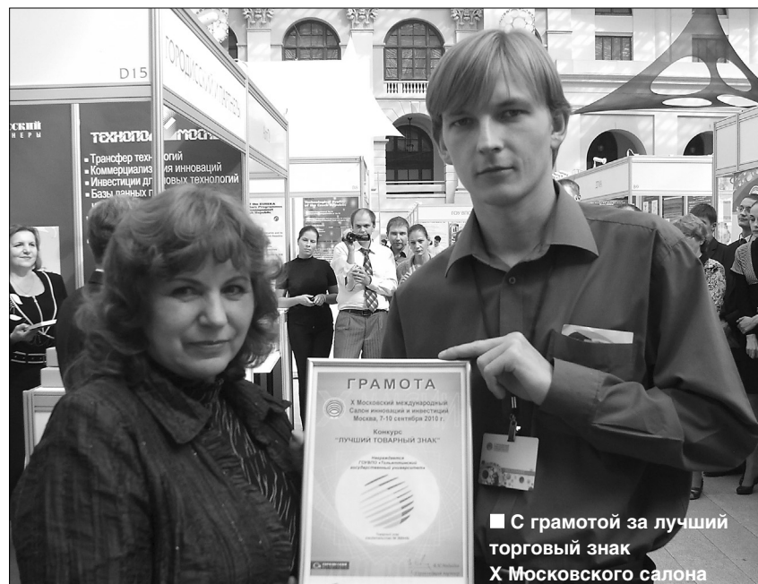
■ С грамотой за лучший торговый знак X Московского салона