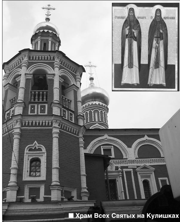
■ Храм Всех Святых на Кулишках