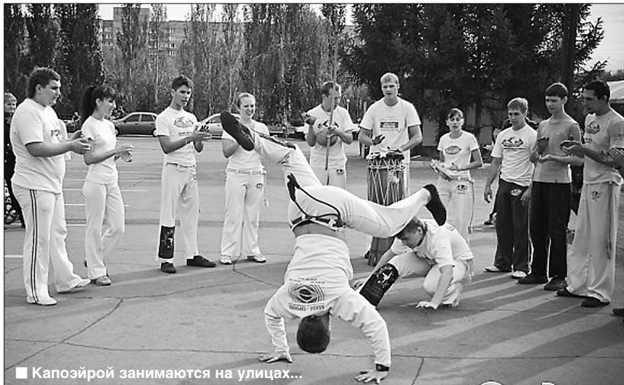
■ Капоэйрой занимаются на улицах...

Н е во всяком здоровом теле здоровый дух, и не каждый вид боевого искусства может воспитать, согласно морали, тот самый дух спортсмена. Славно, что есть альтернативные варианты, где спорт приобретает черты не только культуры физической, но и духовной.