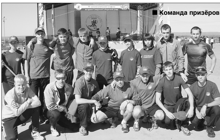
■ Команда призеров

11 сентября в Самаре прошла легкоатлетическая эстафета на приз Самарской губернской думы, посвященная XXI Всероссийскому олимпийскому дню бега и 65-летию Победы в Великой Отечественной войне. Эстафета проходила на главных площадях города и состояла из девятнадцати этапов. Более семидесяти команд со всей области приняли участие. И если в прошлом году сборная ТГУ заняла третье место, то это участие ознаменовалось