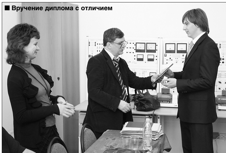
■ Вручение диплома с отличием