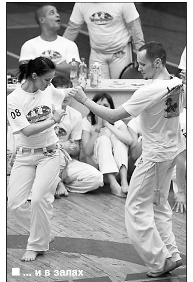
■ ... и в залах