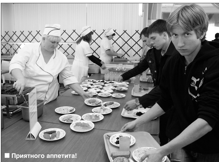
■ Приятного аппетита!

Мы уже получили массу положительных отзывов и от самих студентов. Новая система была признана удобной, современной, креативной и продуктивной. Такие отклики, безусловно, радуют, ведь комплексная раздача еще не