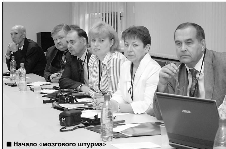
■ Начало «мозгового штурма»