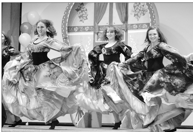
■ «Умчитесь прочь, мои печали!..»

Песни, танцы, боевые искусства — это все прекрасно и серьезно, нужно разбавить этот коктейль и искрометным юмором. Дорогие гости презентации, не забывайте, вам достались билеты на шоу, где все включено! Клуб веселых