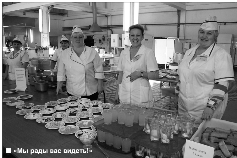
■ «Мы рады вас видеть!»

С этой осени в столовой ТГУ изменилась система комплексных обедов. Знакомые студентам блюда с 11.00 до 13.00 теперь подаются по новой, упрощённой схеме.