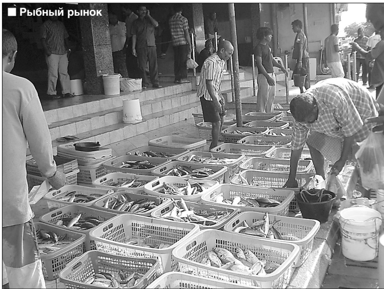
■ Рыбный рынок

один из гротов рифа. Своим видом он предупреждал всех, что гости его, подарки гостей его и никто другой на них прав не имеет. Так и плавали. Фотографии наполеона с каждым из команды украшают наши альбомы.