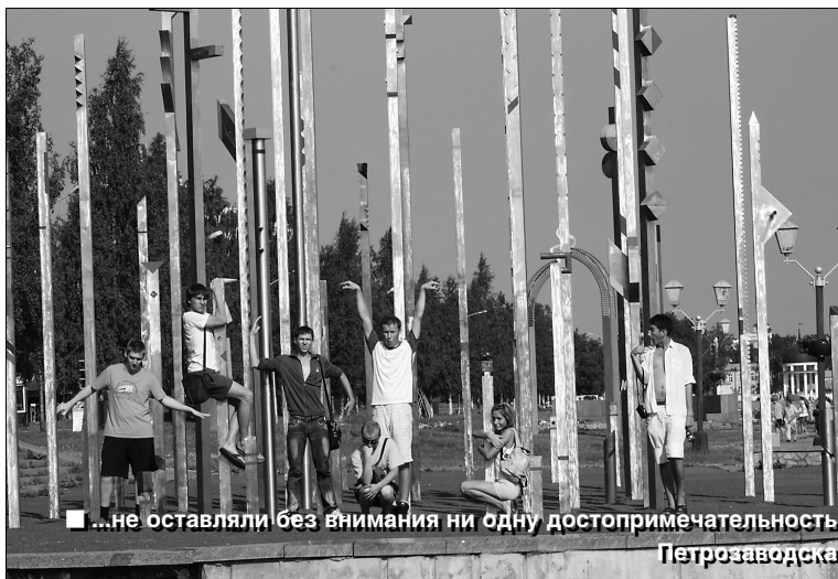
■ ...не оставляли без внимания ни одну достопримечательность Петрозаводска

Четыре дня и три ночи пролетели совсем незаметно. Чего и следовало ожидать. Времени, конечно же, не хватило, чтобы посмотреть все, что нам хотелось. Но воспоминаний у всех путешественников из ТГУ осталось предостаточно! Больше всего запомнились прогулки по городу, многочасовые неспешные походы по проспектам, пере-