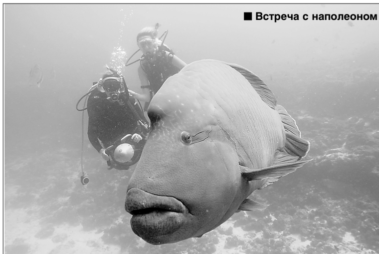
■ Встреча с наполеоном

Мальдивы получили независимость в 1965 году. Референдумом 1968 года Мальдивские острова, являвшиеся