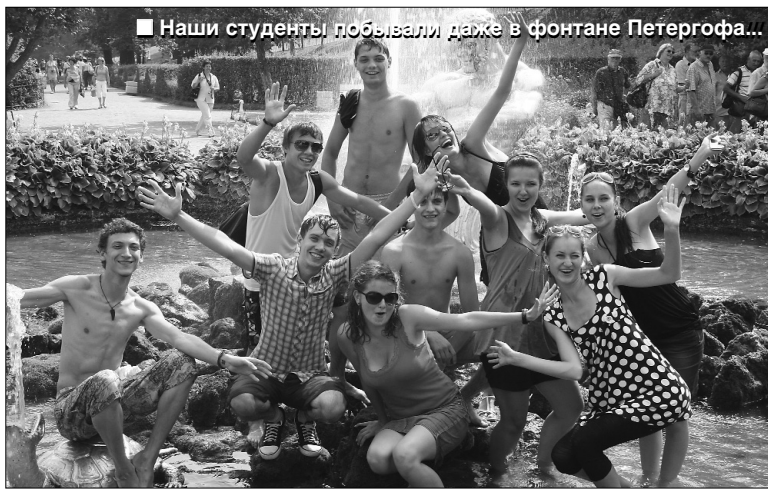
■ Наши студенты побывали даже в фонтане Петергофа...

Активная жизненная позиция в учёбе и спорте, науке и культурно-массовых мероприятиях приносит студенту ТГУ неплохие дивиденды. Судите сами: 108 студентов ТГУ были поощрены поездками в Крым, Санкт-Петербург и Карелию.