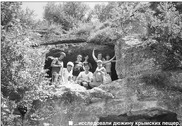
...исследовали дюжину крымских пещер.

Умение работать в команде повлияло на отдых. Студенты все делали вместе: ловили соленые волны в море, дегустировали вина, гуляли по вечерам и танцевали на дискотеках. В день нашего отъезда москвичи с сожалением провожали тольяттинцев. Они долго махали на прощание, когда мы садились в автобус, который должен был отвезти нас на железнодорожный вокзал.