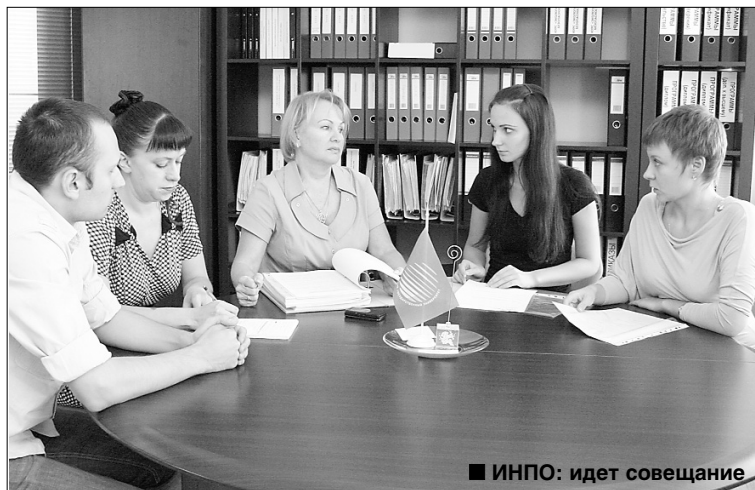
■ ИНПО: идет совещание

Т ольяттинский государственный университет станет первым в России центром по подготовке и переподготовке специалистов в сфере архитектурно-строительного проектирования. Это решение было принято на рабочей встрече с представителями наблюдательного совета Ассоциации экспертного обеспечения (поддержки) инвестиционных проектов Приволжского федерального округа, некоммерческого партнерства саморегулируемой организации (НП СРО) и государственными экспертами в области проектной документации. Встречу 15 — 17 июля проводил институт непрерывного профессионального образования (ИНПО) ТГУ.