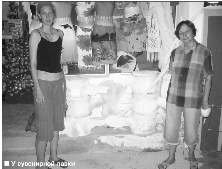
■ У сувенирной лавки

Донья вывела нас к месту погружения — рифу на глубине 15 метров от поверхности. Бортовые огни потушены, глаза привыкают к темноте. Царящее напряжение вызвано не боязнью, а сосредоточенностью перед погружением. Первое сообщение — сильное течение, и есть опасность, что группу раскидает. Принято решение закрепить под водой страховочный канат. Дайвгиды