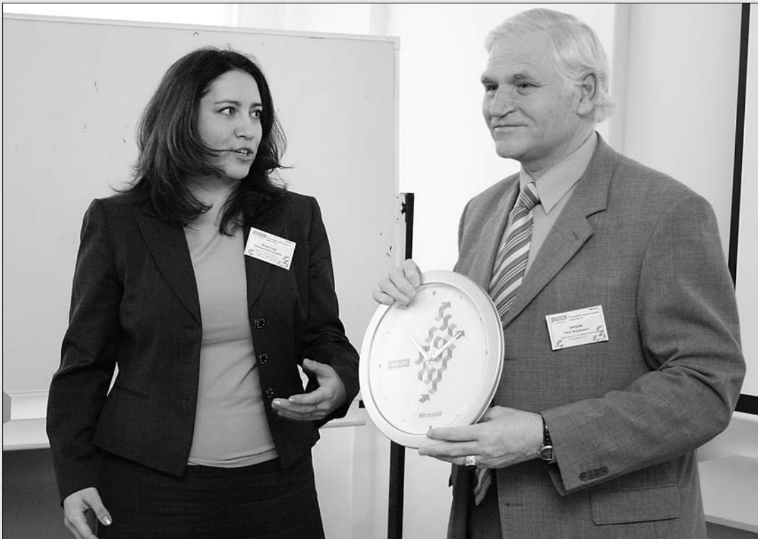
■ Время пошло!

Д етям «компьютерной эры» трудно представить, что три десятка лет назад компьютеры были доступны лишь единицам россиян. Загадочная компьютерная техника являлась скорее атрибутом фантастических фильмов. В наши дни компьютер — реальность, а не фантастика... На днях в ТГУ состоялось торжественное открытие центра компьютерной грамотности. Проект реализован благодаря сотрудничеству нашего университета и представительства компании Microsoft в России.