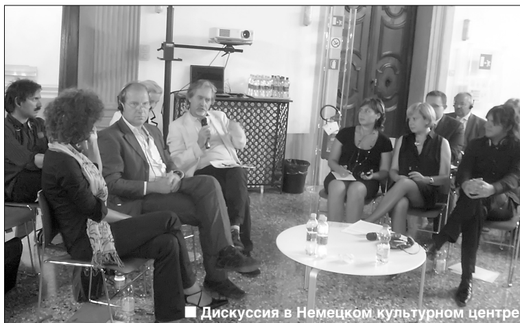
■ Дискуссия в Немецком культурном центре

— Биеннале этого года революционна для мирового архи-