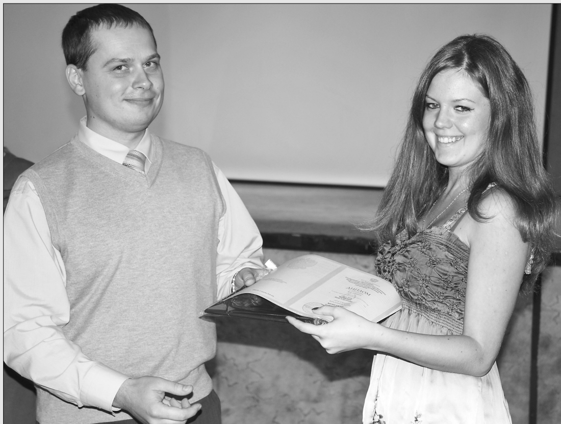
■ Торжественное вручение диплома с отличием

10 сентября стало знаменательным днём для студентов специальностей «Финансы и кредит» и «Управление персоналом» института финансов, экономики и управления. В актовом зале ТГУ им торжественно вручили долгожданные дипломы.