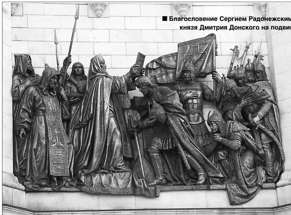
■ Благословение Сергием Радонежским князя Дмитрия Донского на подвиг

В сентябре сего года Россия отметит 630-ю годовщину великого и знакового события, оказавшего значительное влияние на развитие Российского государства, — победы войск под предводительством московского князя Дмитрия Донского над ордой захватчиков Мамай. В начале 2010 года мы совершили поход по памятным местам города Москвы XIV–XV веков, связанным с этим событием.