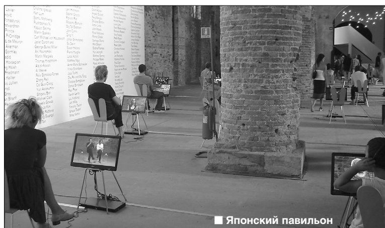
■ Японский павильон

■ Татьяна НОВИКОВА