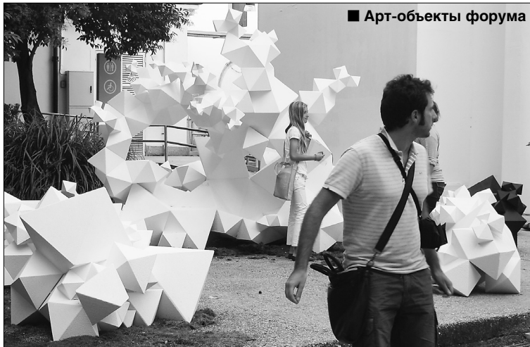
■ Арт-объекты форума

— Это крайне полезное общение на столь высоком политическом и профессиональном уровне (участники дискуссии были представлены в ранге от министра и заместителей министров различных земель Германии до руководителей департаментов градостроительства и